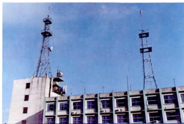
电信枢纽楼顶天线