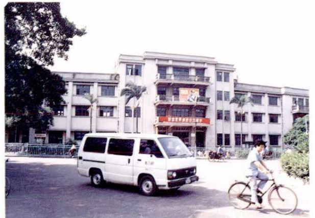
1972年建成的位于解放路13号的邮政楼