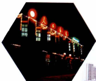
四川路营业处夜景