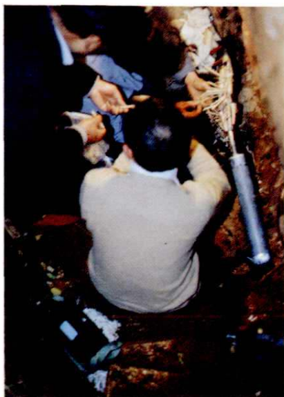
电缆人员进行割接