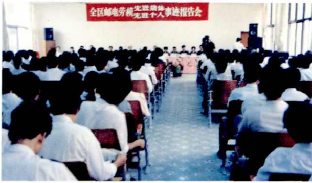
1991年10月17日全区邮电系统劳模到北海市邮电局举行报告会