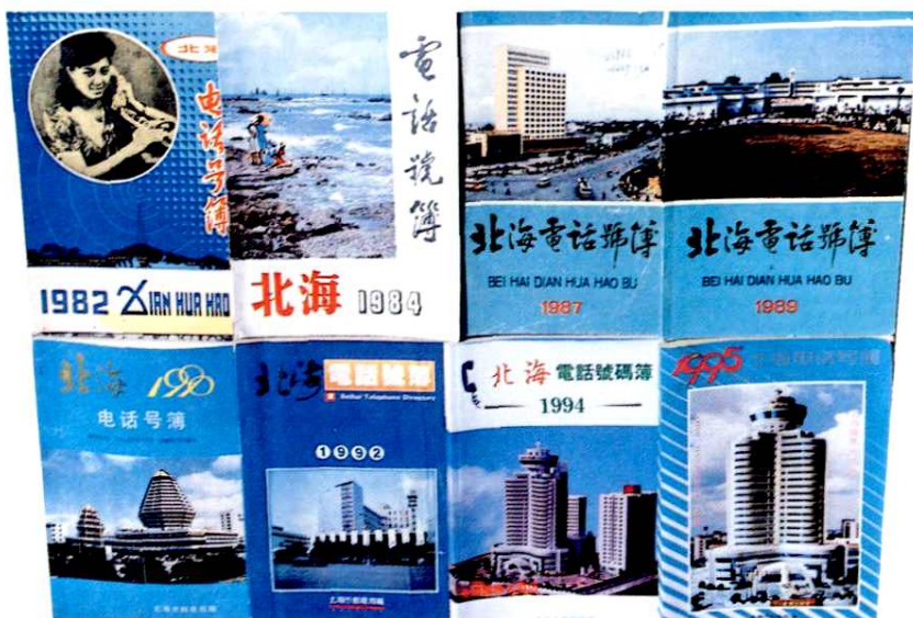
1982年以来发行的电话号簿