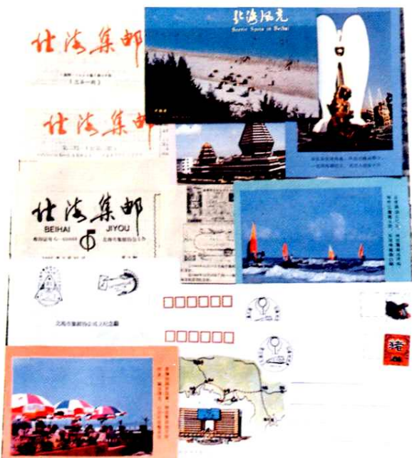
北海发行的部分集邮票品