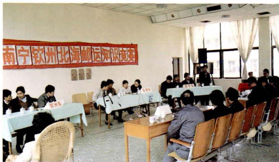
南宁钦州北海邮运知识竞赛