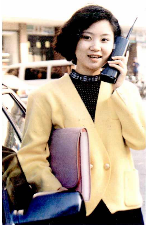
外事工作人员使用“大哥大”