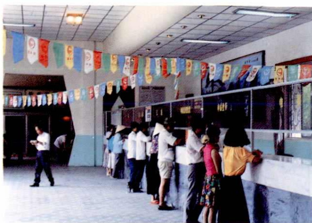
四川路电信营业厅