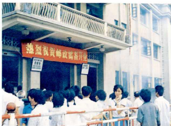
解放路营业处邮政储蓄开业