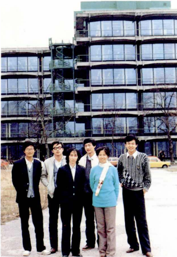
工程技术人员在德国西门子培训中心大楼前留影