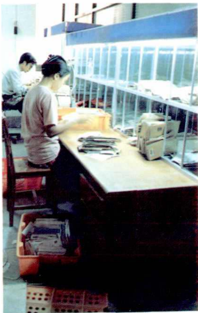
分发人员分发信件