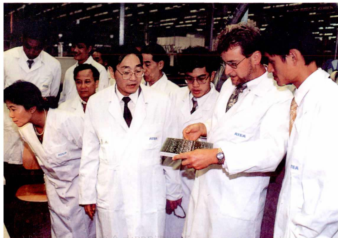
刘维身局长在比利时考察通信设备