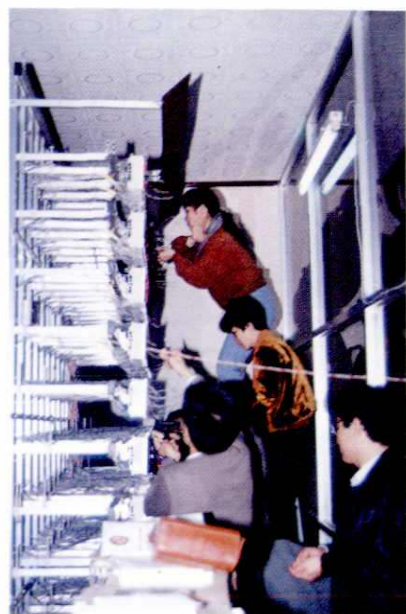
市话测量台工程技术人员在割接