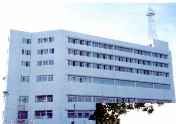
火车站邮电中心 电信楼