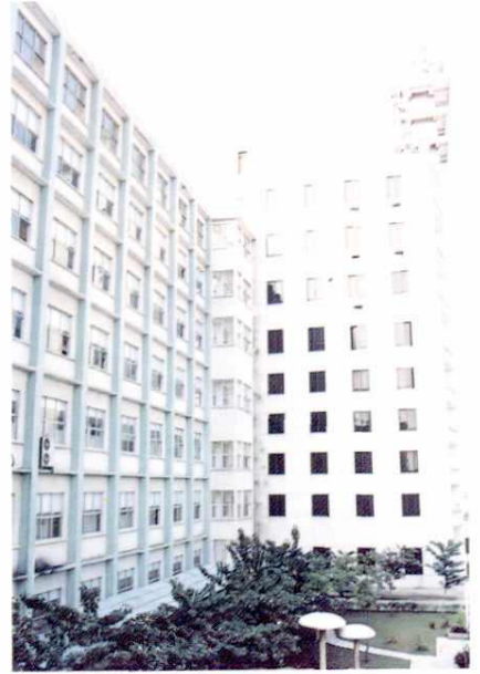
四川路电信枢纽楼