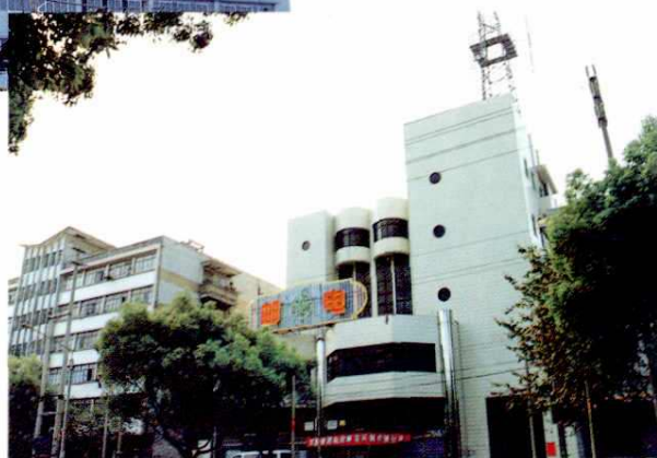
北部湾东路邮电分局