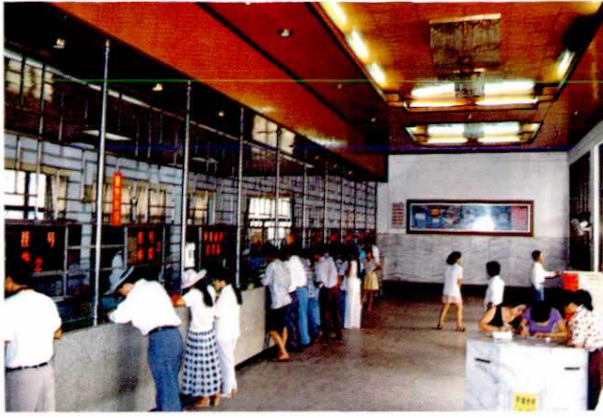
四川路邮政营业厅