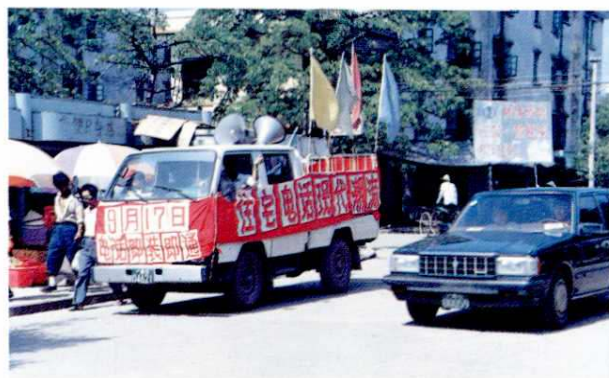
北海市邮电局组织“电话即装即通”服务