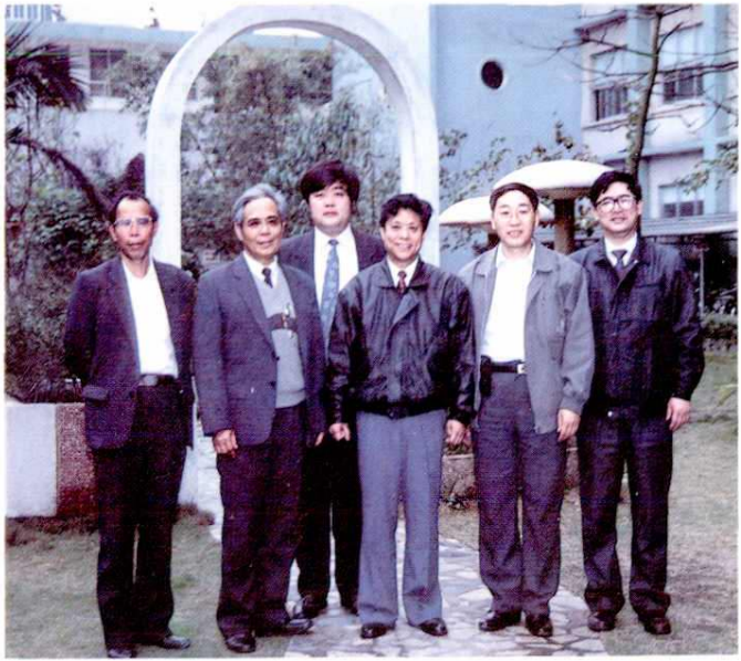
1993年3月6日邮电部副部长谢高觉(左四)到局视察并题词