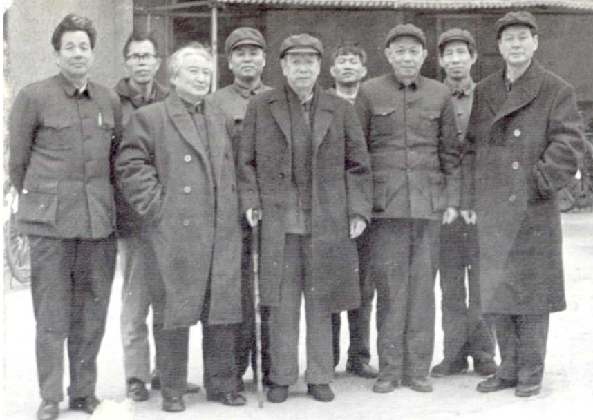
1985年1月上旬,中顾委委员、邮电部原部长王子纲(前排中)视察北海市邮电局