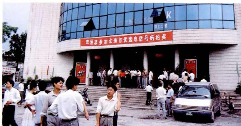
1992、1993年 北海市邮电局两次 举行优选电话号码 拍卖