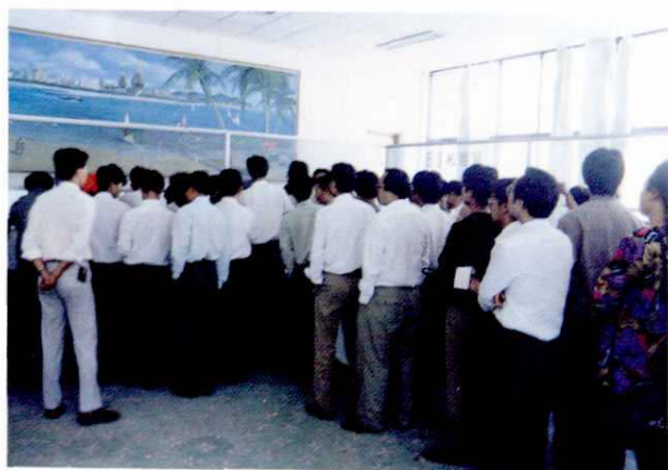
用户踊跃购买通信设备