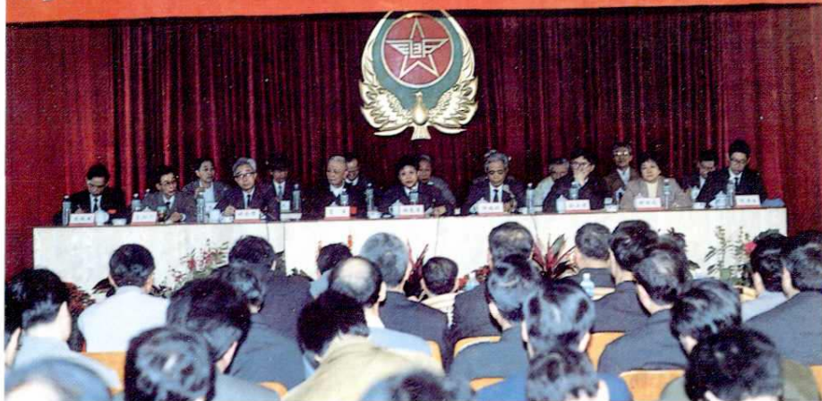
1993年3月3日 至6日第二十四次全 区邮电工作会议在 北海市邮电局举行， 邮电部副部长谢高 觉和自治区邮电管 理局新老领导出席