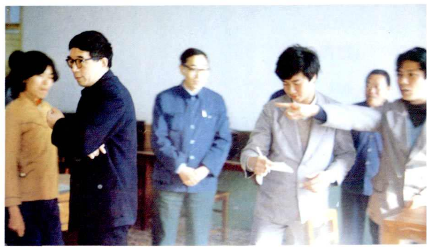
1986年1月6日至7日,邮电部副部长朱高峰(左二)视察北海市邮电局