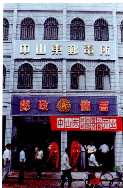
中山东路邮电所开业