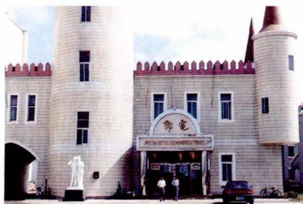
北海银滩海泰邮电营业处