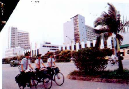
正在出班的投递员