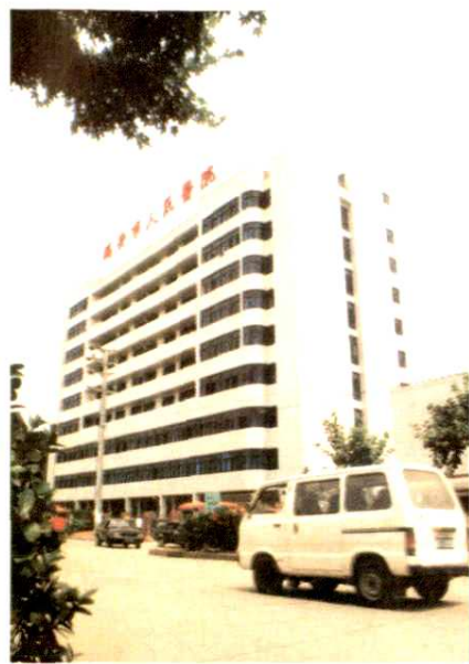
瑞安市人民医院