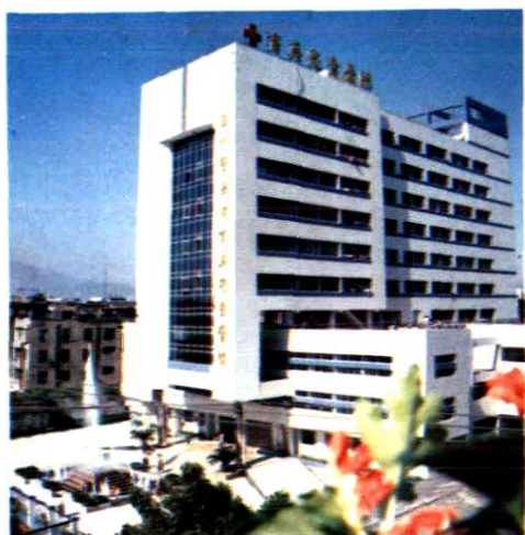
温州医学院附属第二医院、育英儿童医院