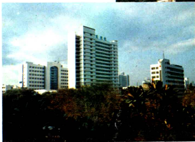
温州医学院附属第一医院全景。左为 门诊大楼,中为病房大楼,右为医技大楼