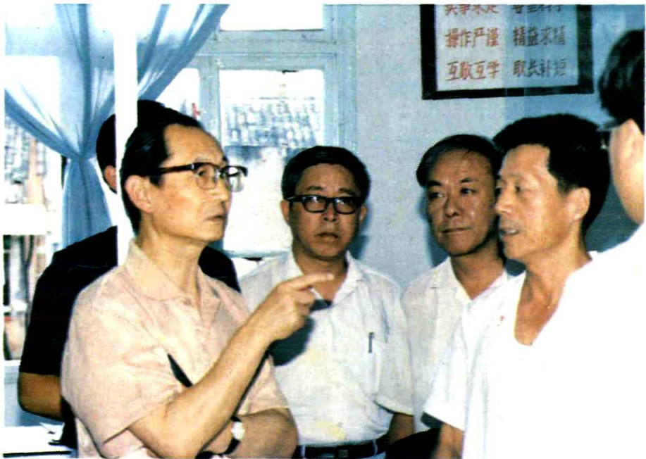
1994年8月卫生部部长陈敏章(左一)来温州视察。左二为市卫生局副局长周仲良,左三为市卫生局副局长级巡视员郑国荣