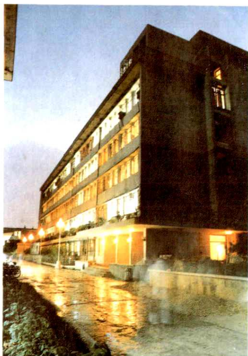
温州市第三人民医院外、妇科病房楼