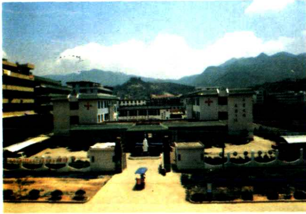
永嘉县桥头镇卫生院