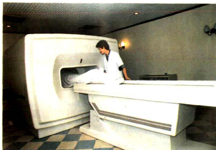
温州医学院附属第二医院为病员作核磁共振扫描检查