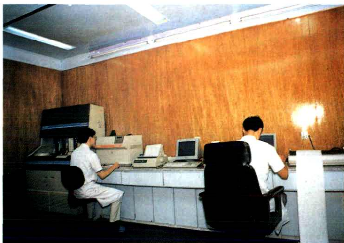
温州市第二人民医院全 自动生化分析仪正在操作