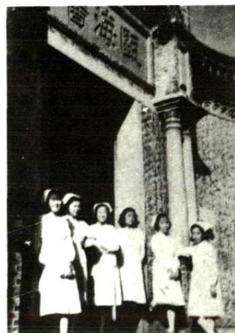
温州医学院附属第一医 院前身原瓯海医院大门