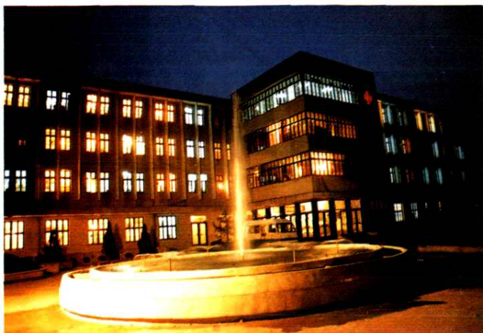
温州市第五人民医院、肿瘤医院夜景