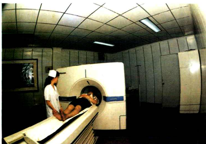
温州市第三人民医院 CT 机在为病员检查