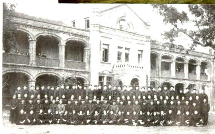
温州市第二人民医院 前身原白累德医院 病房