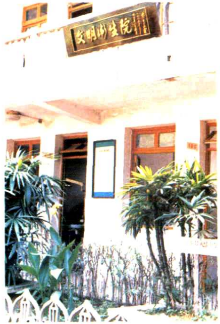
鹿城区新桥镇卫生院