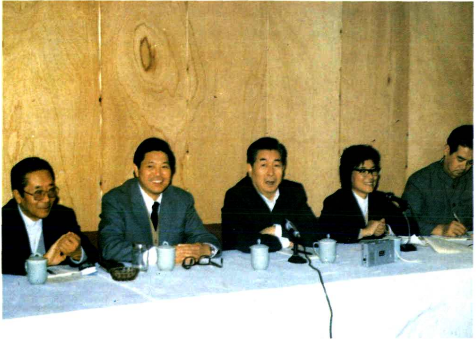
1986年11月卫生部部长崔月犁(中)来温州视察。左二为浙江省卫生厅厅长戴迪,右二为温州市副市长魏萼清