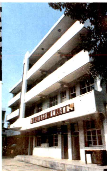
鹿城区卫生防疫站