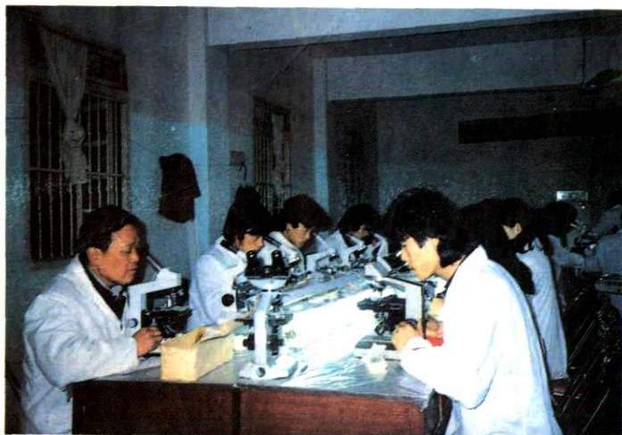
温州市卫生防疫站为消灭丝虫病开展人群血液检查