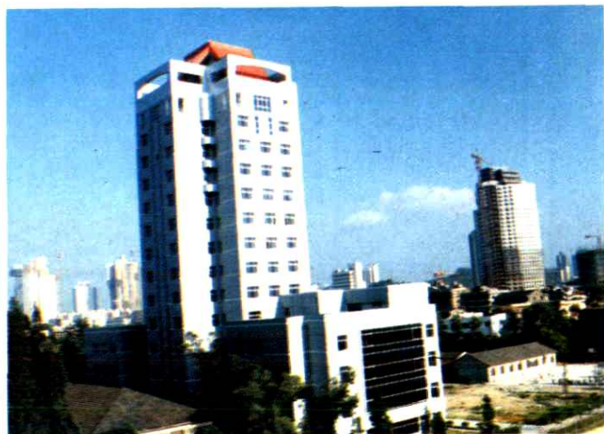
温州医学院教学大楼