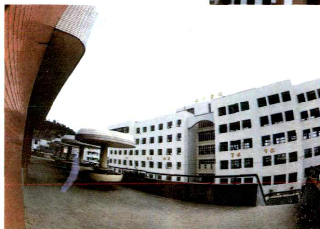
温州卫生学校教学楼