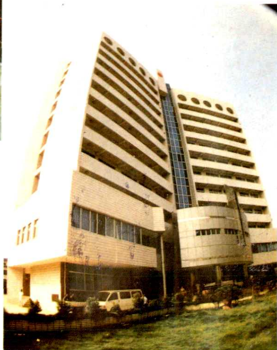
温州市第二人民医院病房大楼