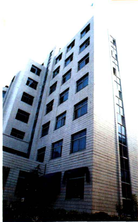
温州市中医院病房楼