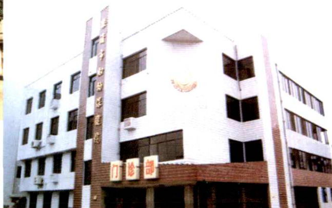
乐清市妇幼保健院