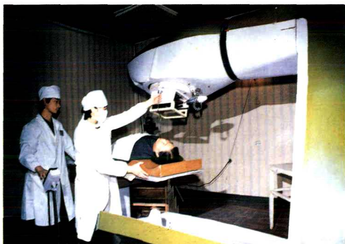
温州市肿瘤医院为病员 施行钴 60 放射治疗