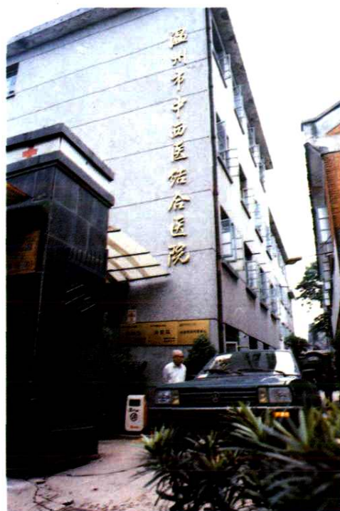
温州市中西医结合医院大门一角