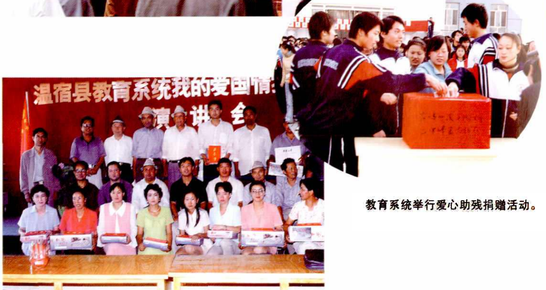
教育系统举行爱心助残捐赠活动。