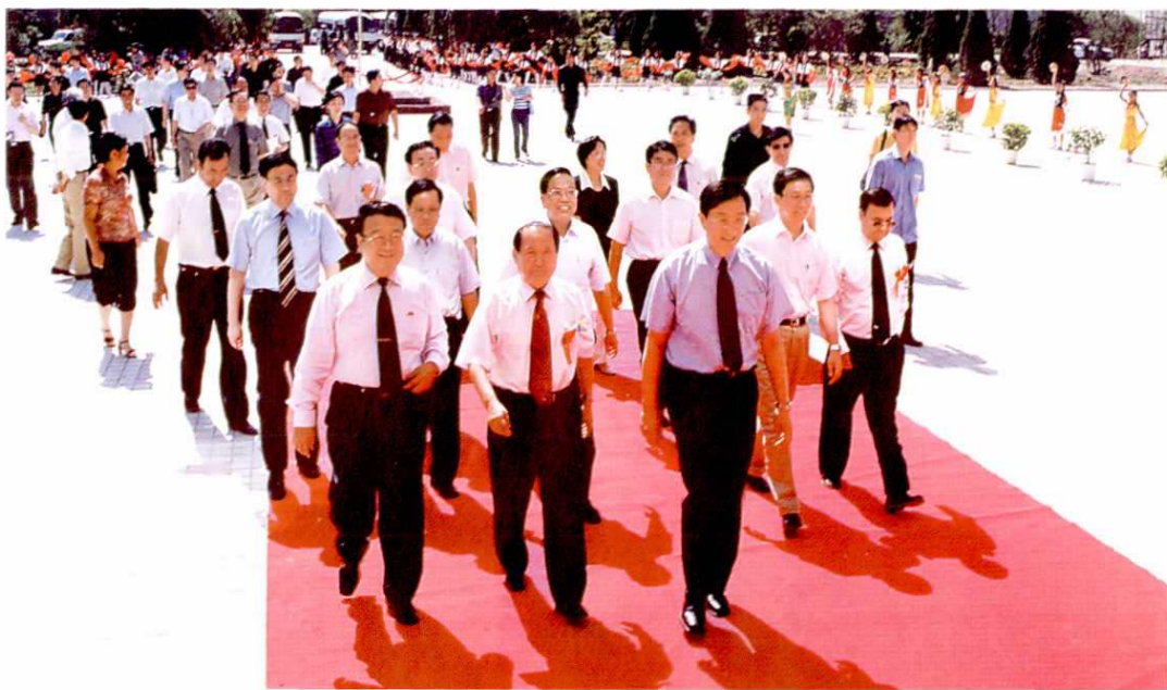
2004年7月,以中共中央政治局委员、上海市委书记陈良宇(前右一)为首的上海市代表团在自治区、地区党政领导陪同下视察阿克苏地区教师培训中心。