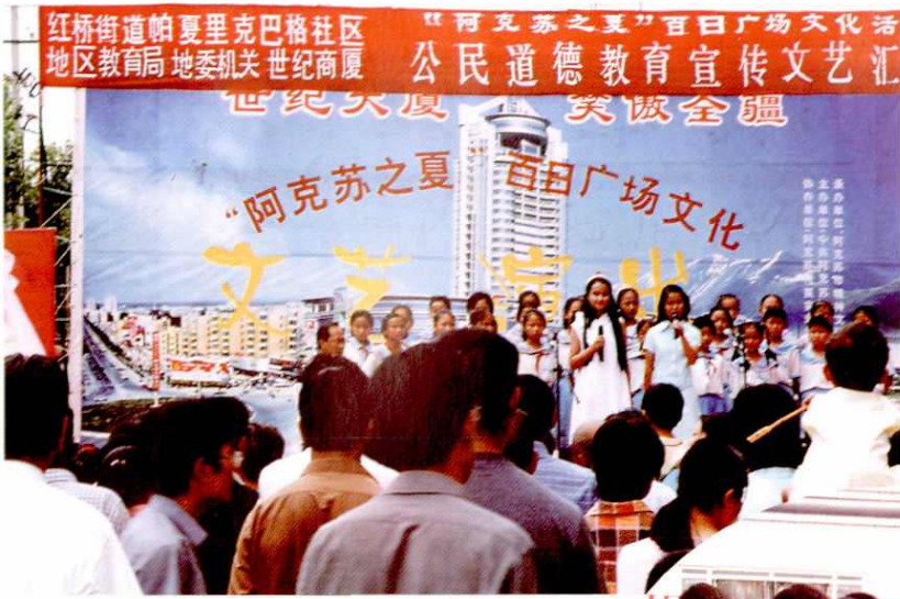
学生参加公民道德教育宣传活动。