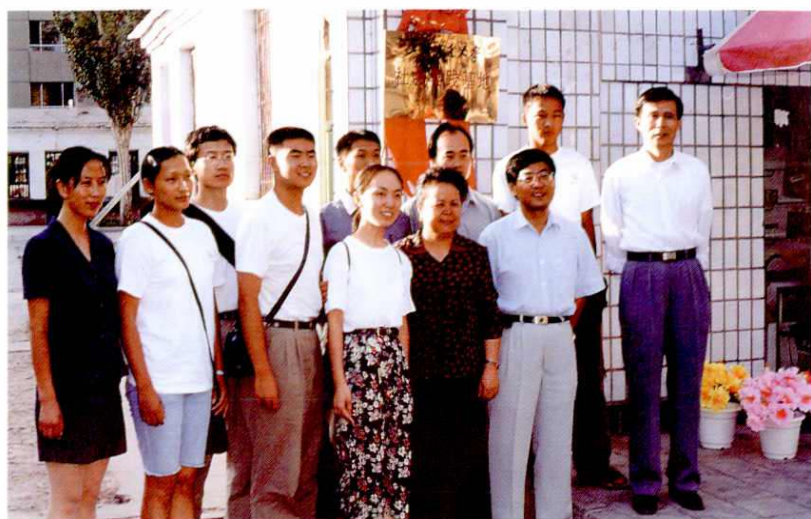
上海交通大学在阿克苏设立社会实践基地。