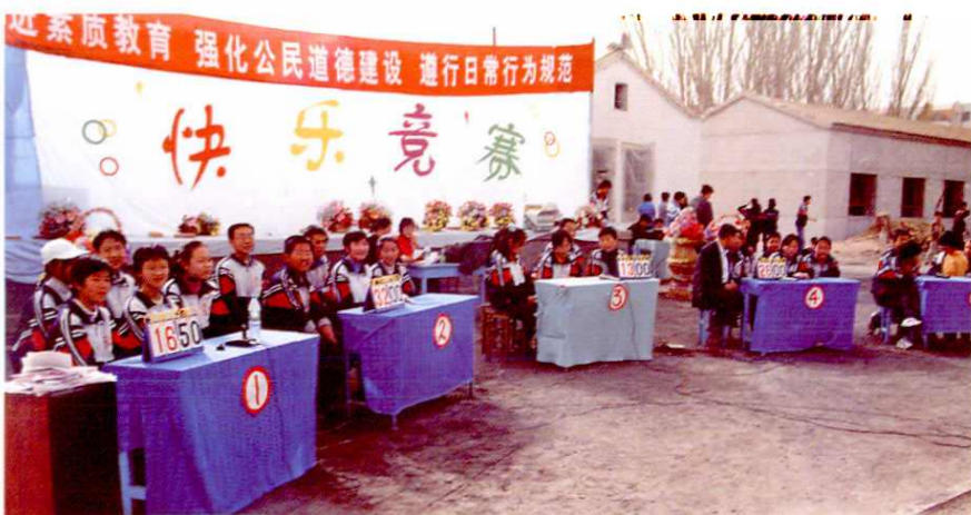
地区第二中学推进素质教育,举办“快乐竞赛”。