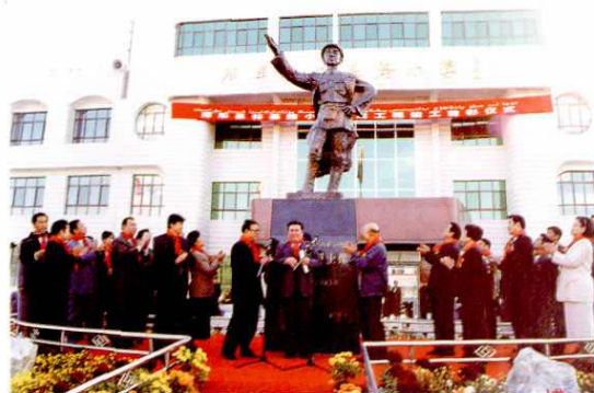
1999年10月,全国政协委员、自治区党委副书记克尤木·巴吾东在林基路小学(库车县)第三次重建剪彩仪式上讲话。