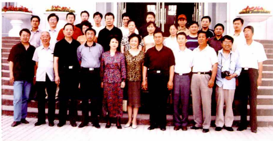
2004年6月4日，上海市第二批“银龄行动”志愿者到阿克苏地区二中参观留影。