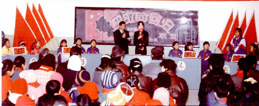
地区第九中学举行知识竞赛。