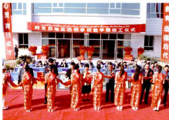
2001年9月15日，上海市黄浦区党政代表团参加由上海市援建的阿克苏地区启明学校综合教学楼竣工剪彩仪式。