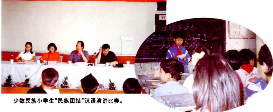
少数民族小学生“民族团结”汉语演讲比赛。