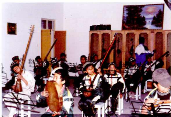
民族器乐班的学员正在演奏。