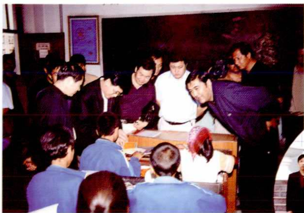
自治区党委副书记努尔·白克力视察阿克苏地区中小学。