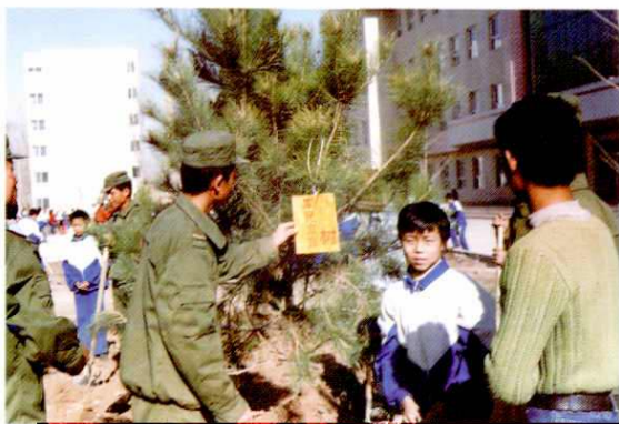
学校开展军民共建活动。