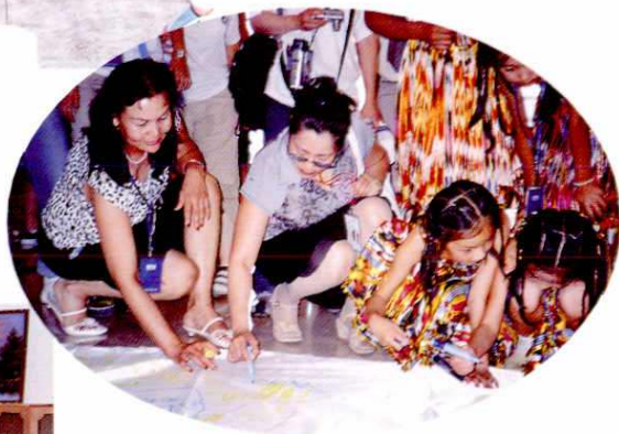
地区少年宫代表地区参加2004年在上海举办的第四届少儿国际艺术节,并签名留念。