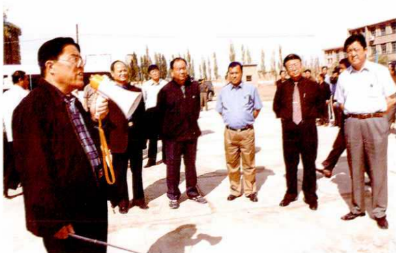
2003年5月19日,中共中央政治局委员、新疆维吾尔自治区党委书记王乐泉(前右四)在阿克苏地委、行署领导陪同下,视察阿克苏职业技术学院。