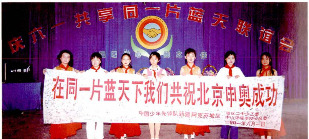
地区二中、中山聋哑学校举行联谊会。