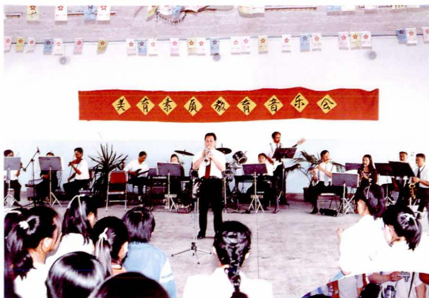
地区少年宫举办美育素质教育音乐会。