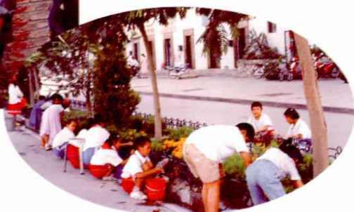
每年3月,中小学开展学雷锋活动。图为学生正在街上清洗绿化护栏。