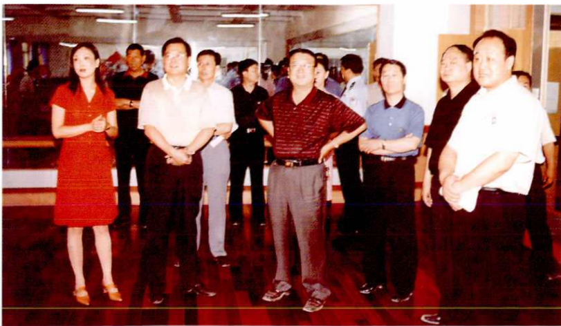
2001年7月5日,自治区人民政府副主席刘怡(前左二)视察地区少年宫。