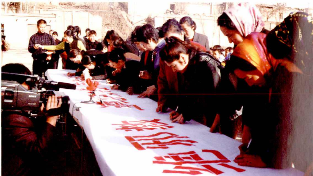
学校开展“崇尚科学、拒绝邪教”万人签名活动。