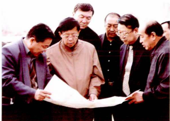
2003年4月10日,自治区人大副主任王怀玉视察阿克苏职业技术学院。