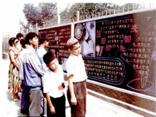
学校用黑板报进行爱国主义教育。