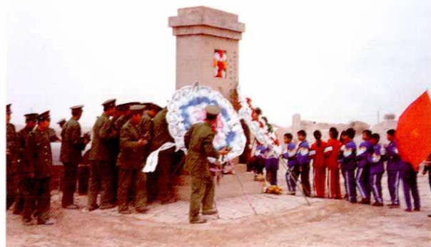
每年清明节,各校师生祭扫烈士墓,开展爱国主义教育活动。