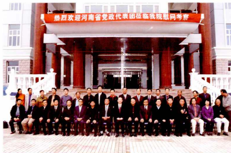
2003年9月17日，河南省党政代表团考察阿克苏职业技术学院，与阿克苏地区领导合影。