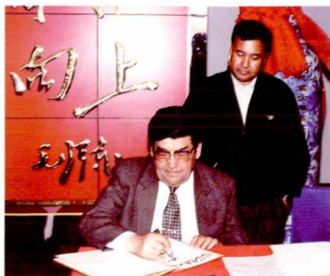
2001年9月,自治区人民政府副主席买买提明·扎克尔为阿克苏地区少年宫题词。