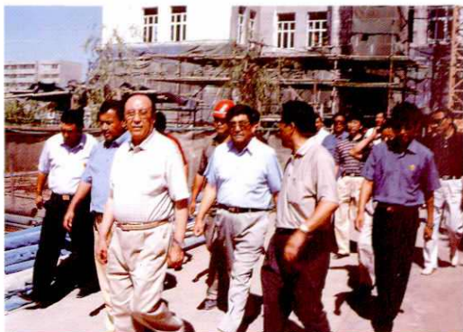
2003年7月15日,全国人大副委员长司马义·艾买提视察阿克苏地区中小学。