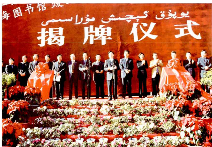
2003年10月23日，上海市委副书记王安顺(右七)和阿克苏地委书记侯长安(右八)分别代表两地，在阿克苏—上海图书馆竣工开馆暨白玉兰远程教育阿克苏开通揭牌仪式上讲话。