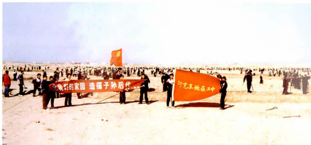
学校师生积极参加柯柯牙绿化植树造林活动。