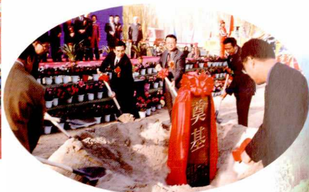
2003年10月，上海市委副书记王安顺参加阿克苏—上海教师培训中心奠基仪式。