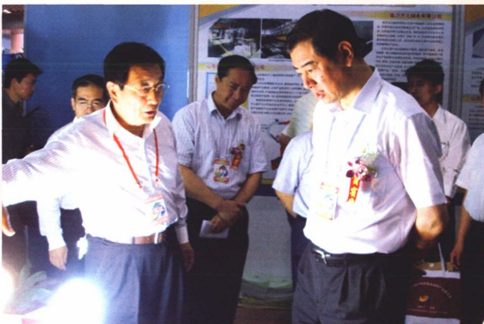
2009年7月，中共山东省常委、副省长王军民（前右一），参观在济南举办的银光集团新产品展览。临沂市人民政府副市长慕增利（前左一）陪同参观。