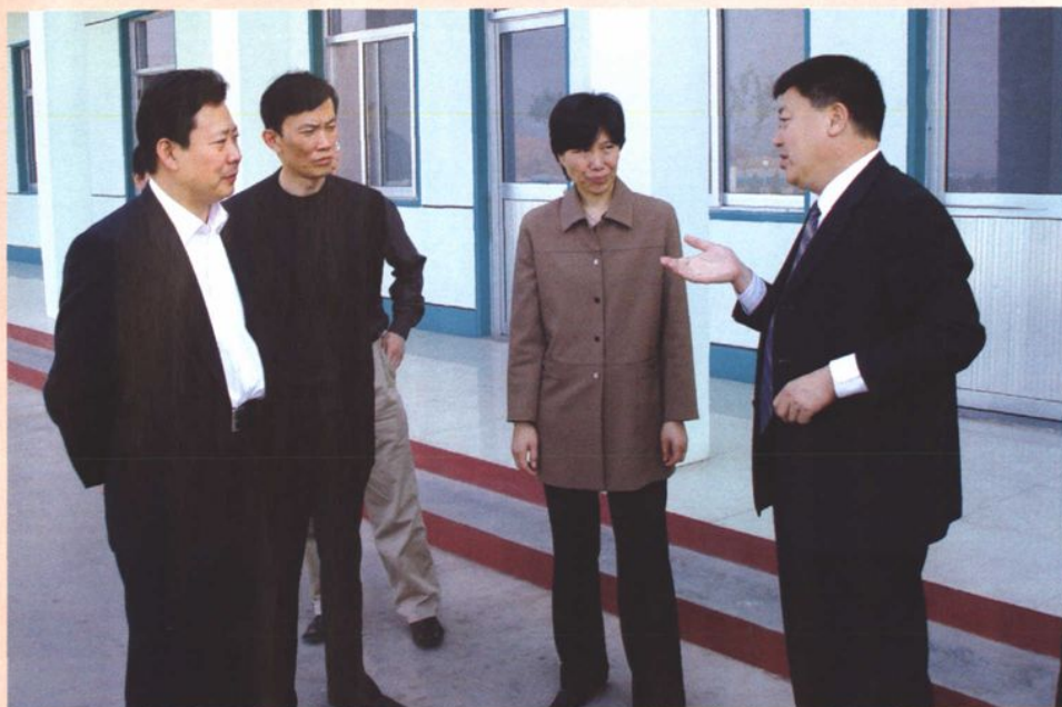
2004年4月，山东省人民政府副省长蔡秋芳（右二），来集团公司调研。中共临沂市委书记、市人大常委会主任李群（左一）、中共费县县委副书记、县长马崑（左二）陪同。