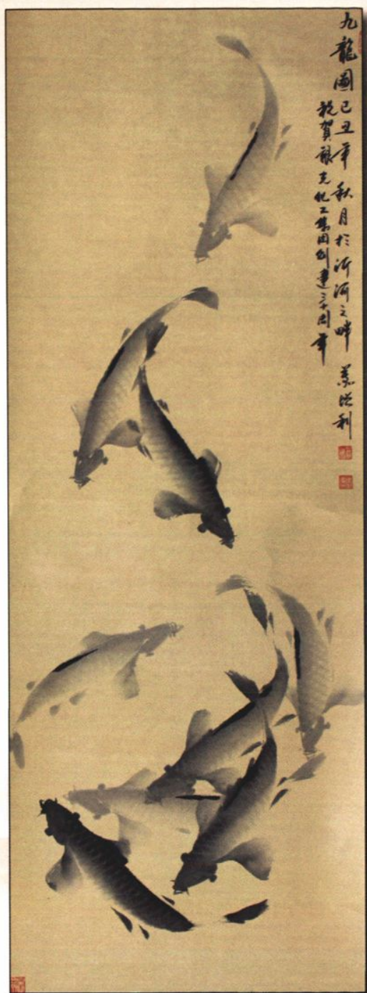
临沂市人民政府副市长慕增利为集团始创三十周年作画