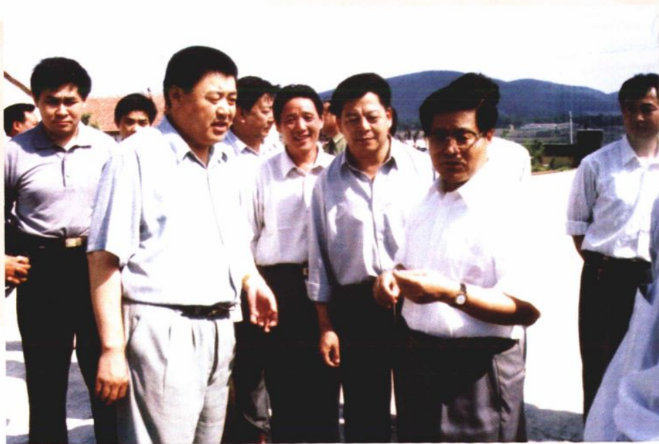
1998年6月，中共山东省委副书记、副省长宋法棠（前右一）来公司调研镁产业发展状况。