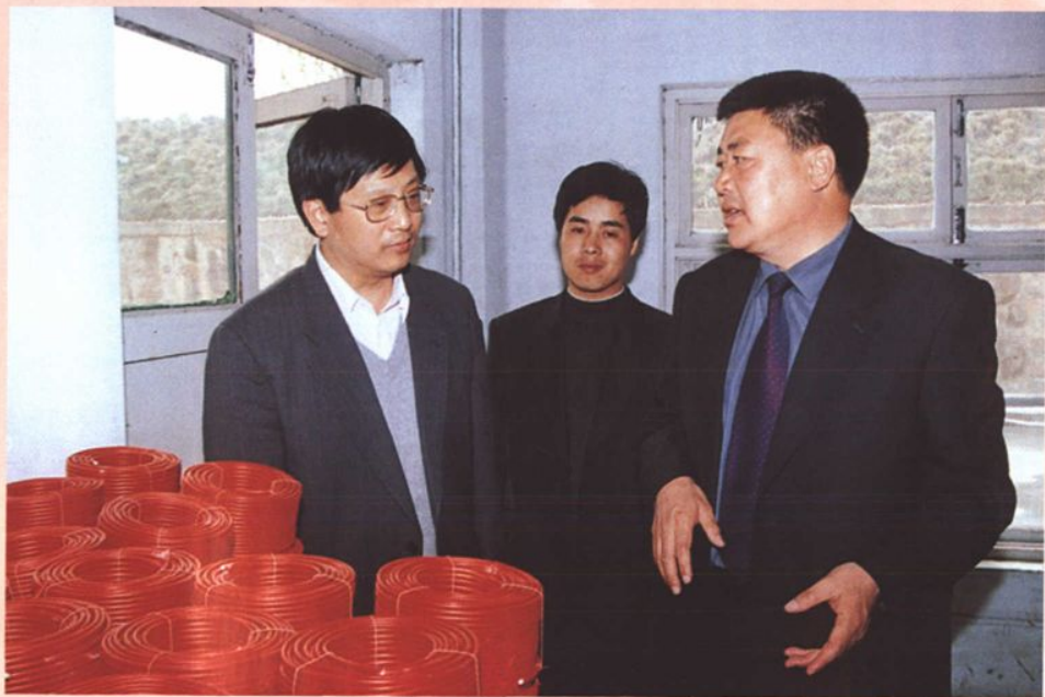
2000年11月，中国科协副主席冯长根教授（左一）来集团公司考察指导。