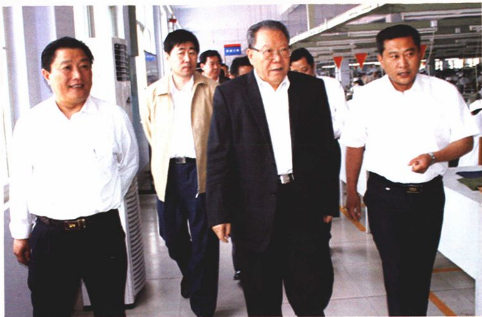
2006年5月，中共中央组织部原部长张全景（前右二）来银光精纺制品公司视察。