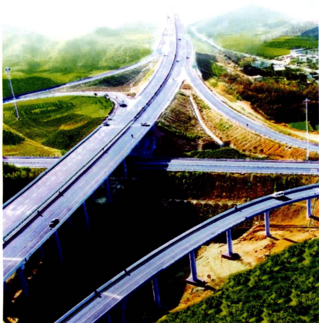
郑尧、太澳高速公路