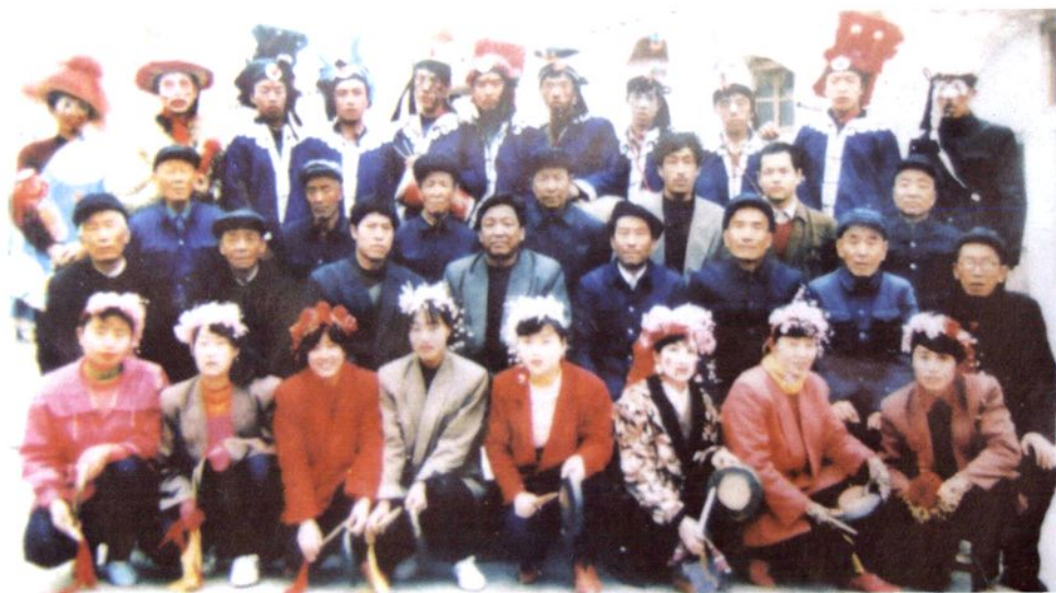
1995年村秧歌队全体合影。