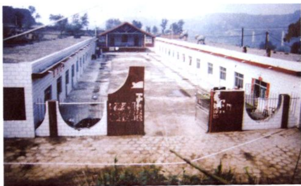
修缮美化后的戏场村委大院。