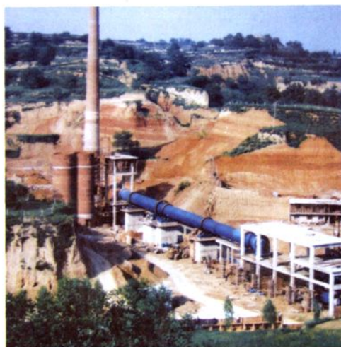
驻村孝义恒嘉煤铝企业厂貌。