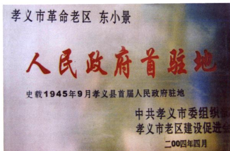
“人民政府首驻地”牌匾。