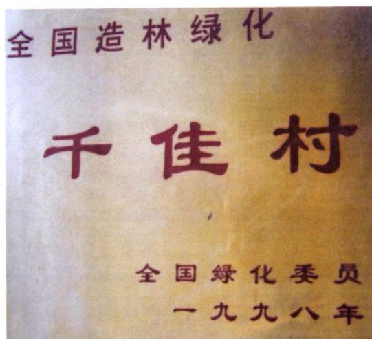
全国造林绿化“千佳村”牌匾。