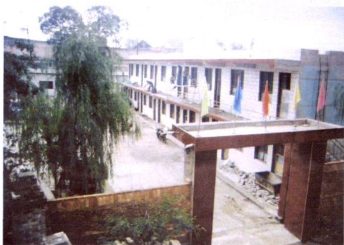
揭顶翻修美化后的村办学校。