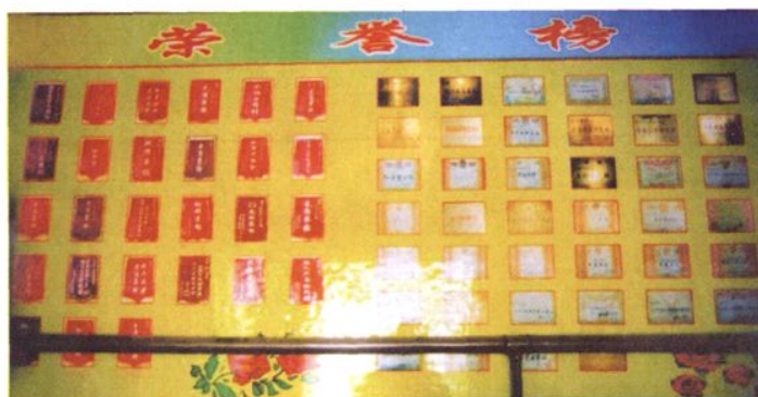
历年来获得的荣誉奖状。