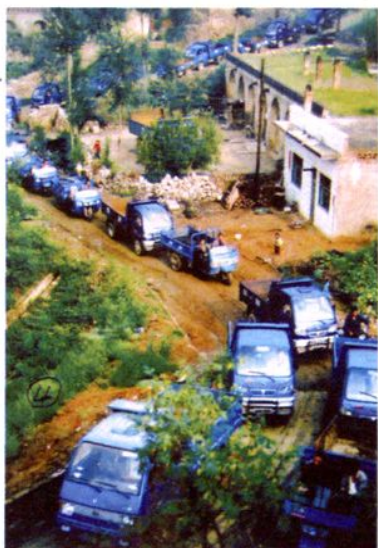
清晨出村的农用车辆。