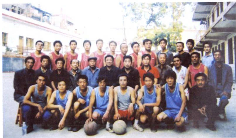
东小景村第五届运动会领导，裁判与全体篮球运动员合影。（2005年）