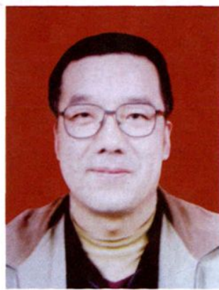
《东小景村志》总编著武立贵。