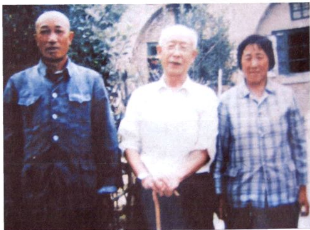
著名版画家力群先生(中)在东小景。