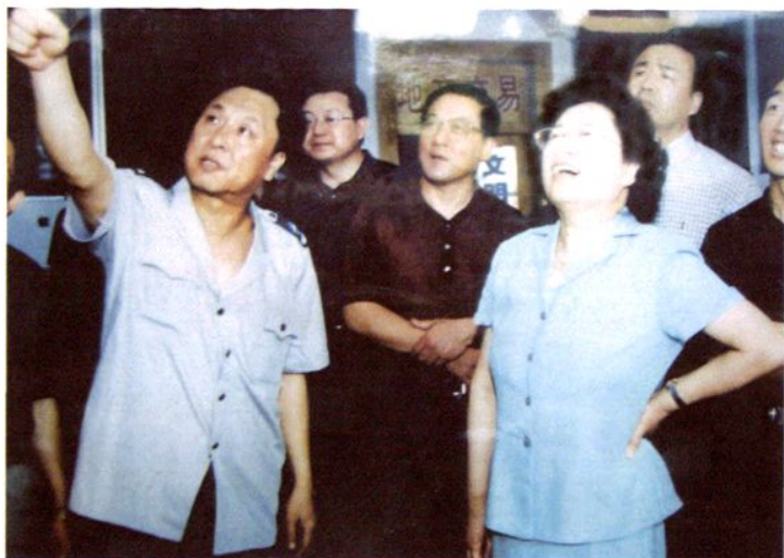
山西省委副书 记金银焕（前右） 视察孝义，市委领 导与李应仪（前 左）接待。