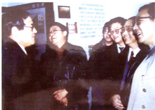
(右起) 吕梁广播电视台局长武元辉、省文化厅副厅长郭士星, 吕梁副专员郭裕玺, (左起) 省人大副主任姚新章, 省作协党组书记周振义在一起。