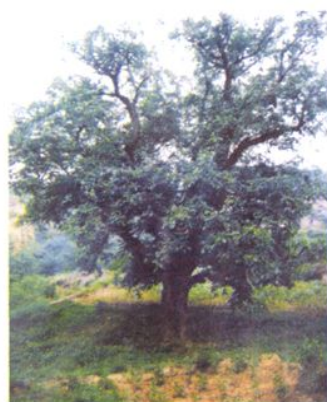
全村最大的核桃树。