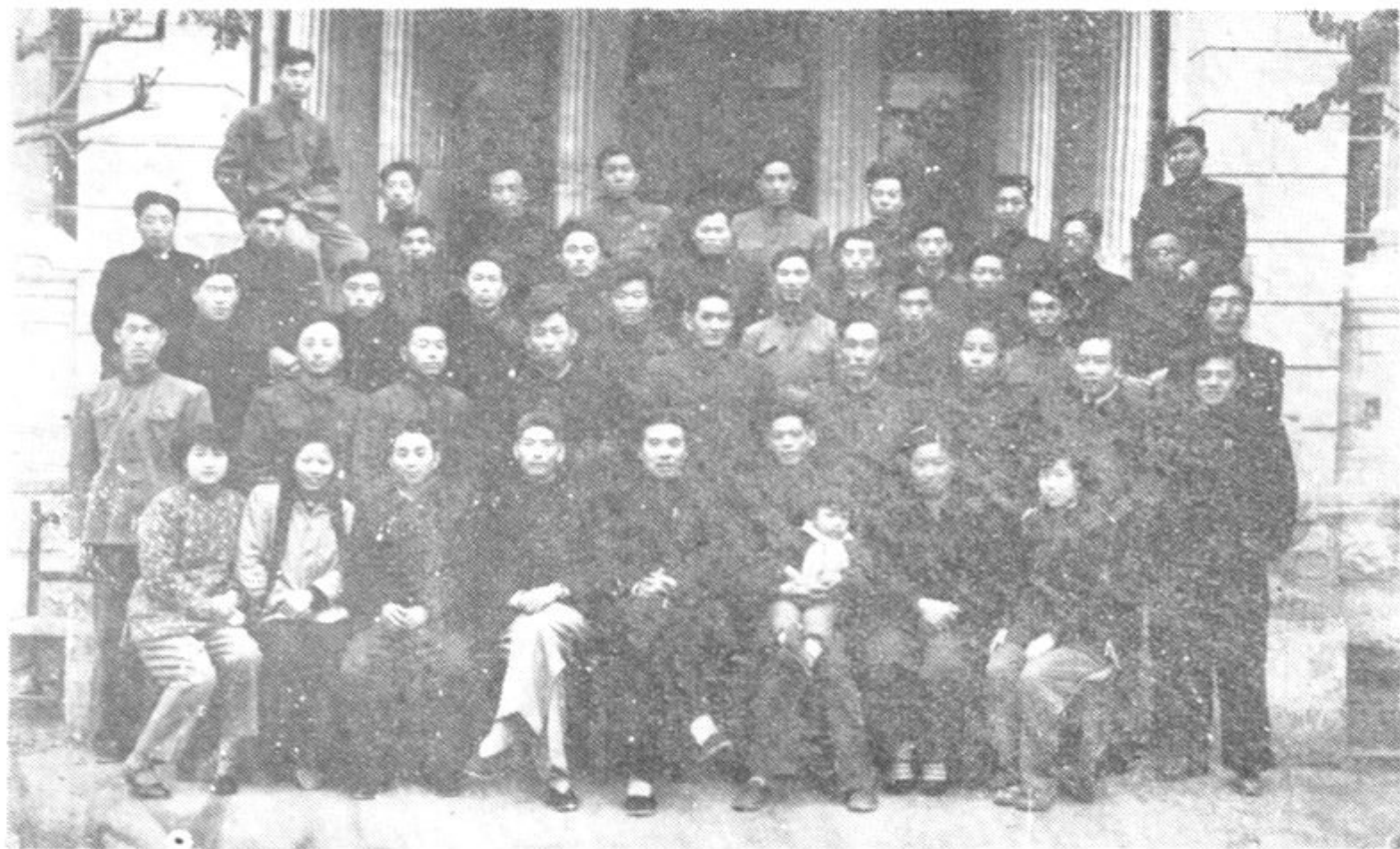
中国共产党黑龙江省监察委员会全体同志合影 一九五七年十月十一日