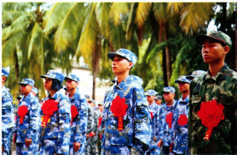
2016年陵水新兵从椰林镇的土地上应征入伍