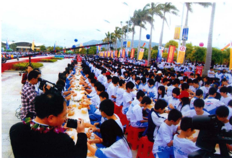
陵水椰林镇举行万人同吃“陵水酸粉”创吉尼斯世界纪录