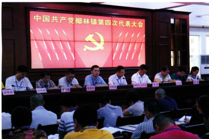
2016年9月22日，中共椰林镇第四次代表大会主席台