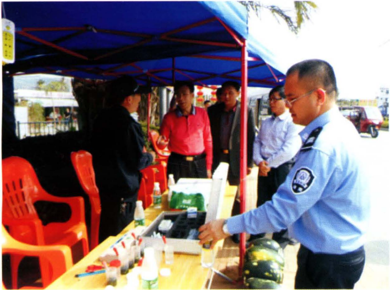
2015年2月16日，海南省副省长陈志荣（上身为红衣服）、省农业厅总农艺师黄正恩莅临椰林高速路口检测站检查指导工作。