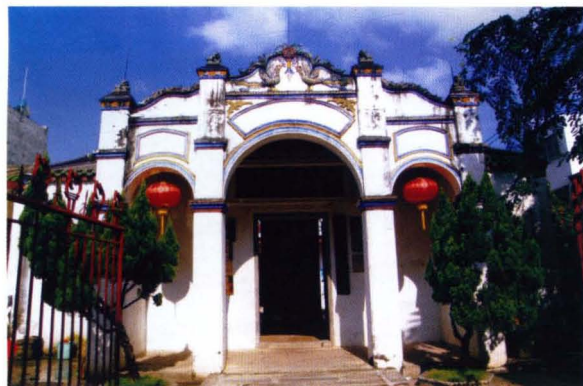
琼山会馆——陵水县苏维埃政府旧址