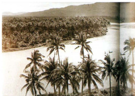
碧水椰风（摄于一九六八年）