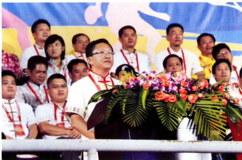
县委书记麦正华在陵水第三届体育运动会开幕式上致辞