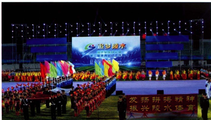
陵水黎族自治县第三届体育运动会于2015年11月25日在椰林镇举行