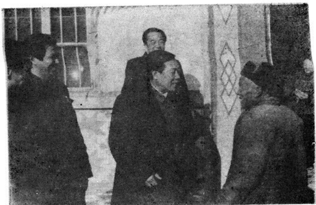
1989年1月27日，山东省计划生育委员会主任刘汉彬来费县检查指导工作。图为刘主任（中）在副县长张玉佩（左二）、探沂镇委书记赵贵廷（左一）陪同下，参观探沂镇敬老院，在和孤寡老人亲切交谈。