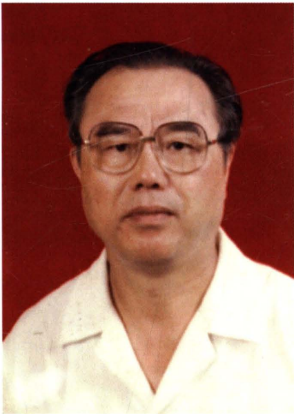
胡兆祥，民盟萍乡市委会第一、二、三、届主委，原市政府副市长、市政协副主席。