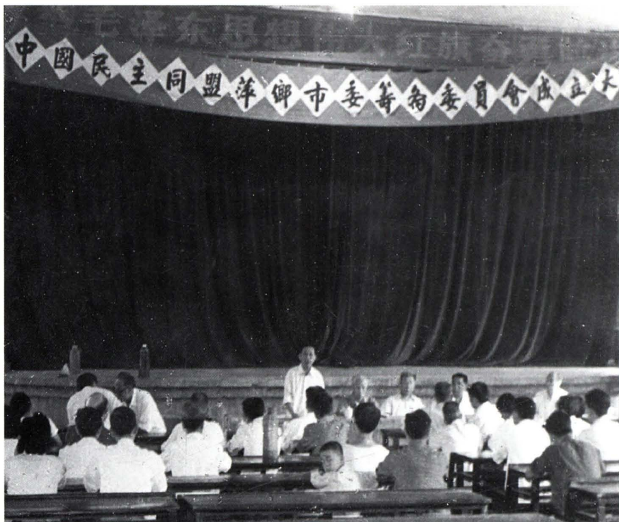
1983年9月民盟萍鄉市委籌備委員會成立大會會場。