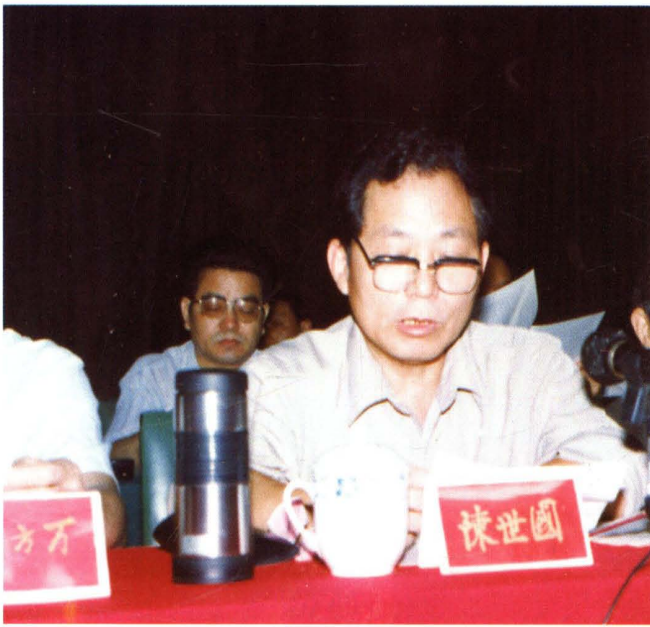
市政协主席 陈世国亲临 盟员大会并 讲话