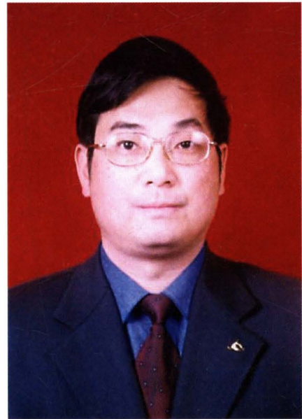
何建洋，现任民盟萍乡市委会主委、市政府副市长。