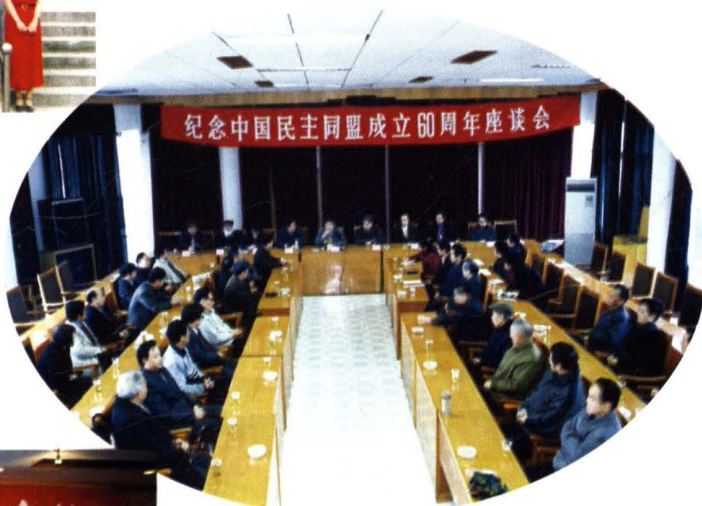
民盟萍乡市委举行纪念中国民主同盟成立60周年座谈会。