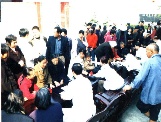
民盟萍乡市委每年组织开展支老扶贫、送医送药等社会服务活动。图为民盟医疗专家「乡村行」义诊现场。