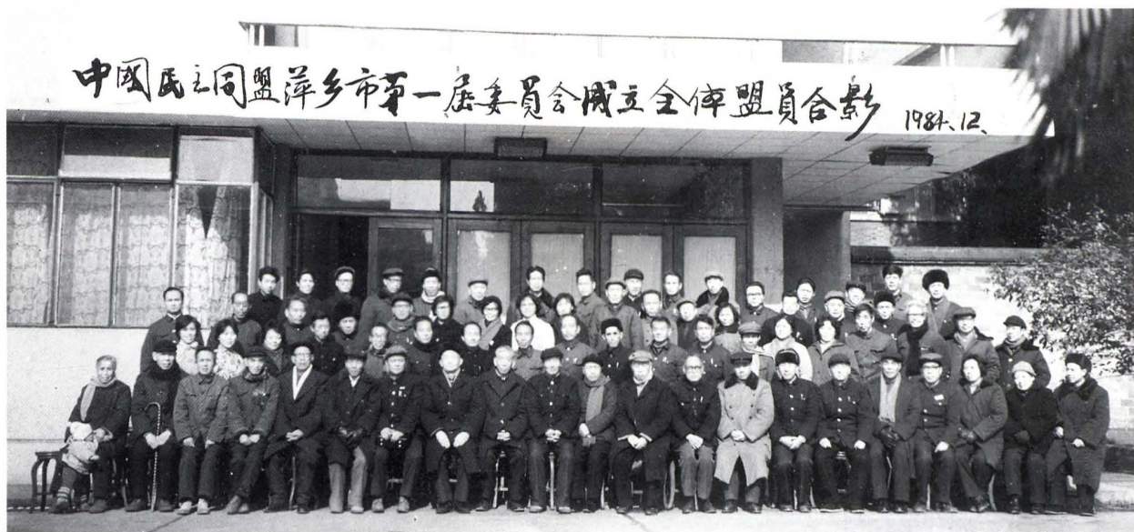
民盟萍鄉市第一屆委員會成立時全體盟員合影。