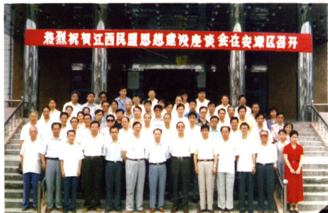
江西民盟思想建设座谈会在我市安源区召开。图为出席会议的领导和与会人员合影。