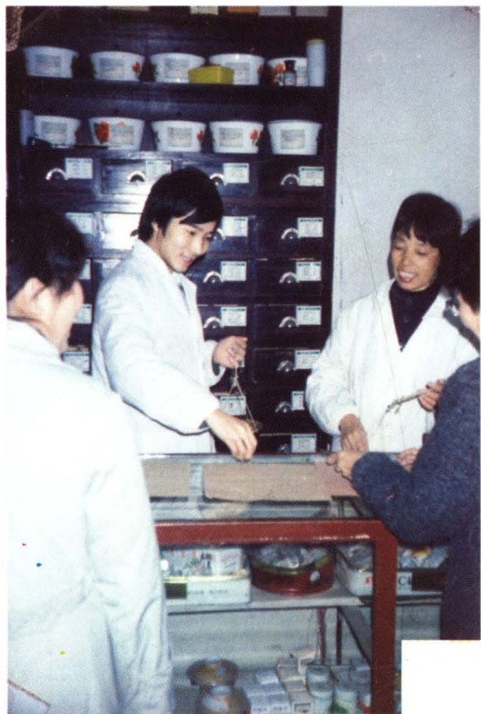
民盟萍乡市委创办的济人诊所。 图为诊所医务人员正在工作。