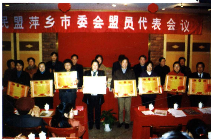
民盟萍乡市委每年对先进支部和优秀盟员进行表彰。图为先进支部正在受奖。