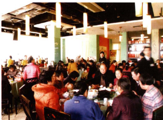
用餐时的热闹场景