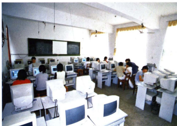
民盟萍乡市委创办的萍乡市树人学校。图为学校微机室。