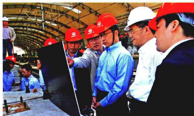
2009年5月6日，中共上海市委副书记、市长韩正视察建设中的轨道交通11号线南翔站