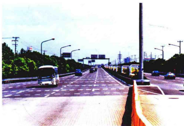
沪嘉高速南翔入口处