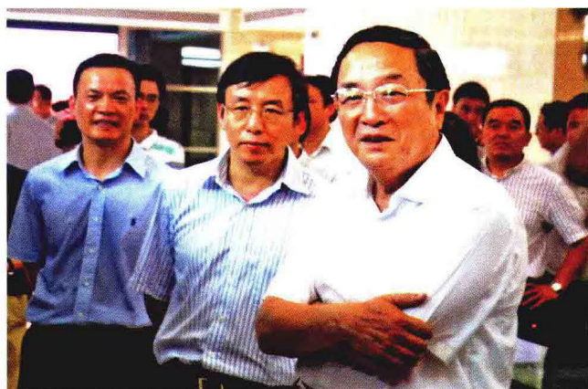
2010年8月24日，中共中央政治局委员、上海市委书记俞正声视察上海蓝天创业广场