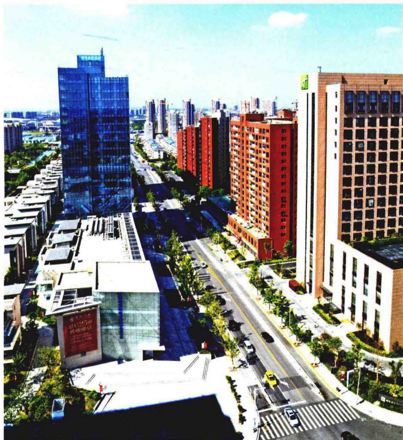
银南翔文化商务区银翔路两侧