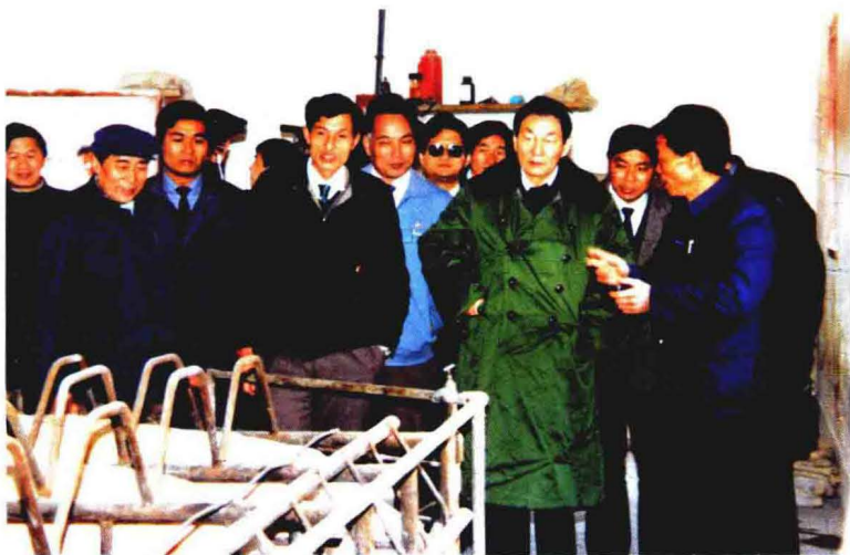
1990年3月2日，中共上海市委书记、市长朱镕基视察南翔镇外贸良种猪场