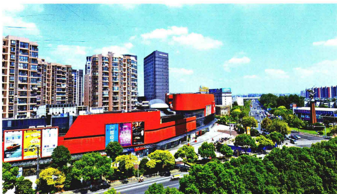
上海中冶祥腾城市广场综合体