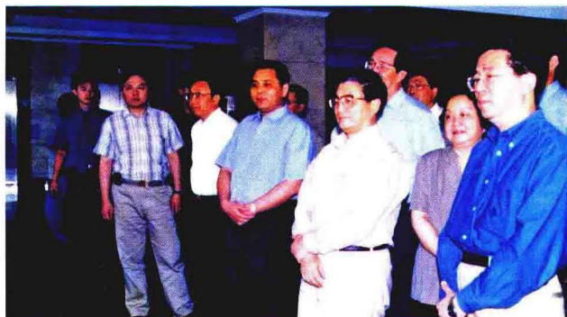
2000年6月15日，中共中央政治局委员、上海市委书记黄菊视察南翔镇