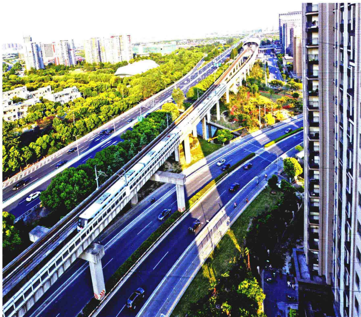
沪嘉高速公路、轨道交通11号线、真南路穿越集镇区