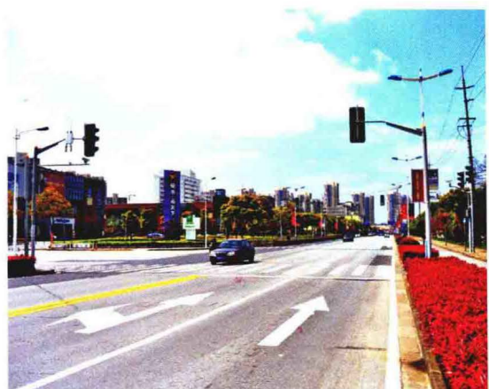
沪宜公路（204国道）南翔段