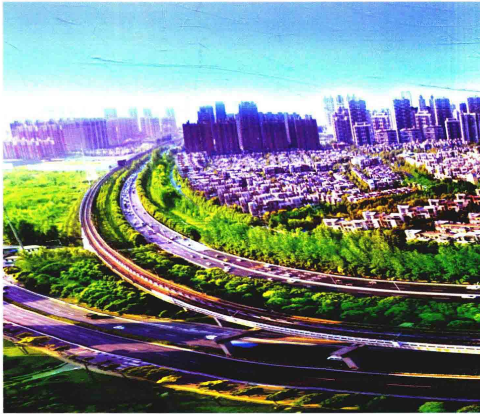
金地格林世界住宅小区