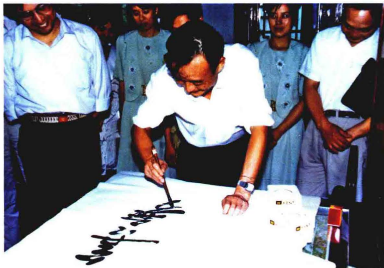
1992年7月2日，中共中央政治局委员、上海市委书记吴邦国视察南翔镇，并为南翔题词“长袖善舞”