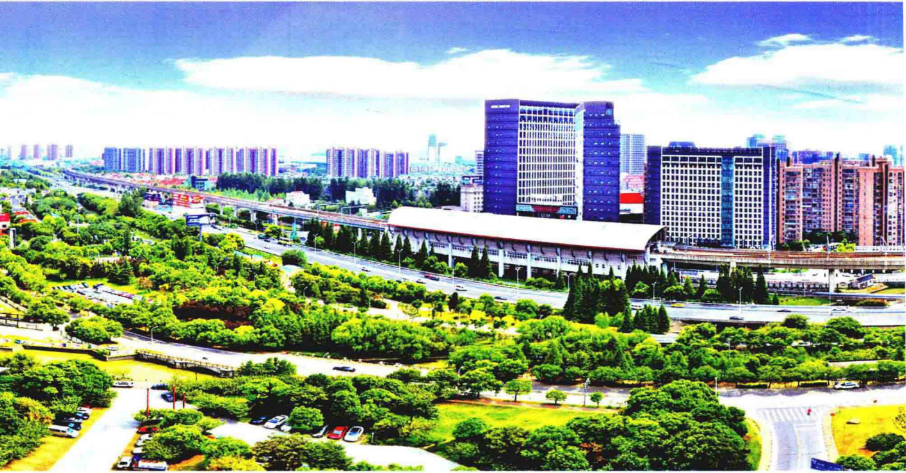
轨道交通11号线南翔站点商务楼宇及住宅小区