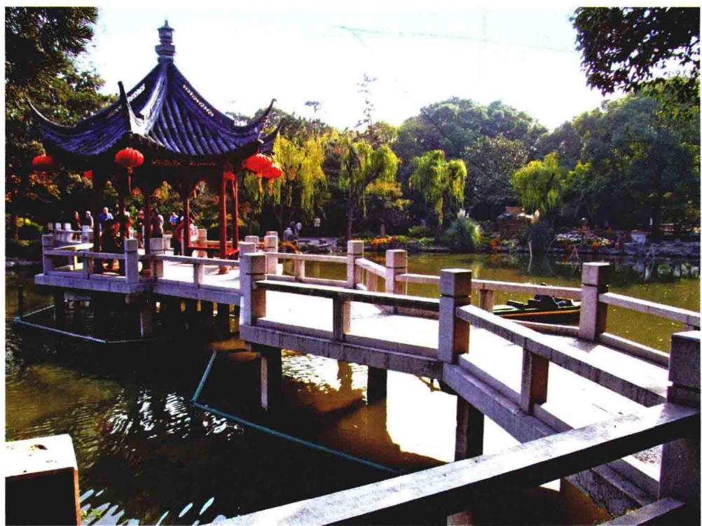
古猗园九曲桥湖心亭