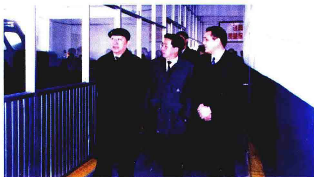
1999年12月23日，中共上海市委副书记、市长徐匡迪视察上海华新电线电缆有限公司