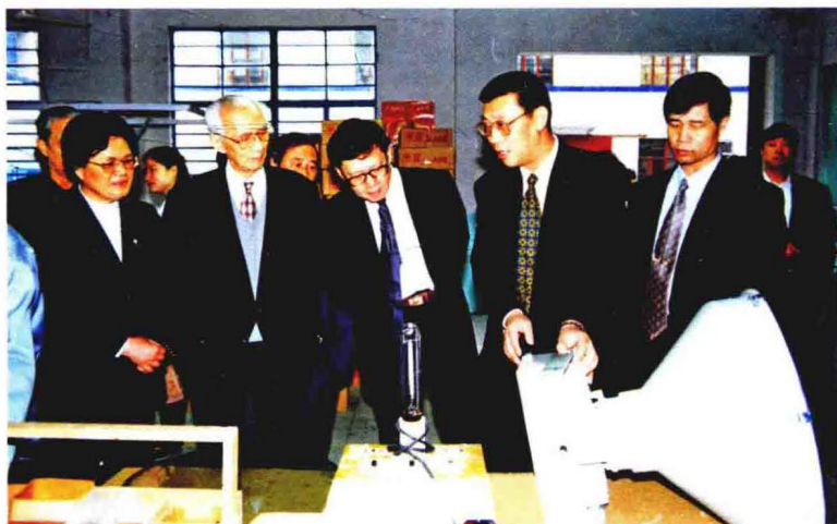
1998年4月7日，全国政协副主席、全国工商联主席经叔平视察上海蓝天经济城下属企业生产情况