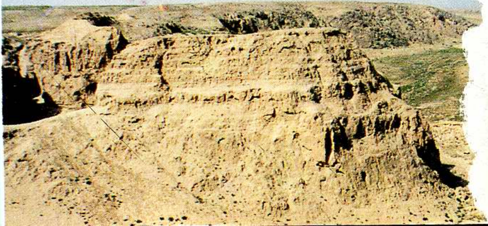
明代清水河改 道工程遗址