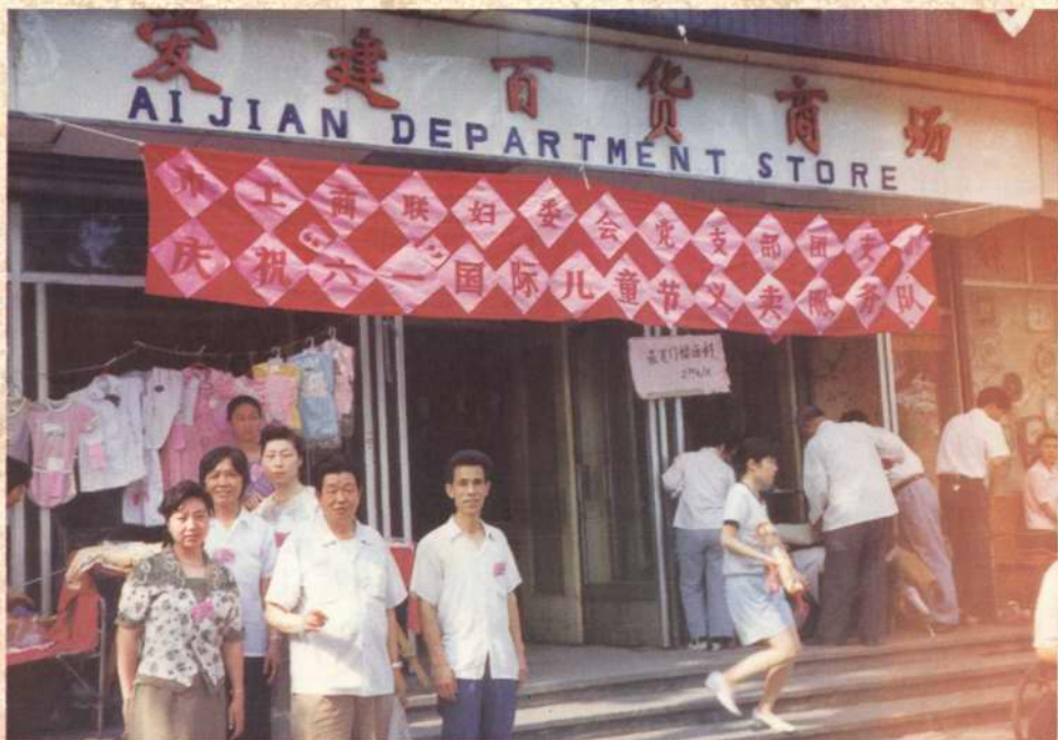
1985年10月开业的爱建百货商场