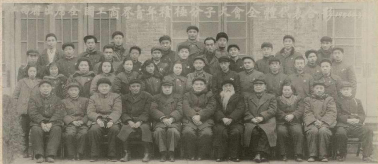
1956年3月8日，江西省省長邵式平與出席全國工商界青年積極分子大會的全體代表合影