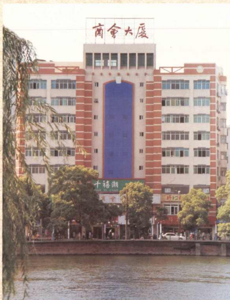
1999年8月竣工的南昌市工商联办公大楼