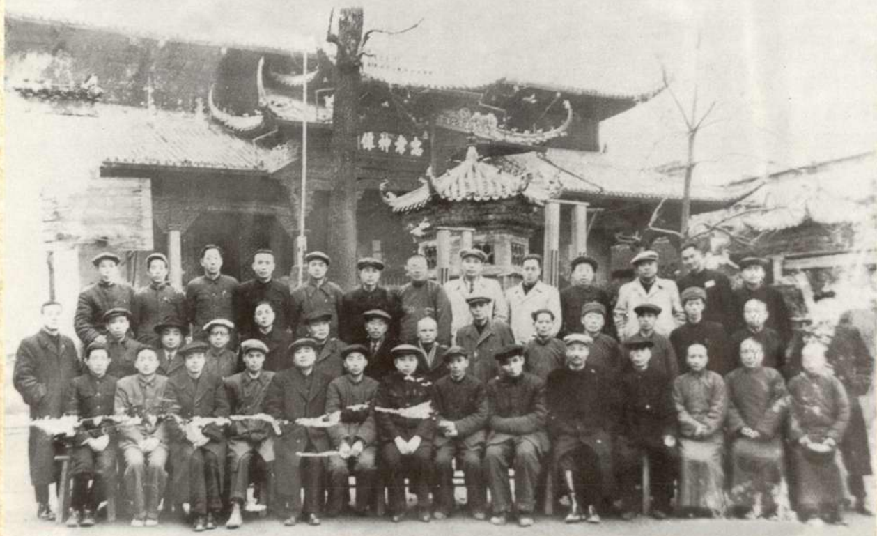
1949年12月20日，南昌市工商业联合会筹备委员会合影