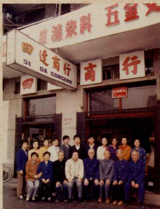
1980年，市工商聯與瓦子角街辦合作開辦四達商行