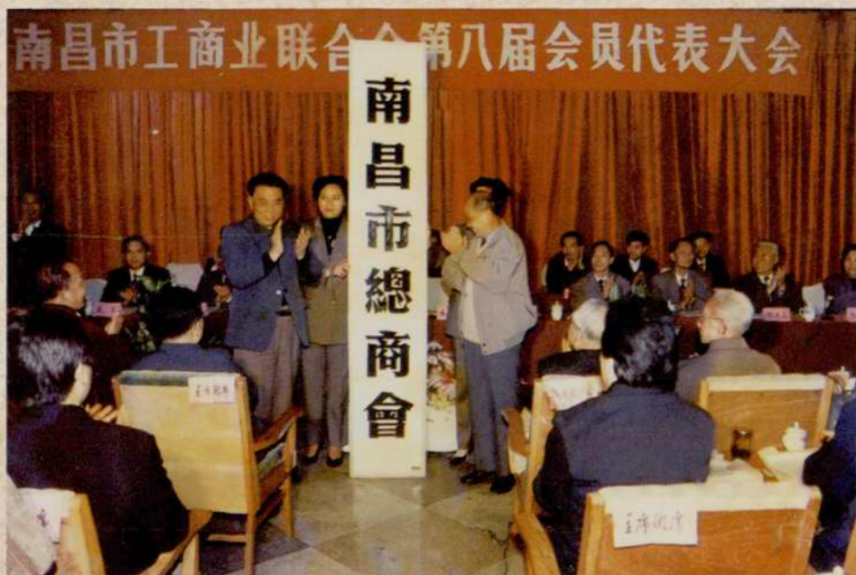
1994年11月，市工商联八届会员代表大会期间，举行了隆重的南昌市总商会揭牌仪式，省政协副主席、省工商联会长厉志成、市委副书记陈绍翔出席