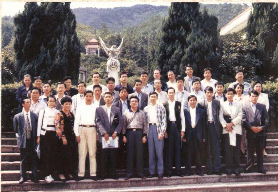
1998年9月，市工商联在湾里举办基层骨干、新会员培训班