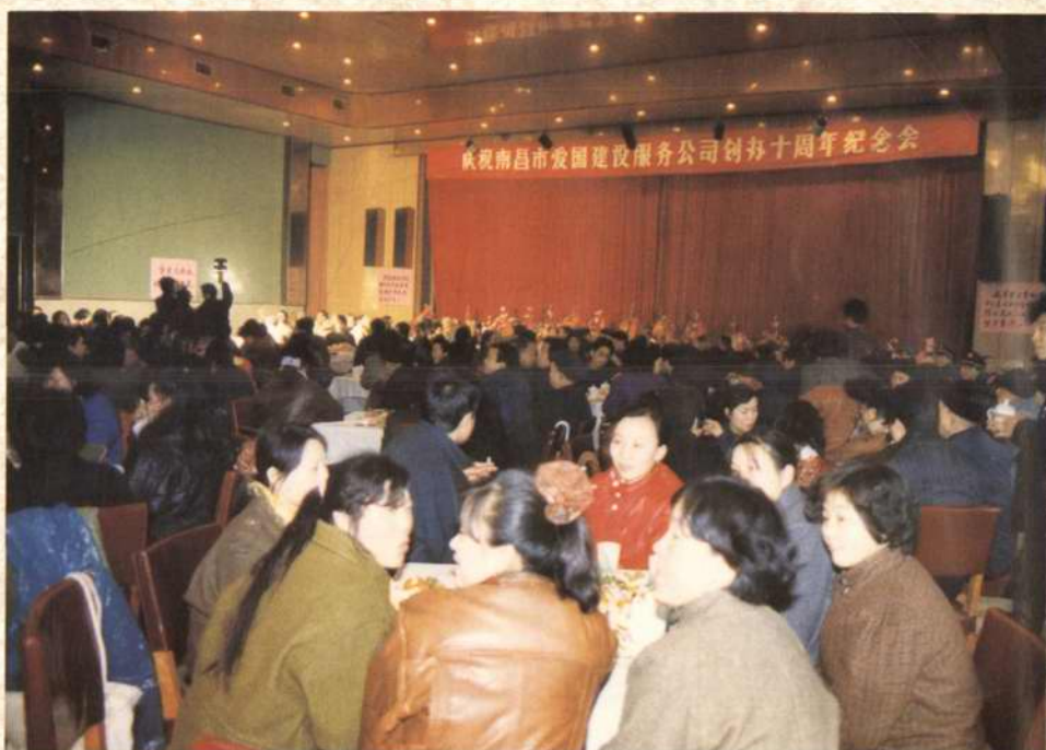
1991年1月23日，市工商联在南昌宾馆举行庆祝南昌市爱国建设服务公司创办十周年纪念会