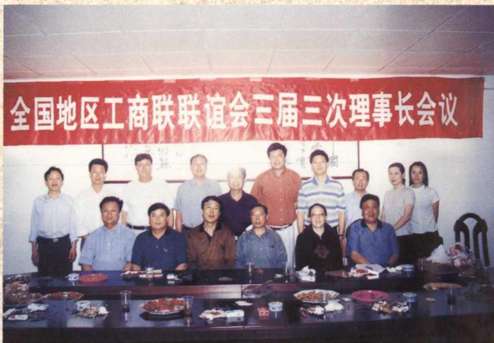
2000年6月，全国地区工商联联谊会三届三次理事长会议在南昌召开