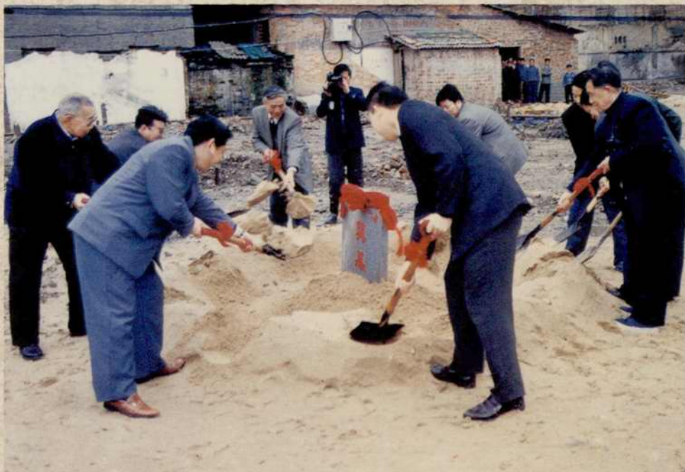
1998年4月1日，市工商联举行兴建办公大楼奠基典礼仪式