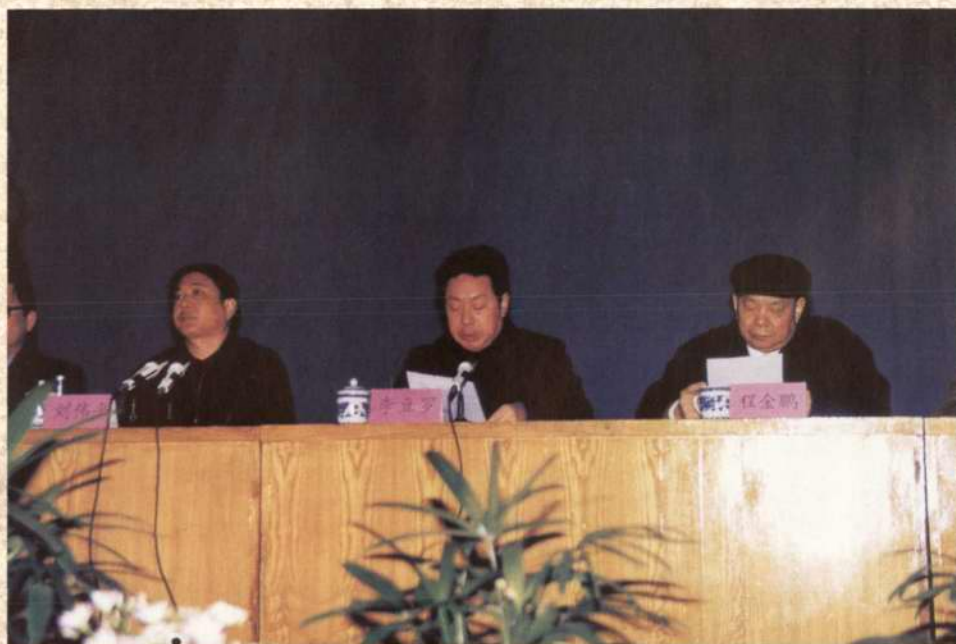
1998年8月，市委、市政府召开“关于进一步加快发展个体私营经济”动员大会，市长刘伟平（左一）、市委副书记李豆罗（左二）、市政协主席程金鹏（右一）出席