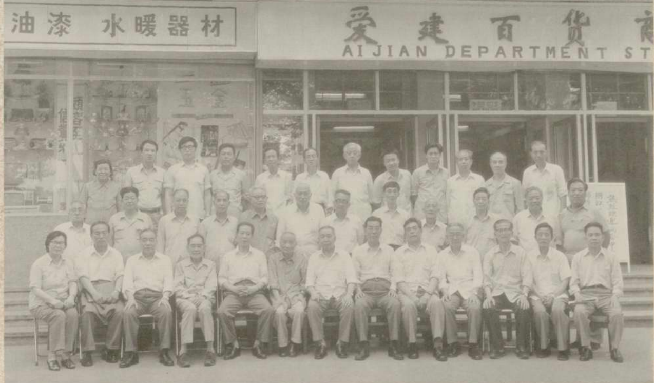
1986年5月，两会中央、浙江、甘肃、吉林省工商联领导同志莅临市工商联办企业爱建百货商场参观指导留影