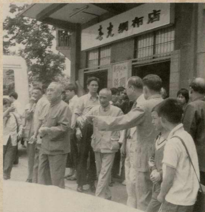
1980年，市工商聯與瓦子角街辦合作開辦春光綢布店