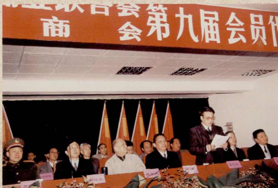
1999年12月15日，市工商联召开第九届会员代表大会，市长刘伟平(左二)、市政协主席程金鹏(左三)、省工商联党组书记严平出席(右四)、市商会会长雷元江(右三)作工作报告