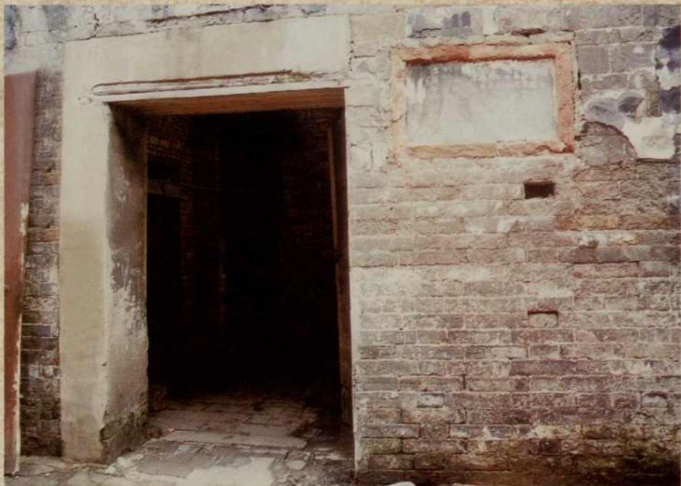
南昌市总商会旧址（座落合同巷38号，建于1922年）