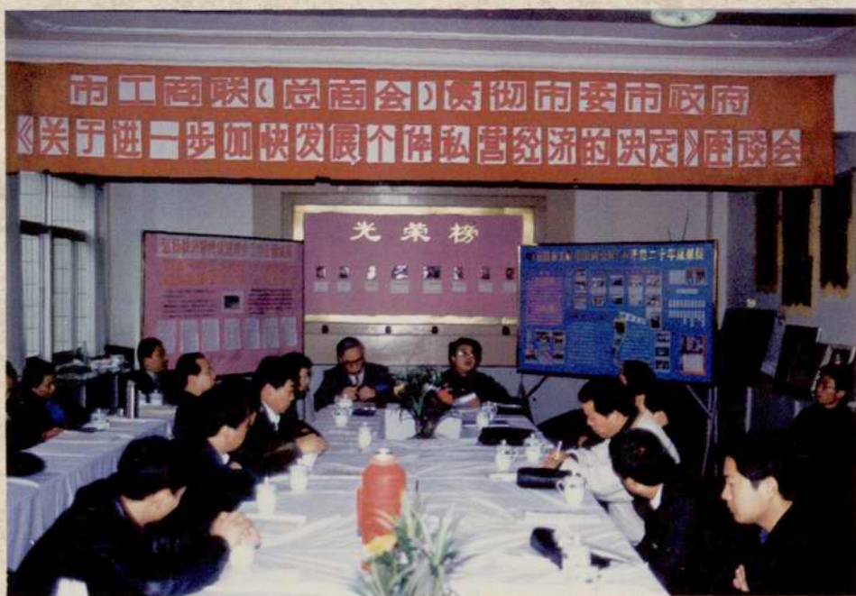
1998年8月，市工商联召开贯彻落实市委、市政府《关于进一步加快发展个体私营经济的决定》座谈会