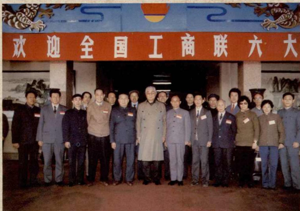
1988年11月，国家副主席荣毅仁在京接见出席全联六大的江西代表