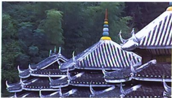
● 飞 檐