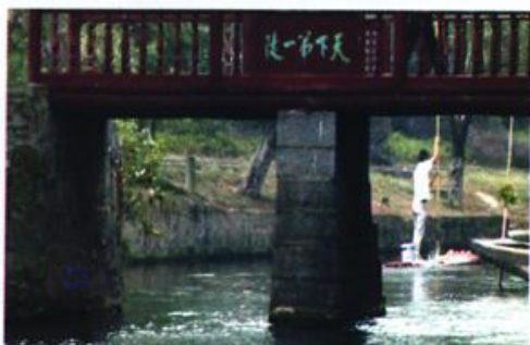
● 陡 门

为了抵御洪水的冲击，大小天平坝体断面设计为梯形，坝顶面上用巨石平铺，每两块巨石间的接缝处有两个鱼尾槽，用一块