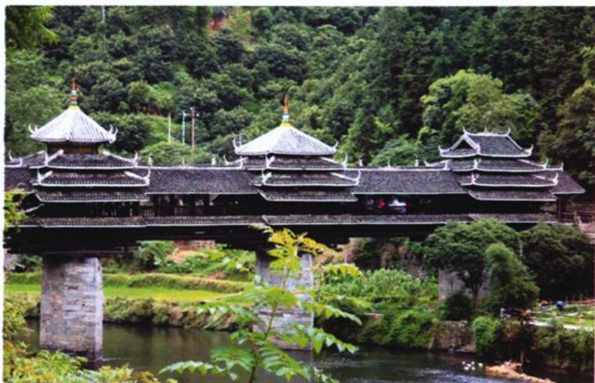
● 桥 身

1997年香港回归时，广西壮族自治区人民政府赠给香港特别行政区一份珍贵的礼物，这就是由风雨桥制作世家的第三代传人杨似玉，依据当年他爷爷建造的程阳永济风雨桥，精心制作的程阳风雨桥模型。