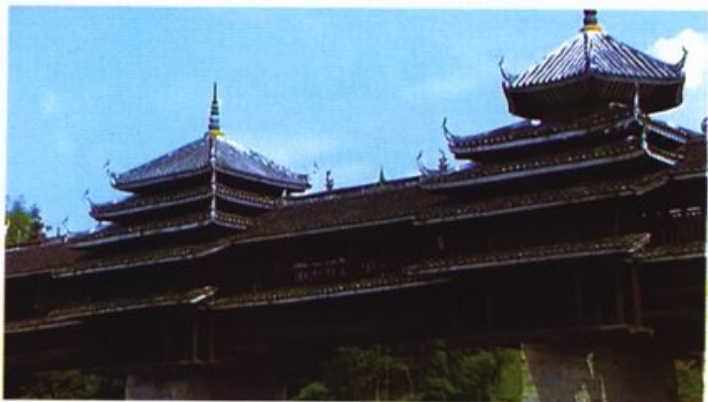
● 桥 亭

程阳桥上有5个塔式桥亭，中央桥亭最高，为4层六角宝塔式楼阁，为挺颐式；中央桥亭两边各有一座略低一点的4层四角宝塔式楼阁，称东西台亭，为多重檐攒尖顶；靠桥头两端各有一座4层殿式楼阁，称东西墩亭，为多重檐歇山顶，集侗族鼓楼的三种基本造型于一身。既有古代百越族干栏式的建筑色彩，又有汉族宫殿式的工艺成分，无疑是侗汉先民文化交流的结晶。