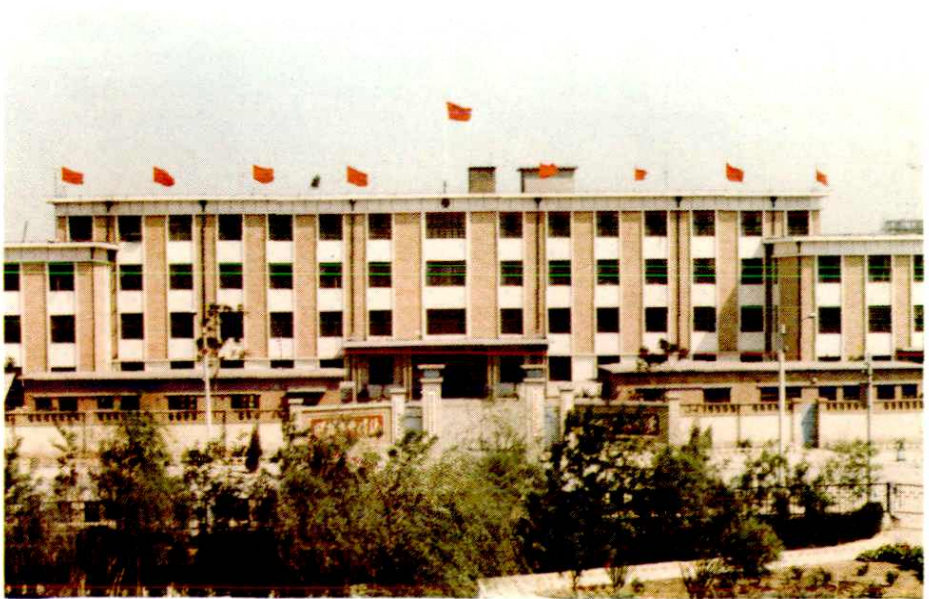
中共静海县委员会