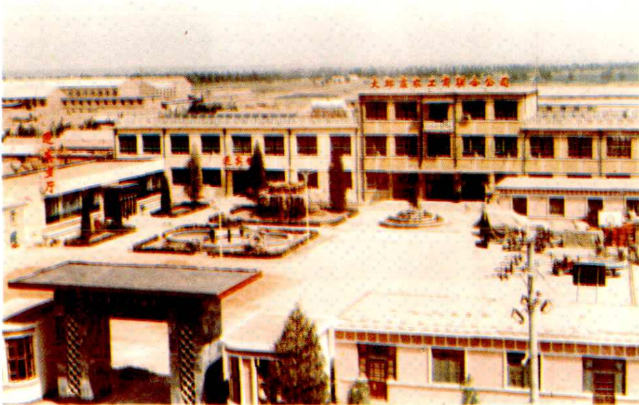
大邱庄农工商联合公司