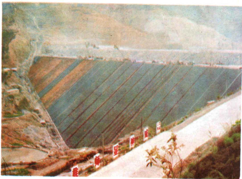
天生桥一级电站混凝土面板堆石坝，高178m。