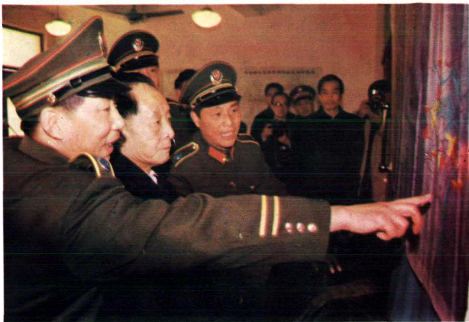
△ 1986年2月8~10日，中共中央总书记胡耀邦（左二）在天生桥水电站工地视察，左一为武警水电一总队政委张大清，左三为武警水电一总队总队长孙仁义。