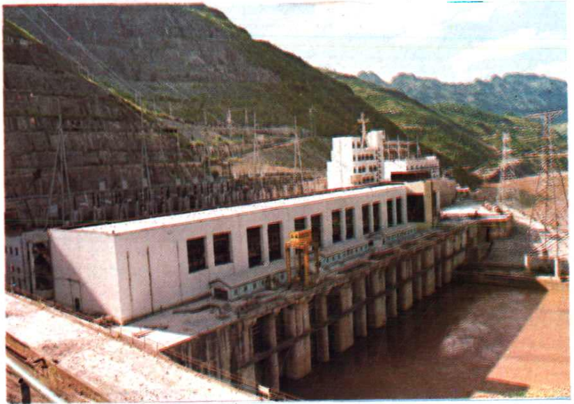
天生桥二级电站发电厂房。