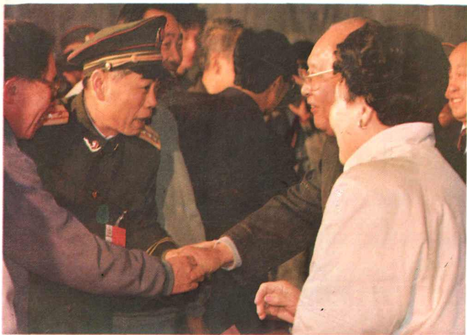
1992年12月22日，全国政协副主席王光英（右二）偕夫人视察天生桥二级电站，并参加首机发电剪彩仪式。