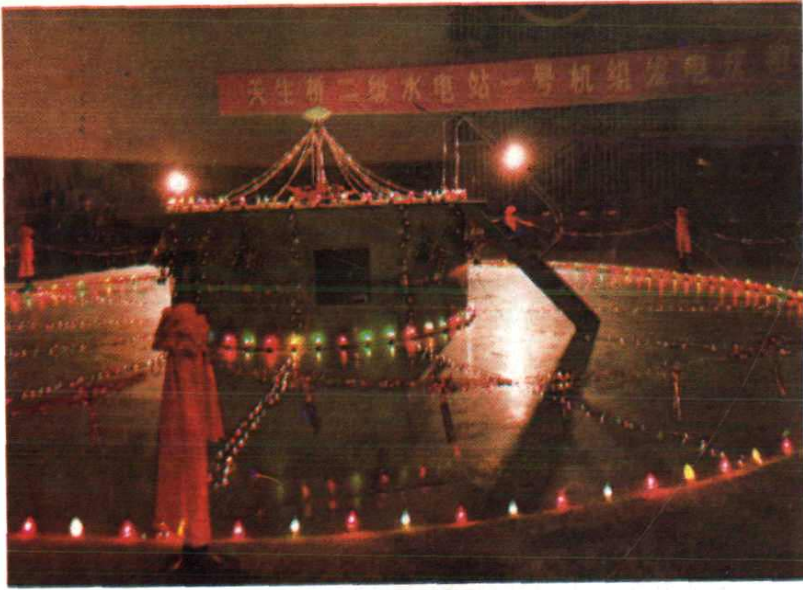
1992年12月22日，天生桥二级电站首 机并网发电。