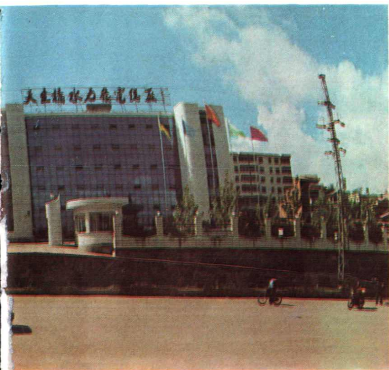
天生桥水力发电总厂本部