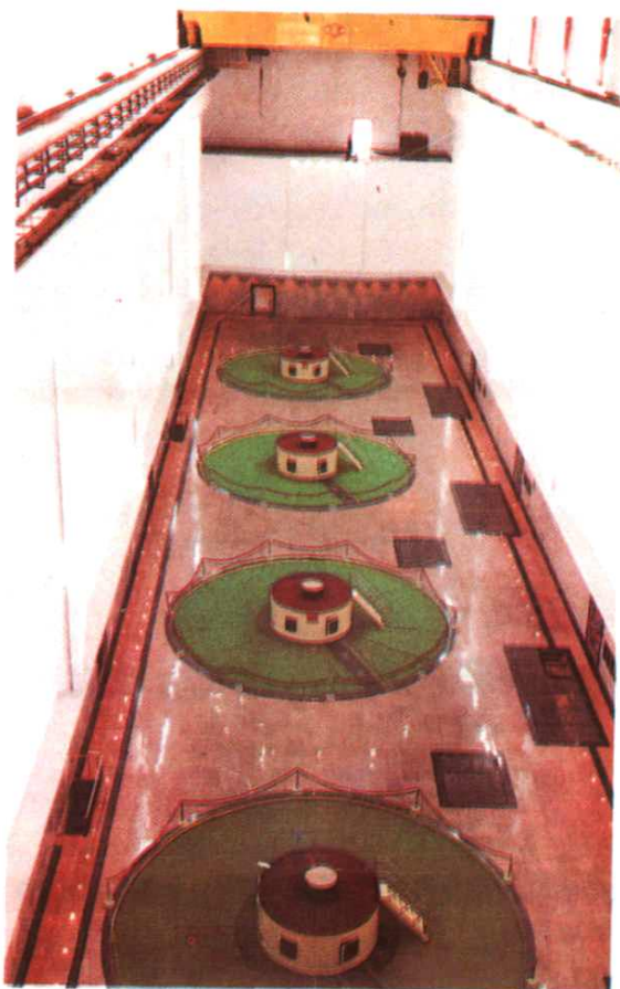
天生桥二级电站厂房发电机层