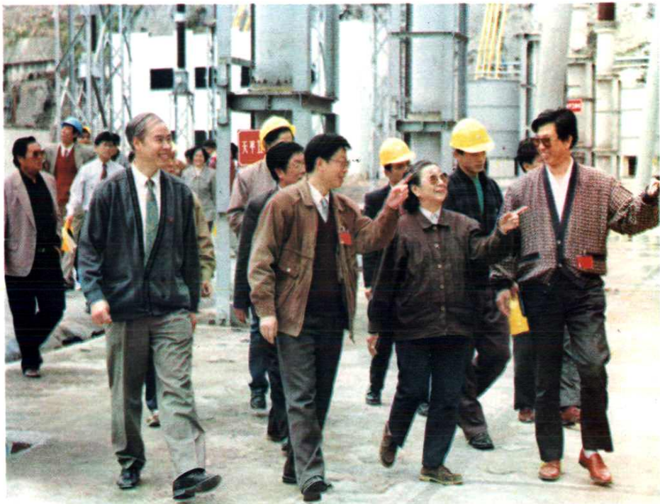
▽ 1996年4月22日，全国政协副主席钱正英（前右二）在天电总厂厂长吴世昌（前左一）、副厂长方雄（前左二）、总工程师李湘浦（前右一）陪同下，视察天生桥二级电站。