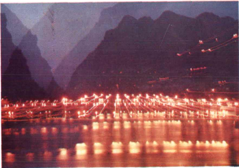
天生桥二级电站首部枢纽夜景