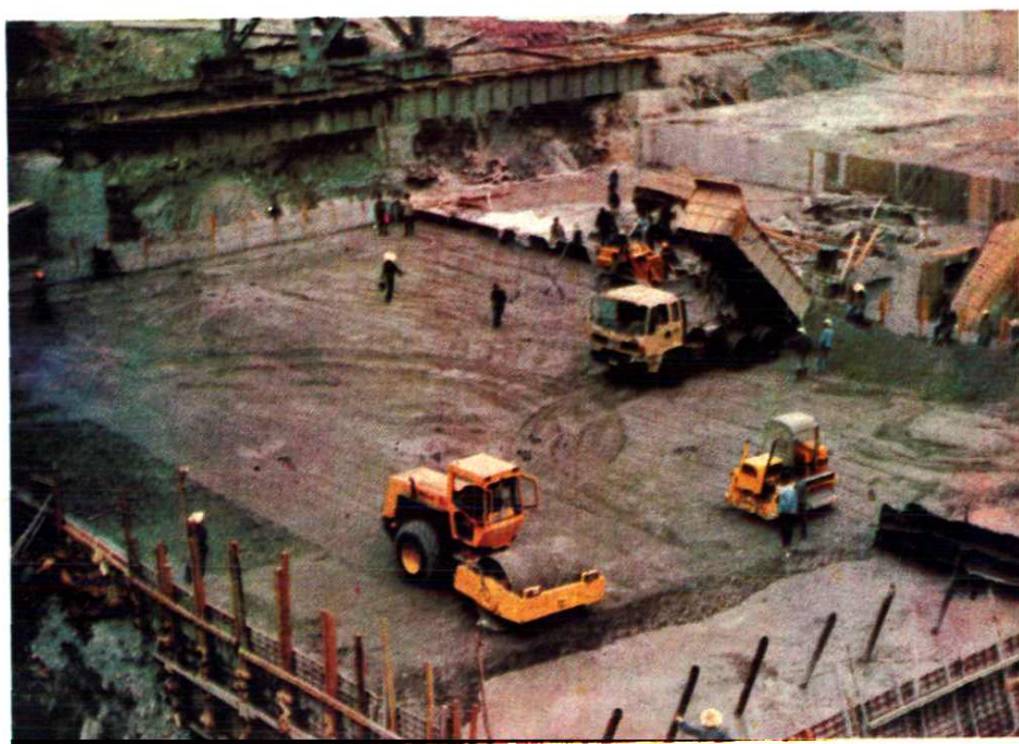
天生桥二级水电站大坝碾压混凝土施工现场