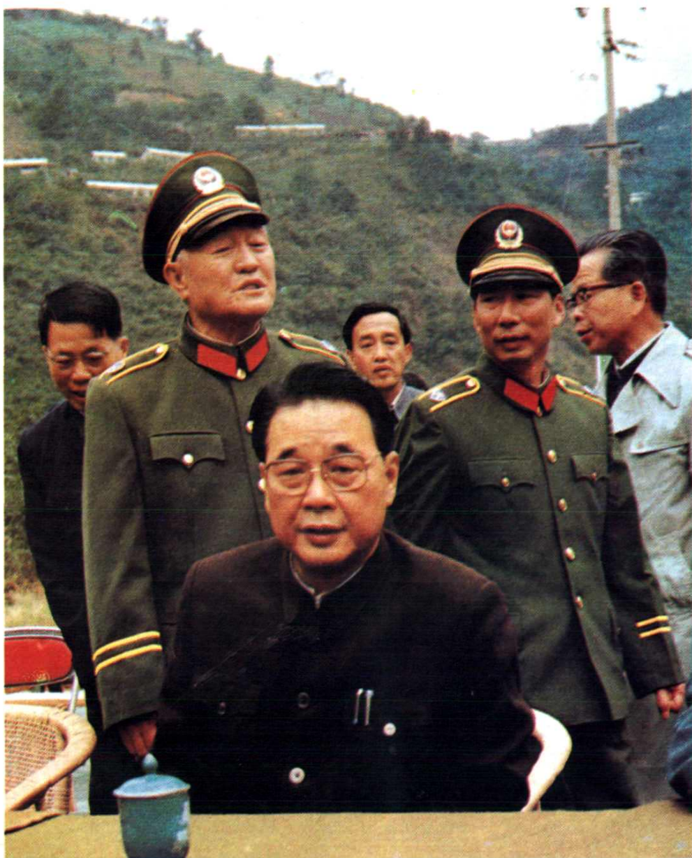
1986年11月19日，国务院副总理李鹏在天生桥二级水电站建设工地视察，并观看二级电站首部枢纽截流。中排左为武警水电指挥部主任贺毅，右为武警水电一总队总队长张大清。