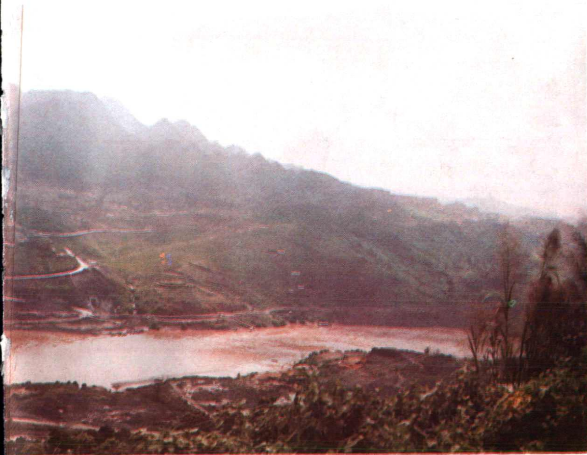
在建的天生桥一级水电站