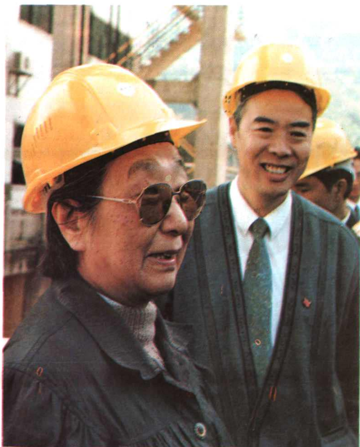
1996年4月22日，全国政协副主席钱正英（左）在天电总厂厂长吴世昌（右）陪同下视察天生桥二级电厂首部。