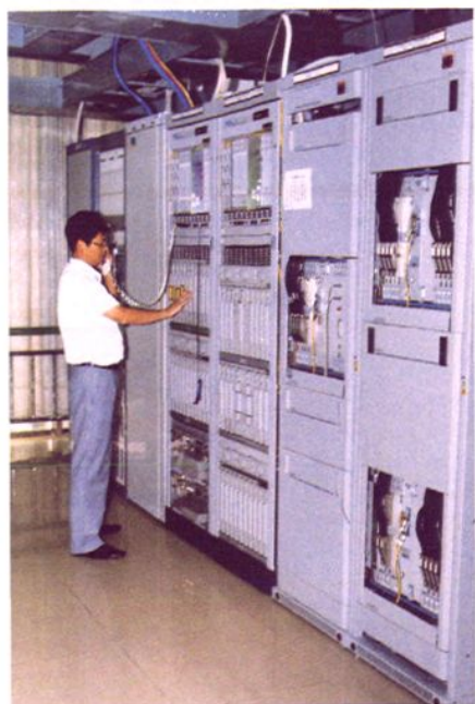
公司传输维护中心机房。