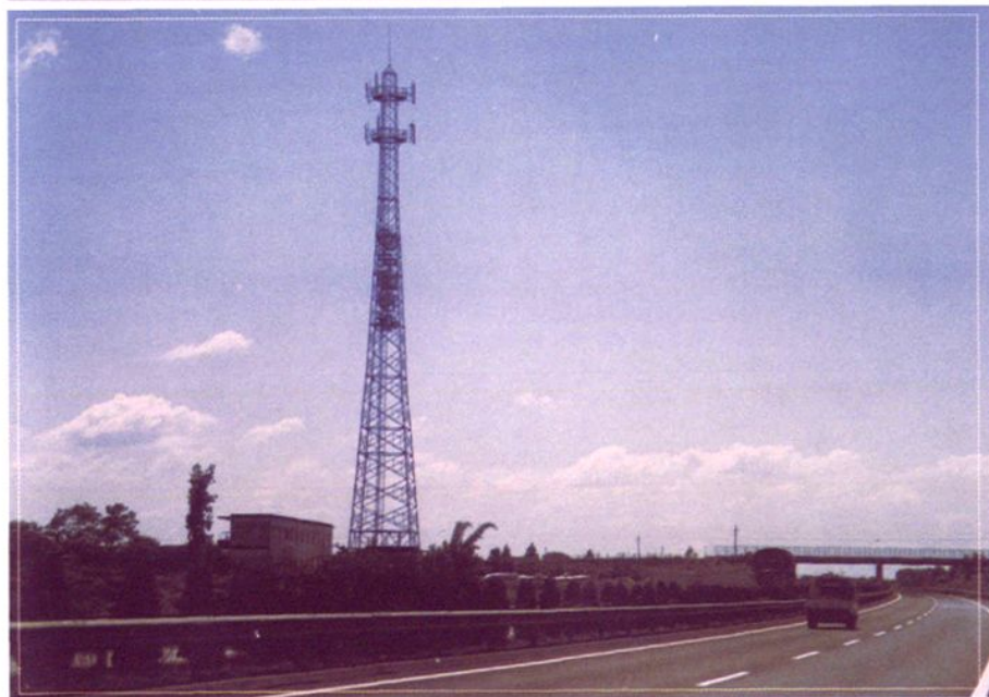
建在沪昆高速公路旁边的基站。