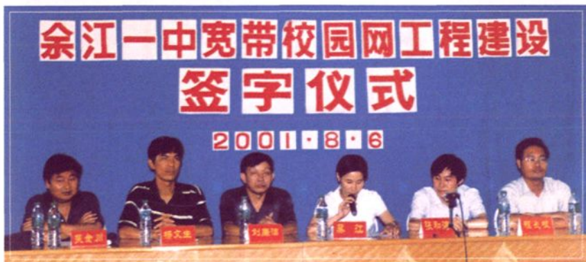
2001年8月6日，全省第一个校园宽带网建成并投入使用。图为：公司与余江一中签字仪式。