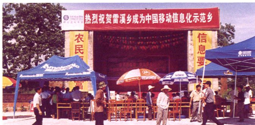
2004年3月4日，全市第一个移动信息化示范乡(镇)在贵溪市文坊镇举行揭牌仪式，鹰潭市委常委、宣传部长杜德春、副市长刘克锐亲临现场揭牌。图为：贵溪市雷溪乡成为中国移动信息化示范乡揭牌现场。