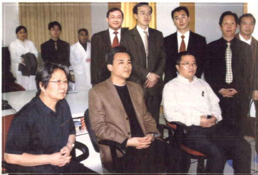
2005年4月7日，省政协副主席黄懋衡莅临鹰潭分公司视察移动信息化乡(镇)、村建设情况。图为黄副主席(前排左一)，鹰潭市委书记黄建盛(中)，省公司简总等，在观看气象信息演示。