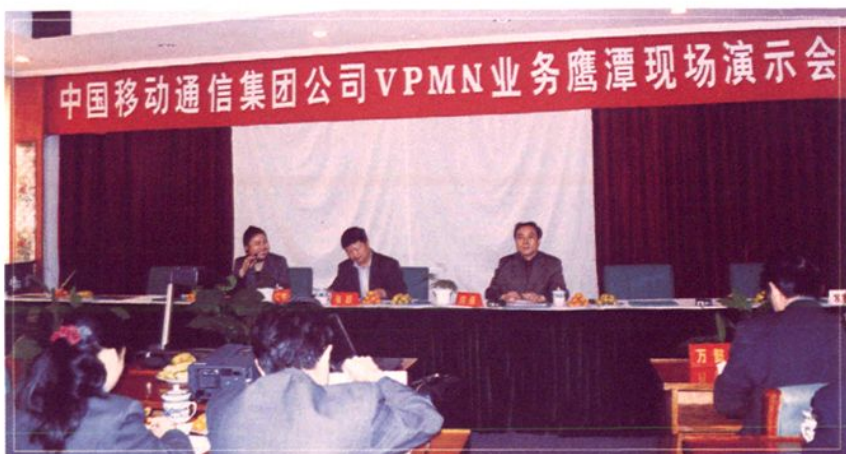
2000年11月24日，VPMN现场演示会。