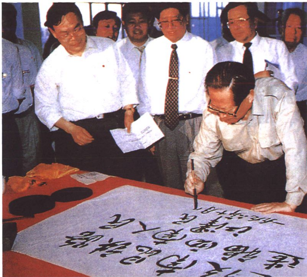
1996年10月，江泽民总书记为南昆铁路题词。