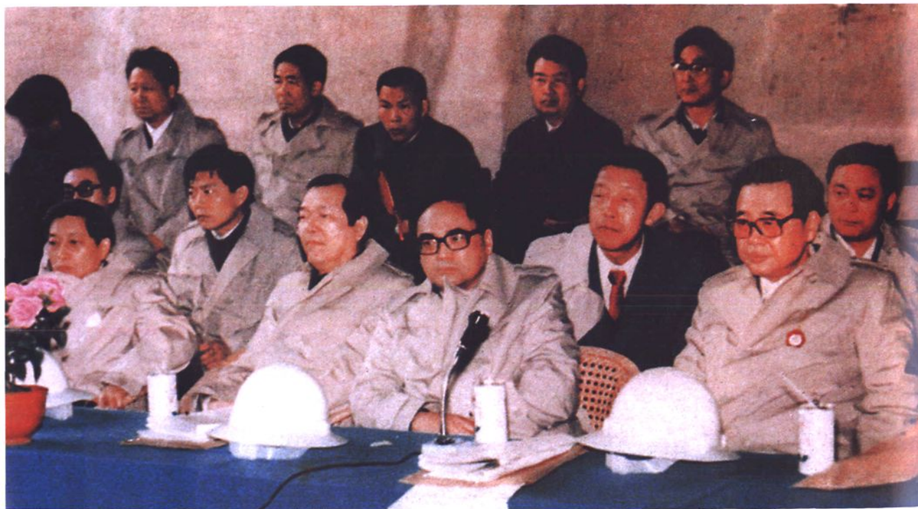
李鹏总理听取南岭隧道施工情况汇报。