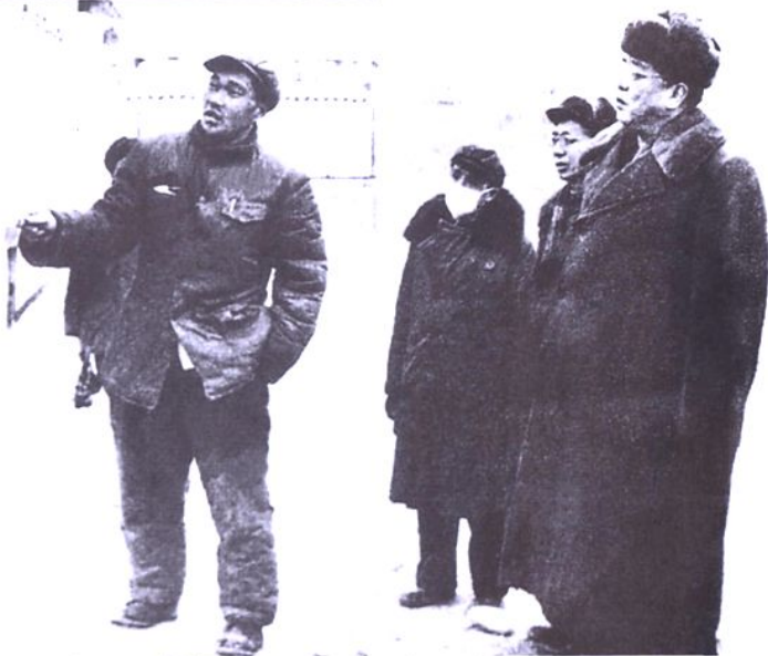
铁道部副部长武竞天在兰青铁路筑路工地检查工作。