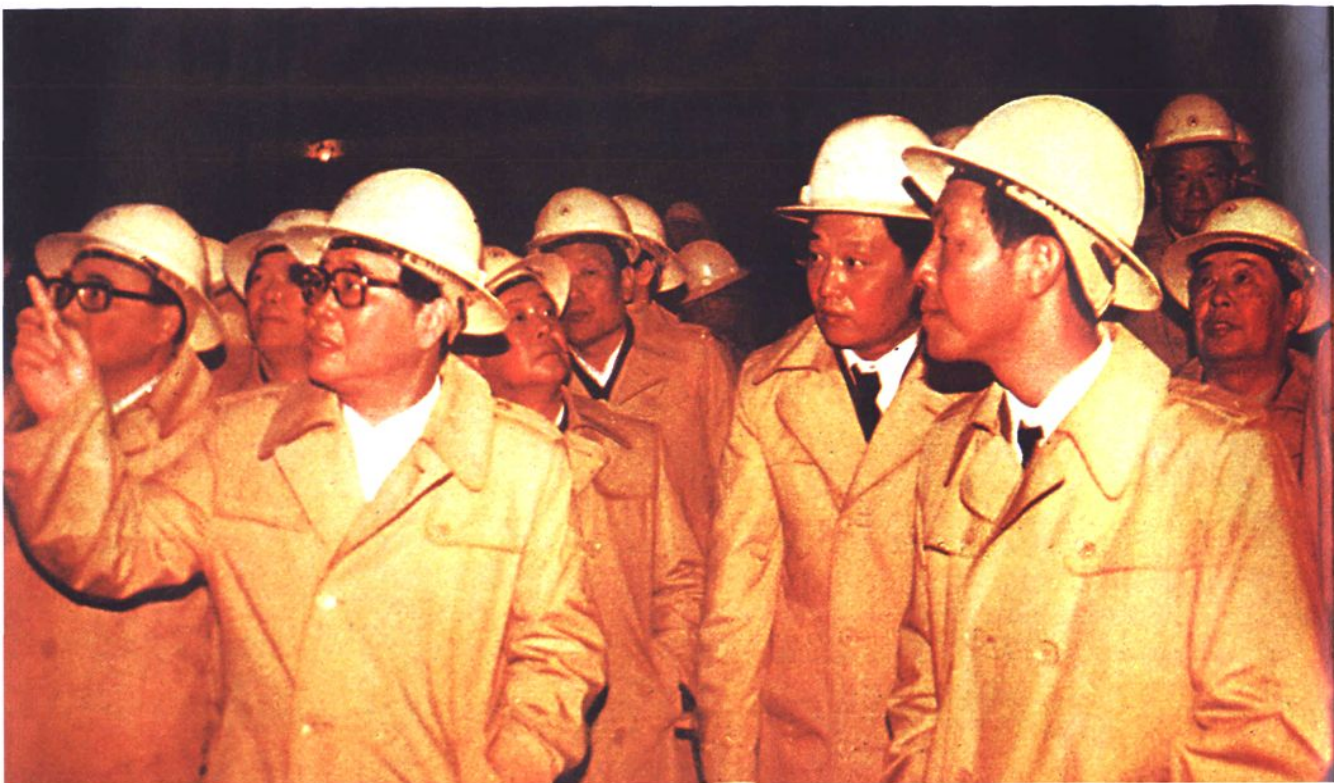
1987年3月，国务院总理李鹏在铁道部部长丁关根和水电部、冶金部、湘粤两省领导及铁五局局长杨瑾华、局党委书记董崇政陪同下视察南岭隧道。