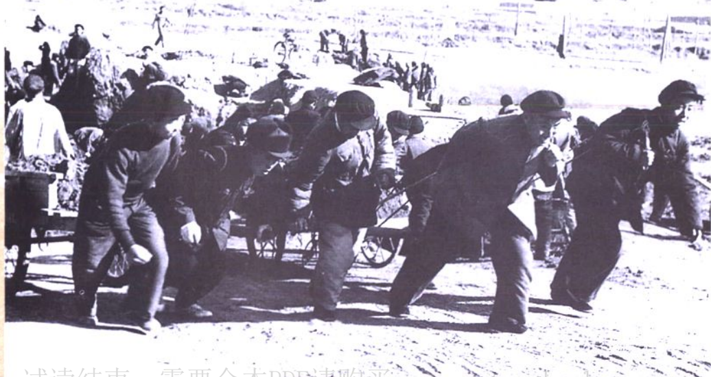
中共青海省委领导在兰青铁路西宁火车站候车大楼建筑工地集体参加劳动。