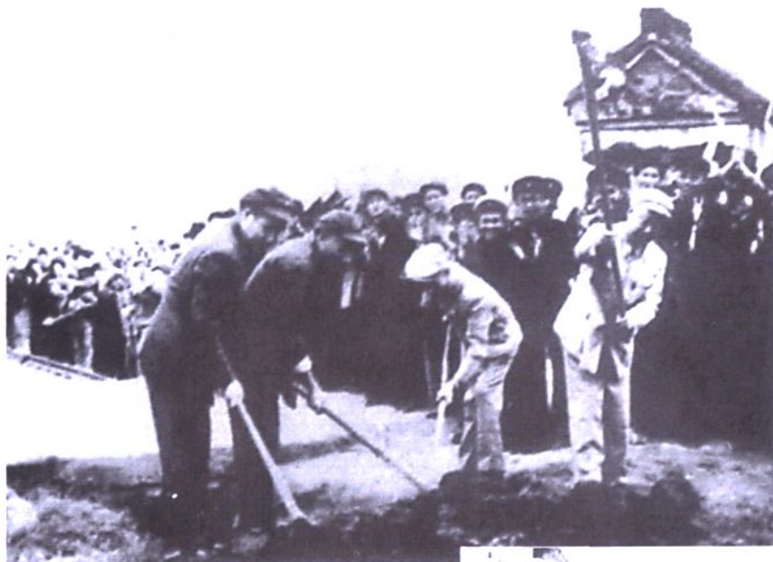
1952年7月2日，铁道部部长腾代远、西南军区副司令员李达、川西行政公署主任李井泉等在宝成铁路开工典礼上，挥锹破土，掀开会战序幕。