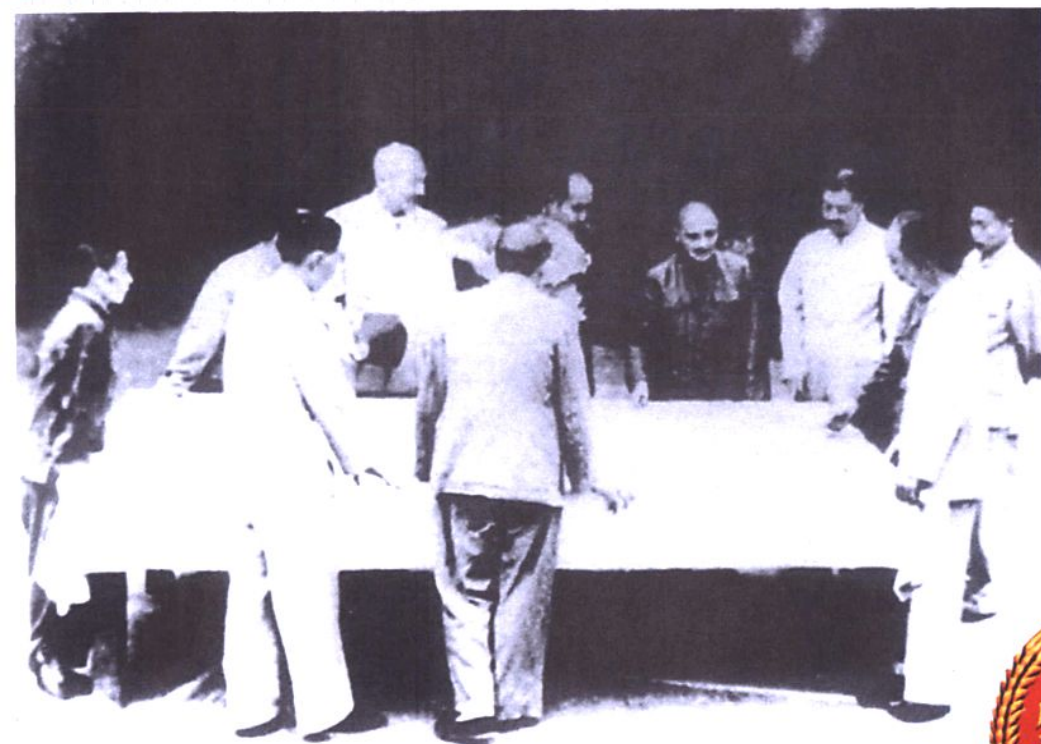
成渝铁路开工前，邓小平、贺龙等领导同志共同研究建路方案。