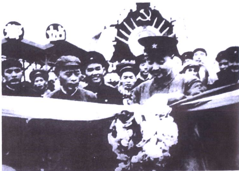
1952年7月1日，成渝铁路通车典礼分别在成都、重庆举行。图为贺龙在成都举行的有30万人参加的通车典礼上剪彩。