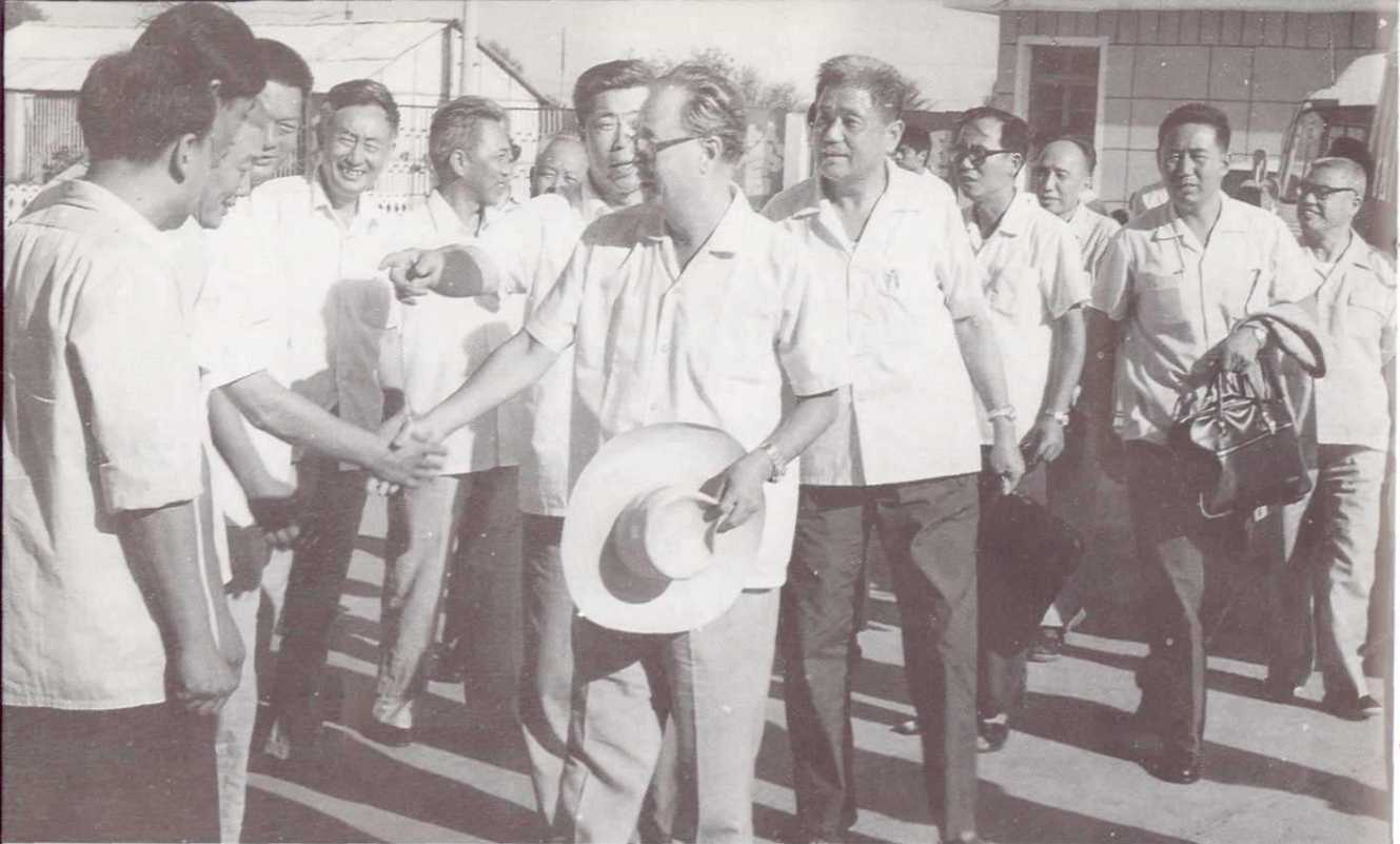
1984年9月，国务院总理赵紫阳视察安徽煤炭工业公司，关心两淮煤炭生产建设。