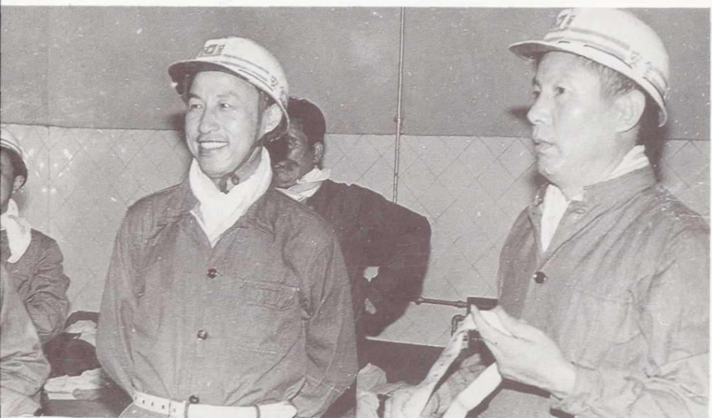
中共安徽省委副书记卢荣景在芦岭煤矿检查工作。（1986年）