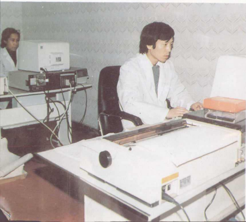
电子计算机中心站