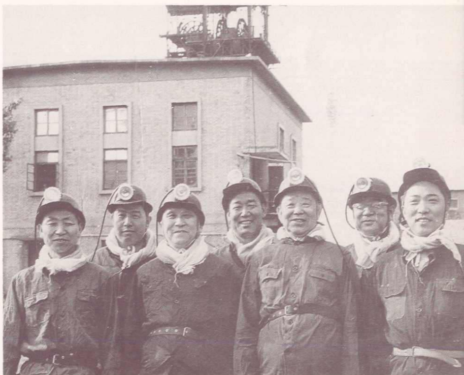
1978年4月廖汉生副委员长视察杨庄煤矿。