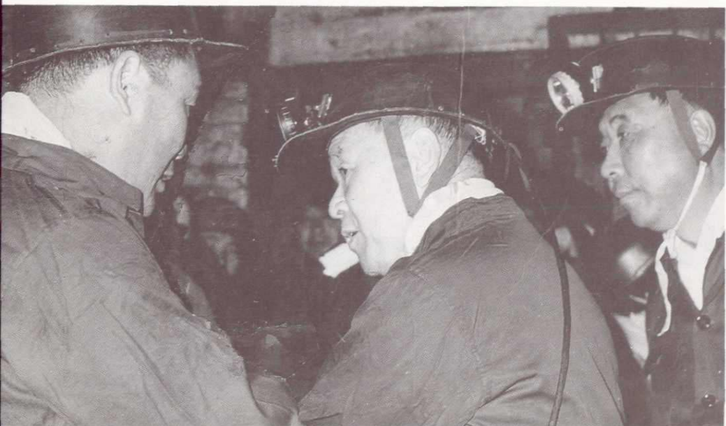
安徽省省长周子健、副省长王郁昭在杨庄煤矿检查工作。（1982年）