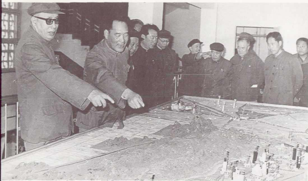
1980年3月煤炭工业部部长高扬文来局检查工作。