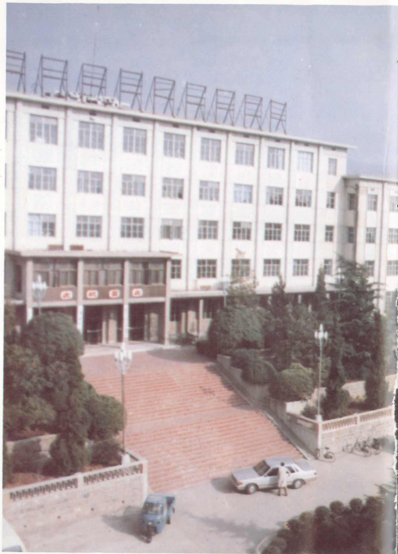
淮北煤炭生产建设的指挥与管理中心——淮北矿务局机关办公大楼