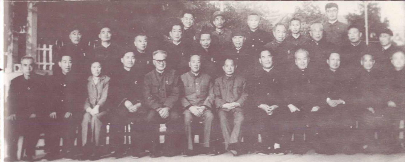
1982年10月，中共中央总书记胡耀邦和乔石、郝建秀等中央领导同志视察淮北。