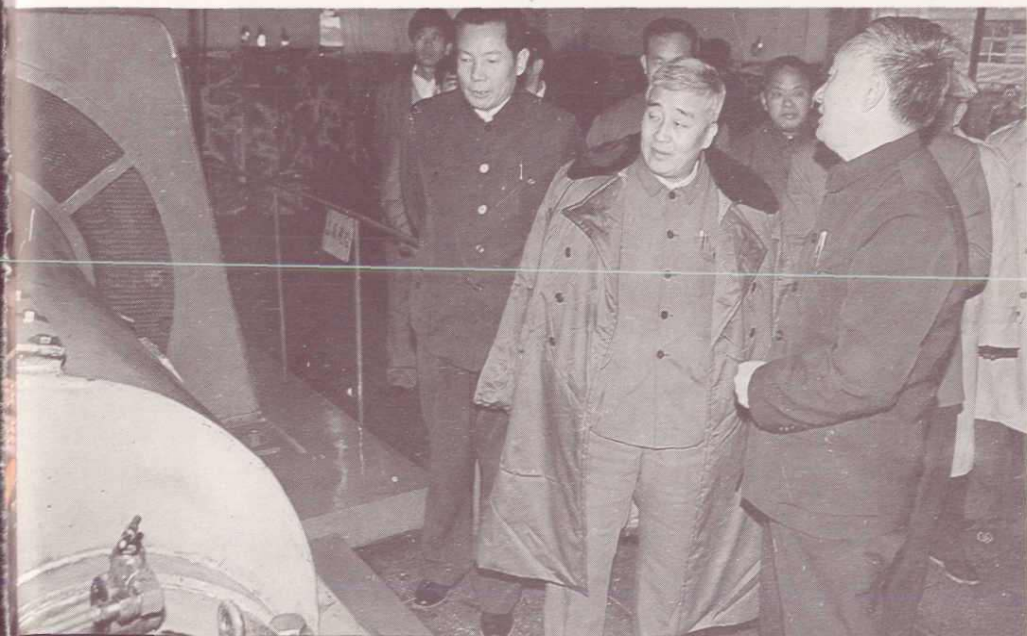
1986年10月，中共安徽省委书记李贵鲜在岱河煤矿检查工作。