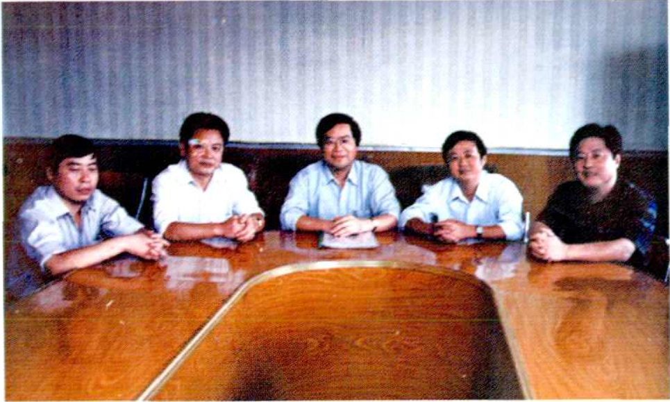
团结奋进的领导班子

心电监护仪、心功能测定仪、509 多参数监护仪、呼吸机、电动洗胃机、各种类型心电图机、丹麦产电测听仪、裂隙灯、手术显微镜、原子分光光度计、 \Sigma 960 酶标仪、美国产全自动生化分析仪、血球计数仪、尿十项分析仪、电凝分析仪、WFB—V 增强型体外反搏装置、光量子治疗仪、激光血管内照射治疗仪、波姆光治疗仪、美国产心脏除颤起搏监护仪、高频电刀、超声心脑血管病治疗仪、多功能微波治疗机、激光治疗机、婴儿电脑蓝光治疗仪、电子肛肠治疗机、德国膀胱腺电切镜等。