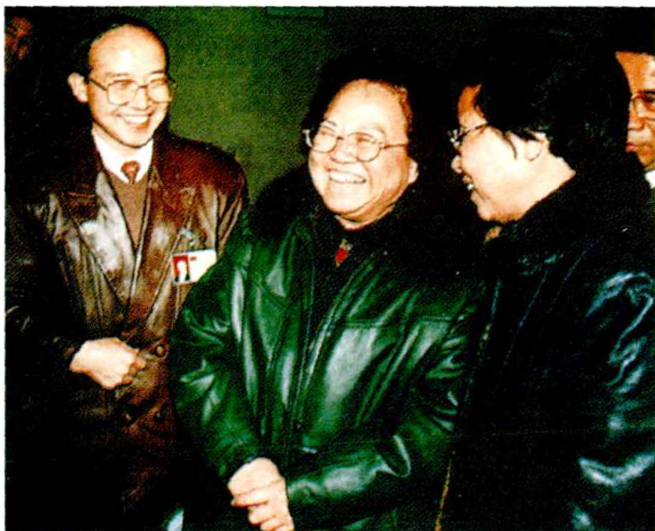
原国务委员，现全国人大副委员长彭佩云和陕西省副书记范肖梅来医院视察

安装了空调设施，投入巨资兴建了介入诊疗中心、全身肿瘤光子刀放疗中心、血液净化中心、制剂研究中心、医疗康复中心、临床特殊检验中心等六大中心，使医院的诊疗水平和就医环境上了一个更新的台阶，综合实力进一步提高，从根本上解决了广大患者的诊疗要求。