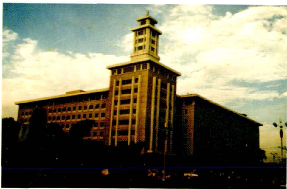
国家中医药科研基地之一，国家药品基地之一——陕西省中医药研究院

该院现设附属医院、附属肛肠医院、中药研究所、中医文献医史研究所、中医基础研究所和中医药信息研究所（包括藏书 15 万余册的图书情报馆）、科研实验药厂、西安国际针灸培训班