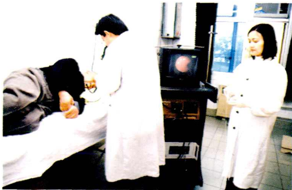
医生正在作胃镜检查

办院宗旨： 医德为本、科技兴院。 承诺： 患者至上、优质服务、质量一流、收费合理。