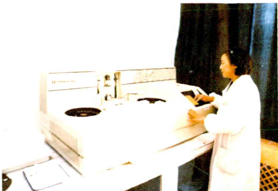
生化室检查人员正在作心肌酶谱测定