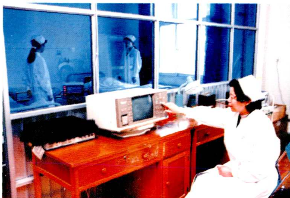
院 CCU 室