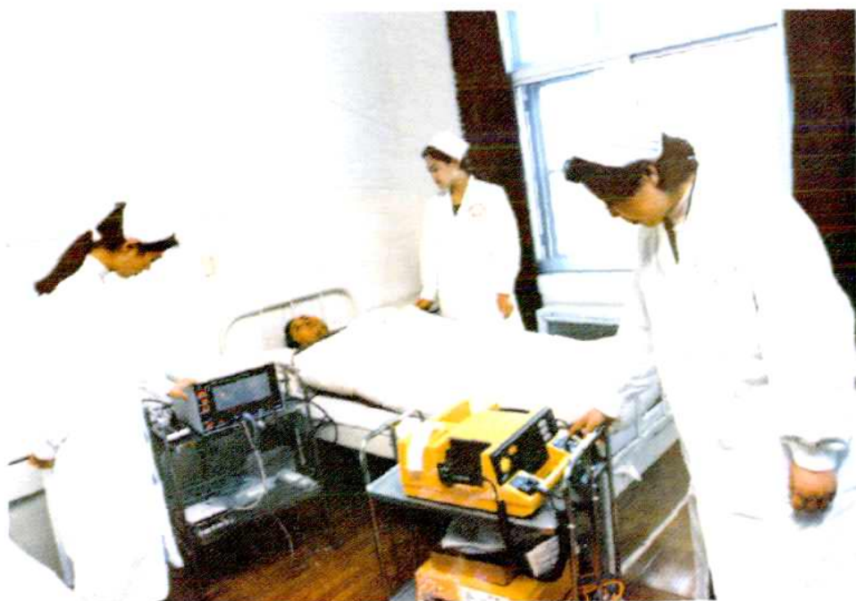
医务人员正在为重危病人作监护