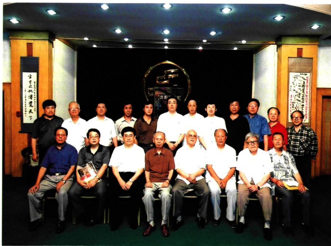
《沈阳集邮志》编审委员会成员与领导合影