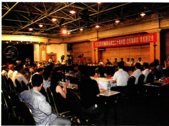
沈阳市集邮协会成立二十周年暨《沈阳集邮志》修成座谈会现场。