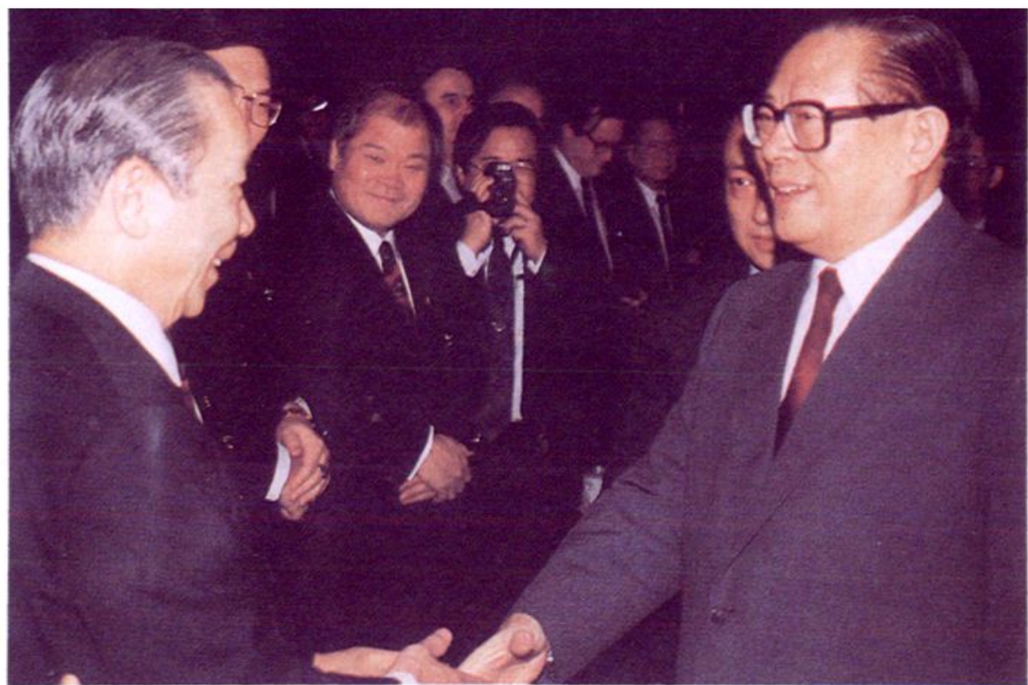
中共中央总书记江泽民接见唐裕