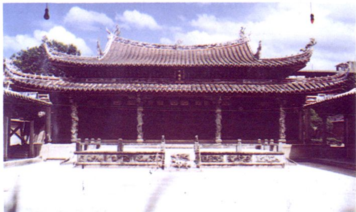
素称甲八闽的安溪文庙