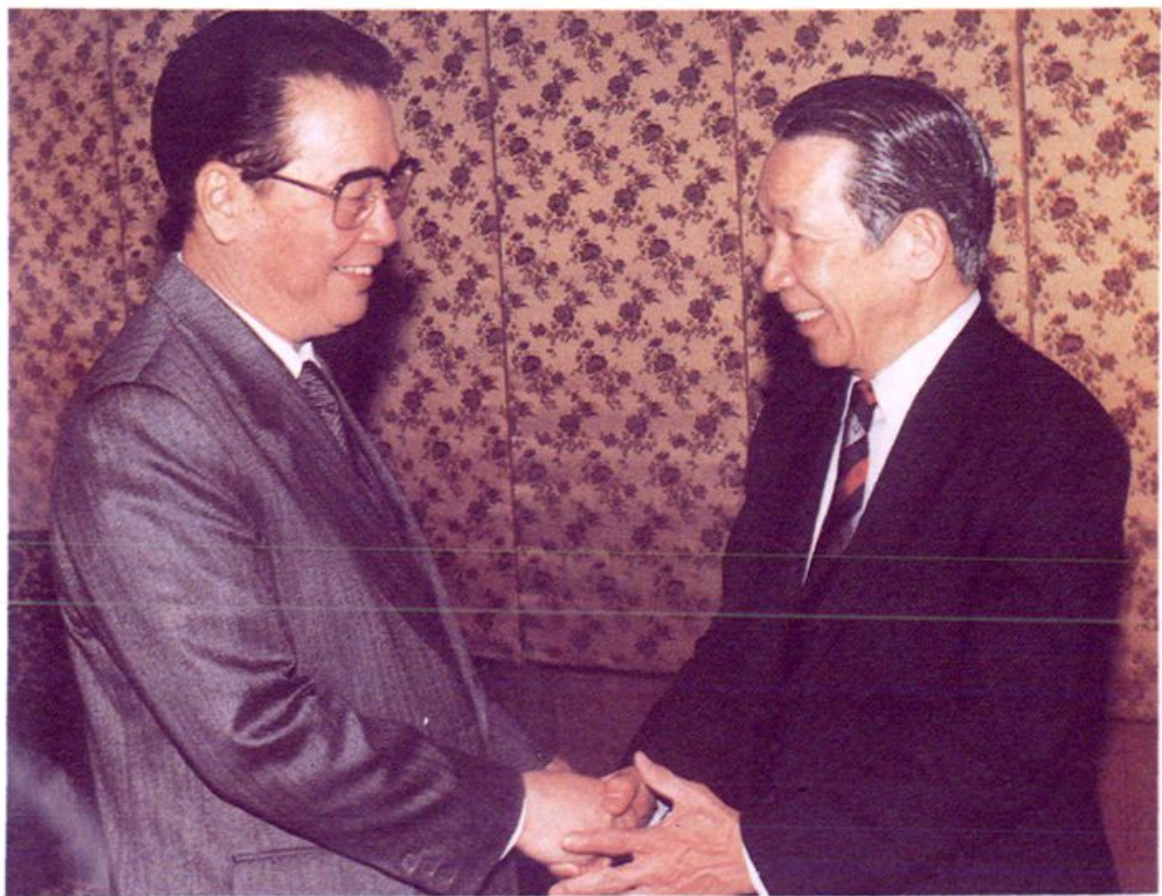
国务院总理李鹏接见唐裕