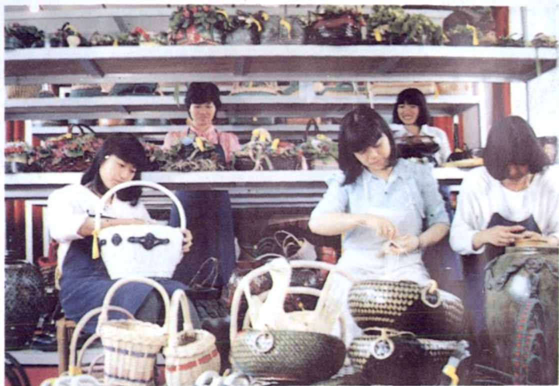
安星藤器公司车间一角