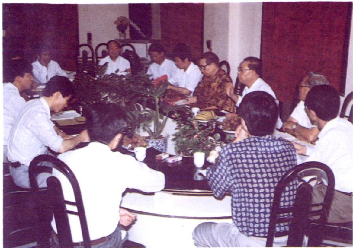
第二届世界安溪乡亲联谊会在安溪举行筹备会