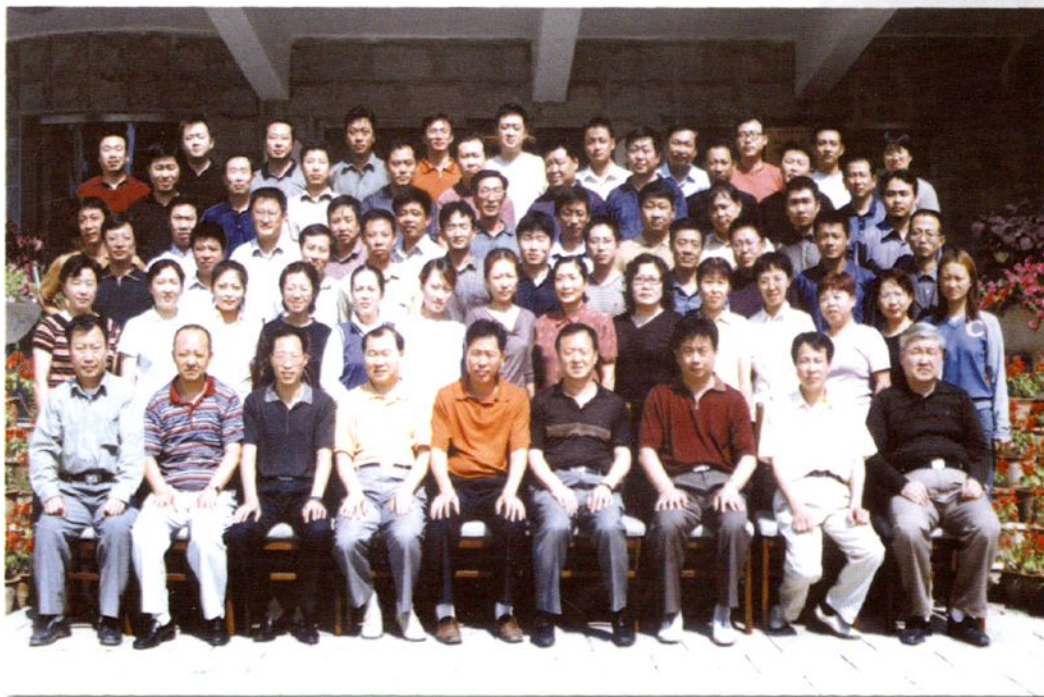
通辽市财政局全体职工合影