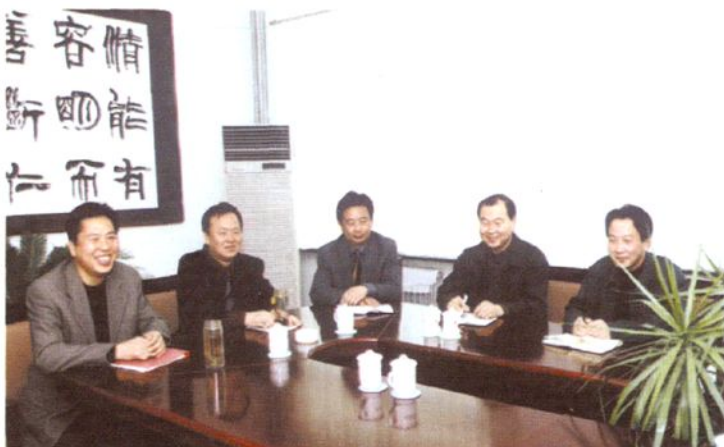
通辽市财政局党组成员