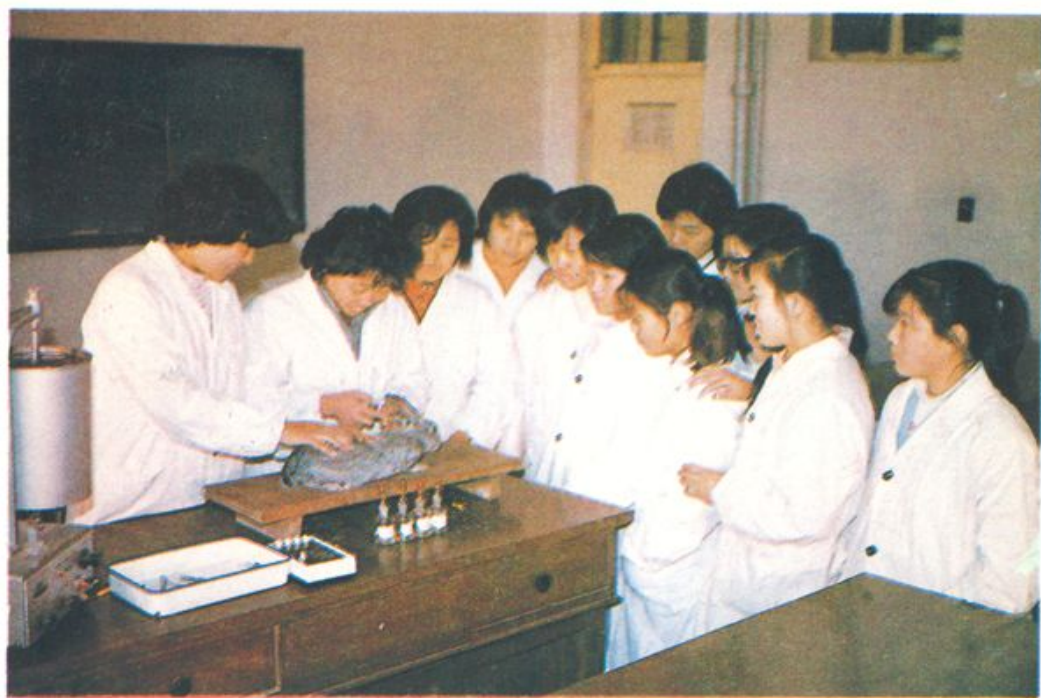
德州卫校学生在上实验课