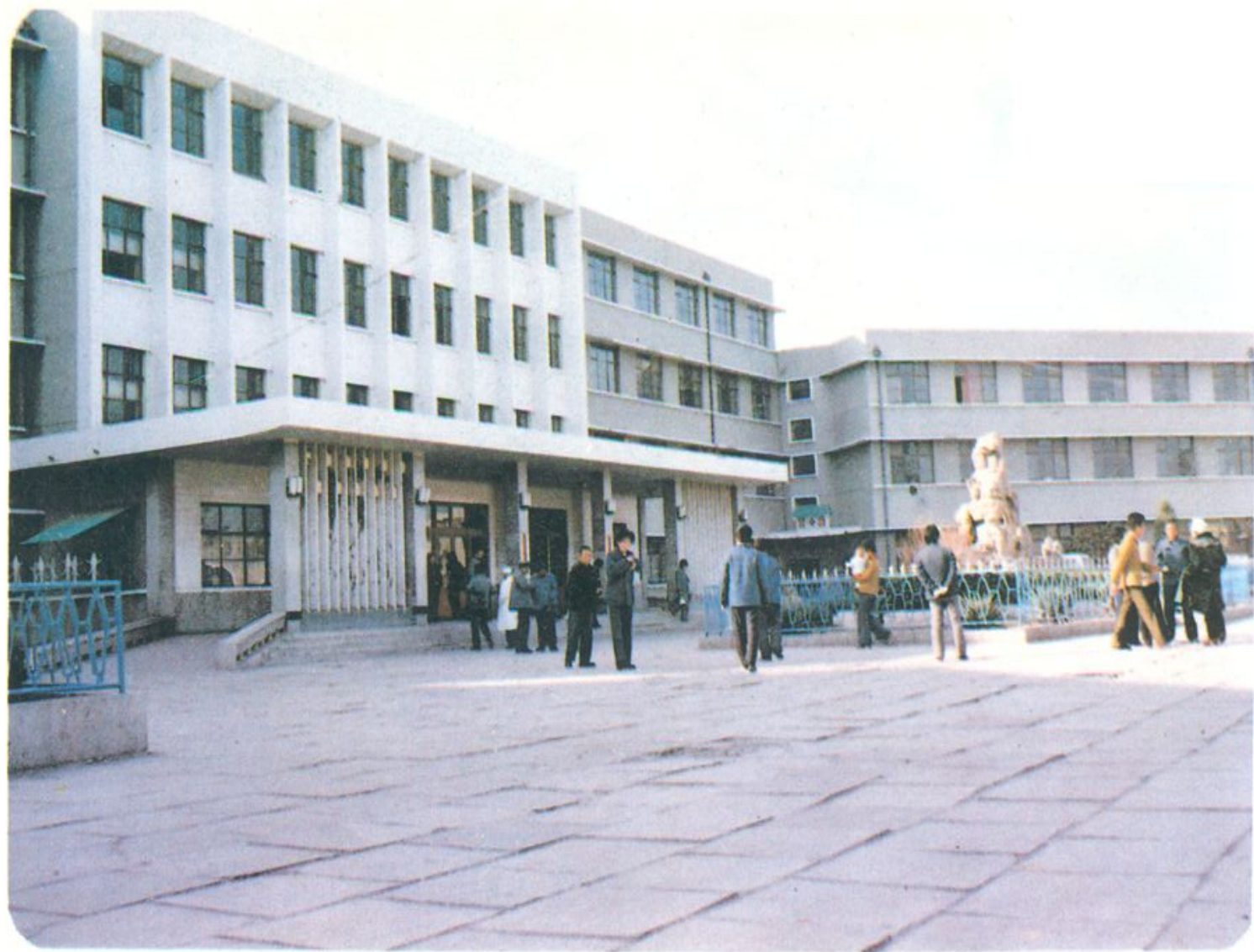
德州地区人民医院门诊楼