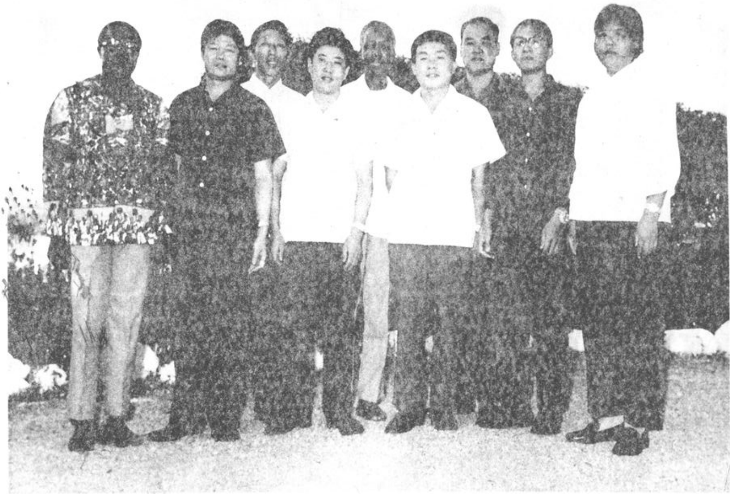
1974年坦桑尼亚总统尼雷尔（后中）由塔宝拉省省长陪同亲切接见中国医疗队员