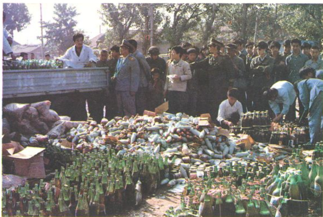
1985年临邑县食品卫生监督检验所销毁万斤有害食品