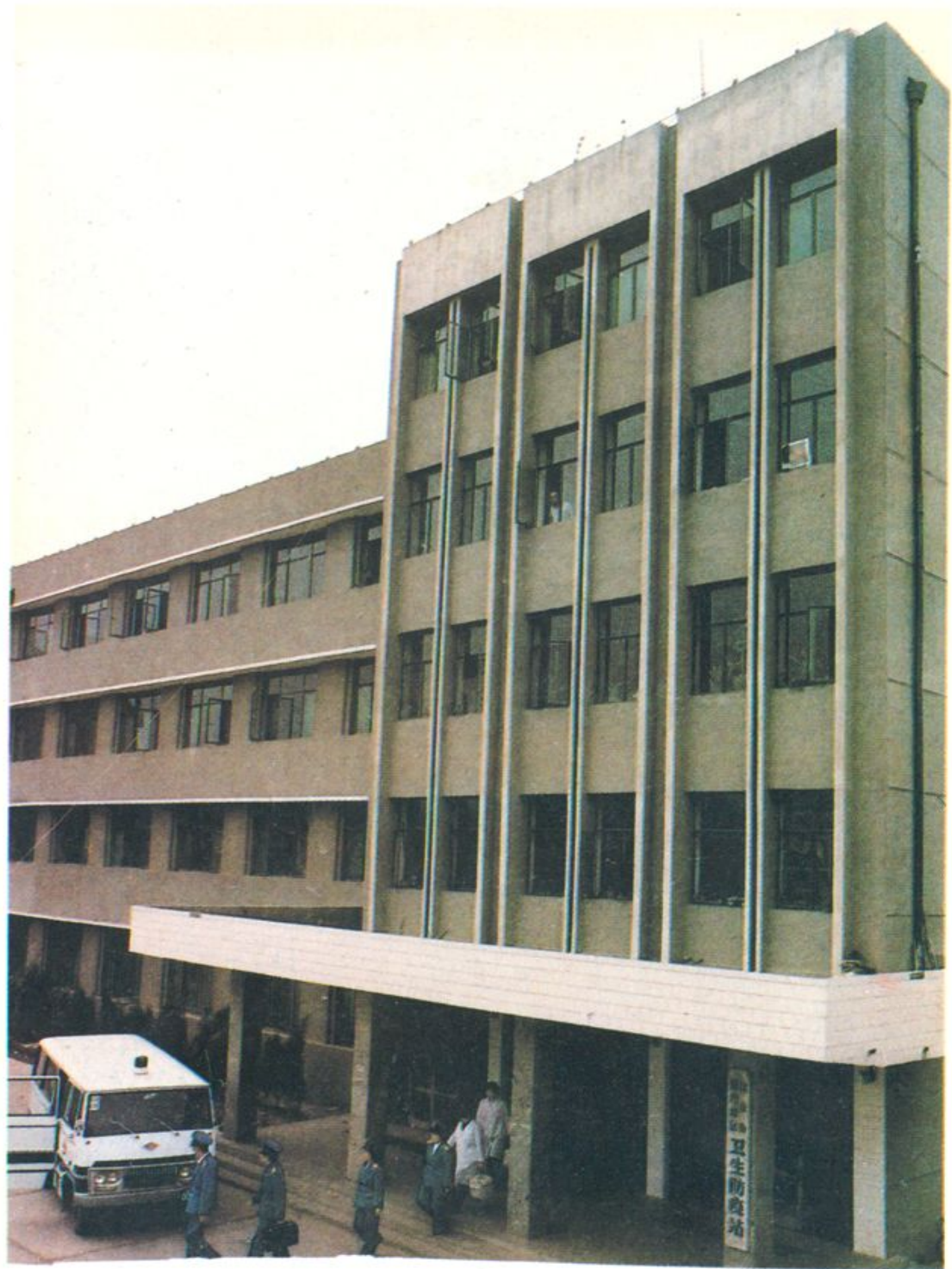
地区卫生防疫站食品卫生监督员整装待发