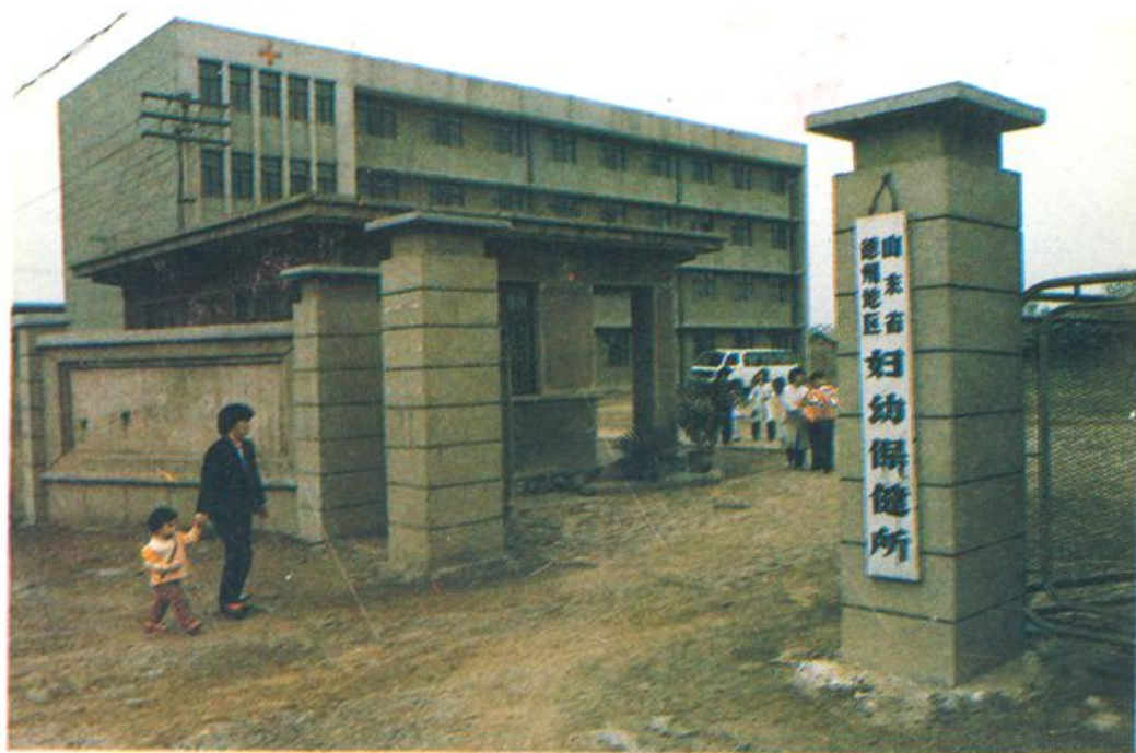
地区妇幼保健所在进行妇幼查体及优生咨询