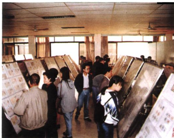
第三届邮展现场 张风 摄