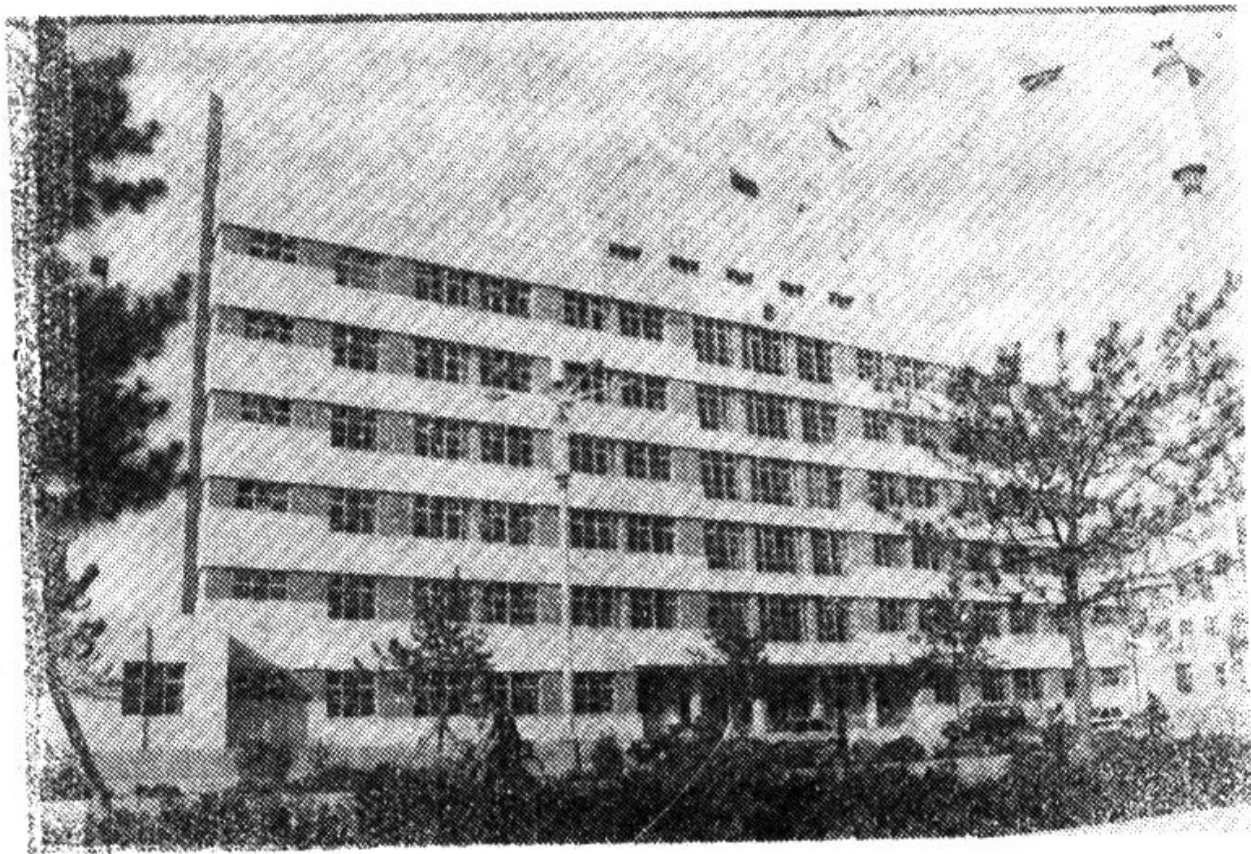
赤峰市人民检察院办公大楼