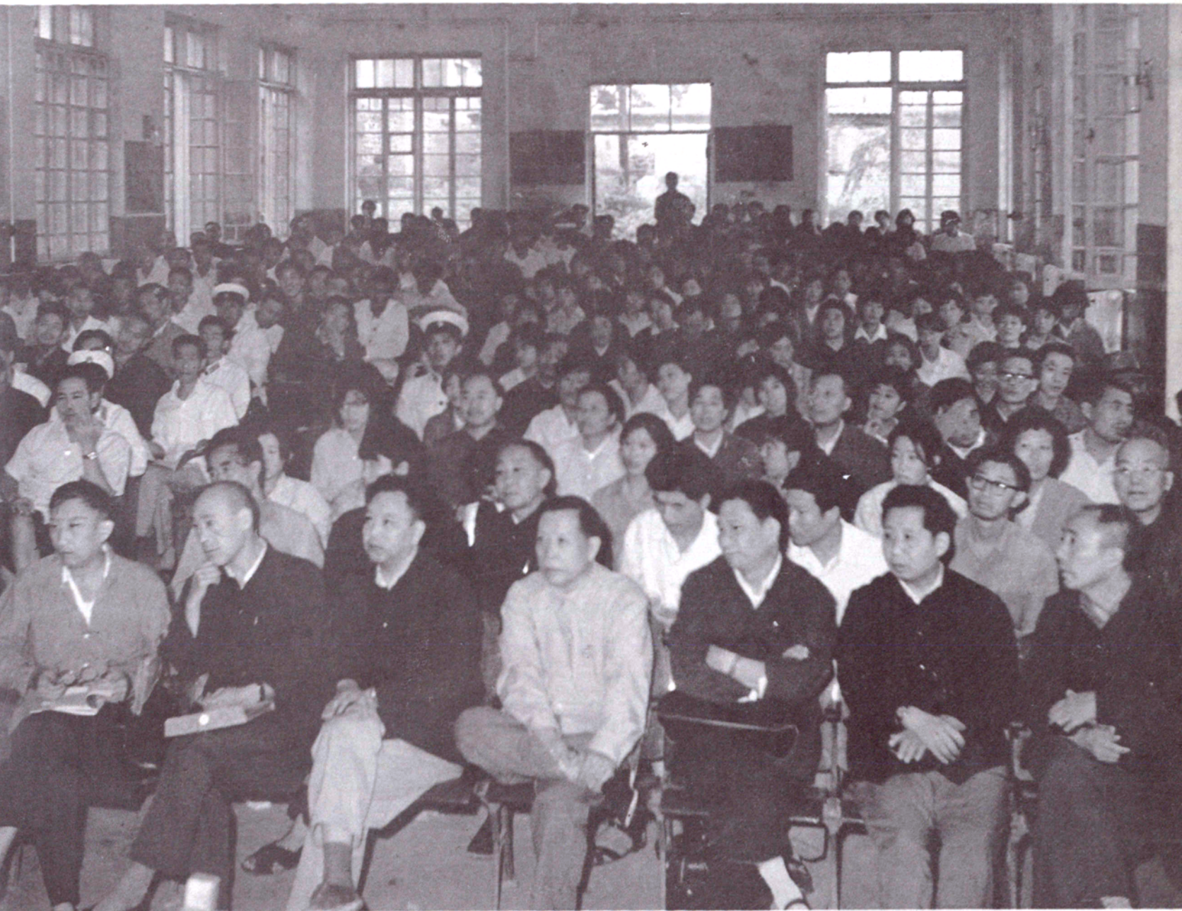
一九八一年七月至九月，我省在秦皇岛市山海关区进行省级人口普查试点，省、地、市人口普查领导小组成员、办公室主任和业务骨干参加了试点全过程。