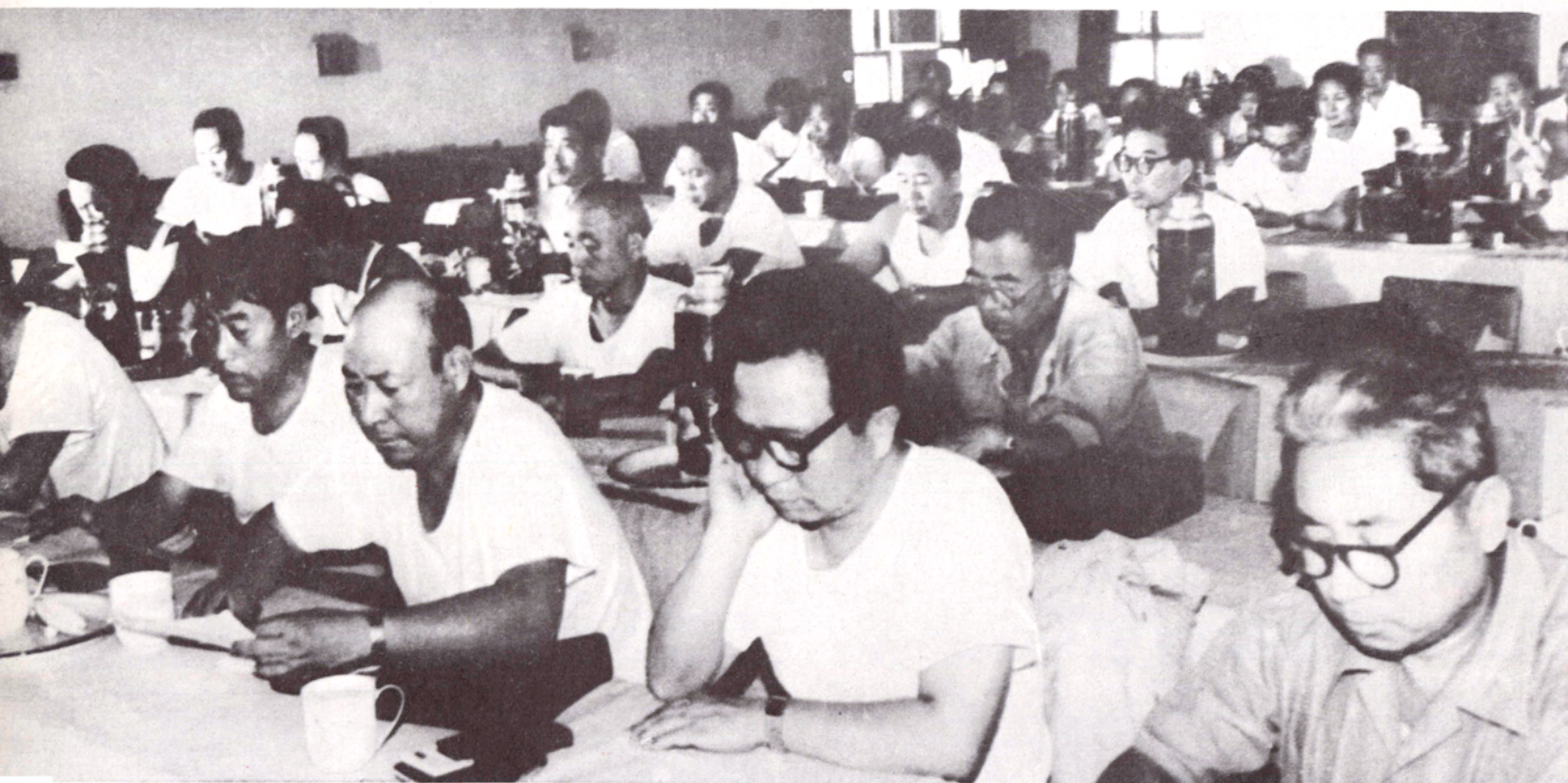
邯郸地区召开人口普查工作会议，传达贯彻国务院和省人口普查工作会议精神，研究部署本地区的普查工作。