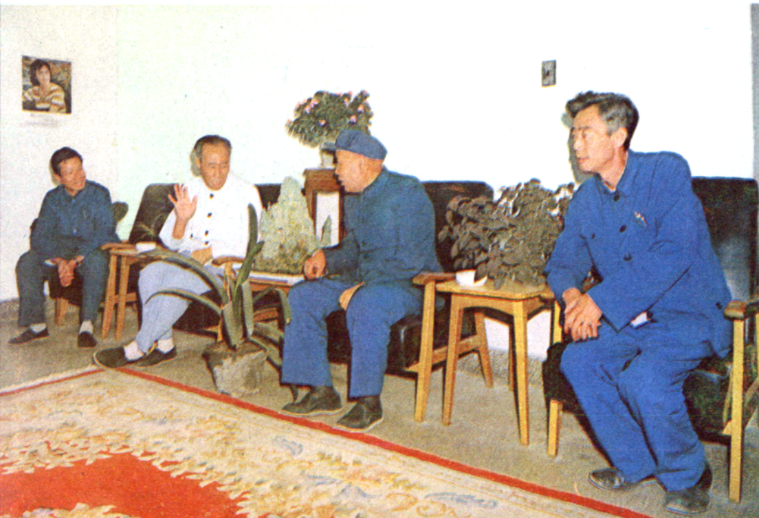
国务院人口普查办公 室负责人白建华(左二)在 我省承德地区检查工作。