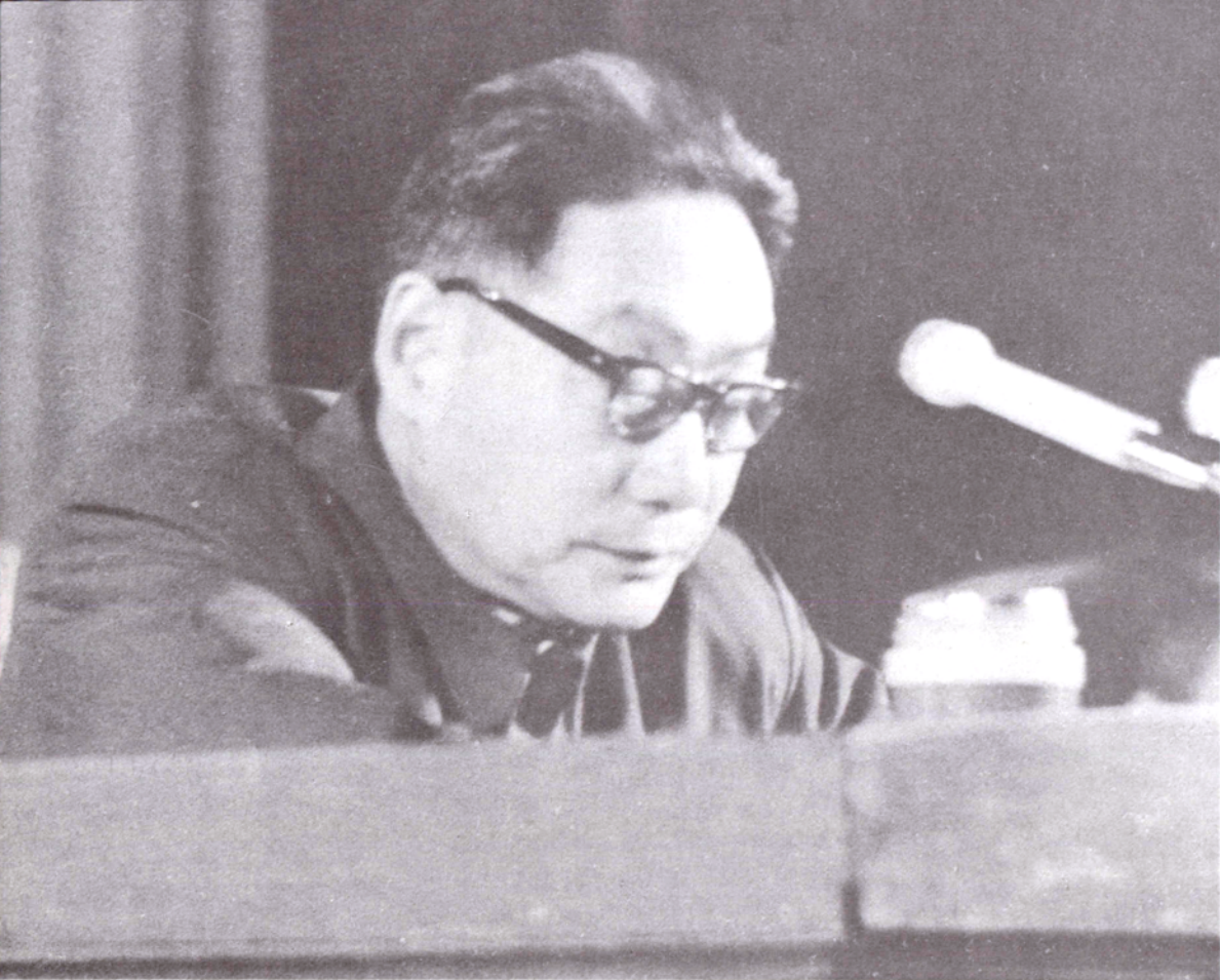
中共河北省委书记、副省长郭志在河北省第三次人口普查工作会议上作题为《全党动员，高质量地完成我省人口普查任务》的总结报告。