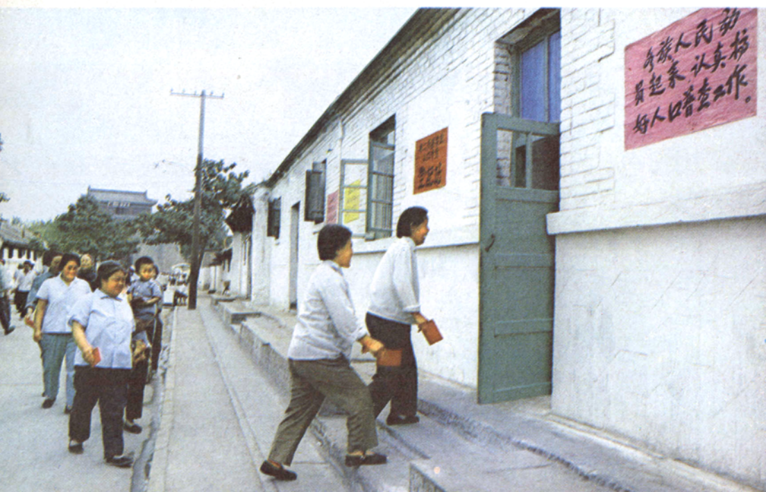
山海关东街居民积极参加人口普查试点，兴致勃勃地上站申报。