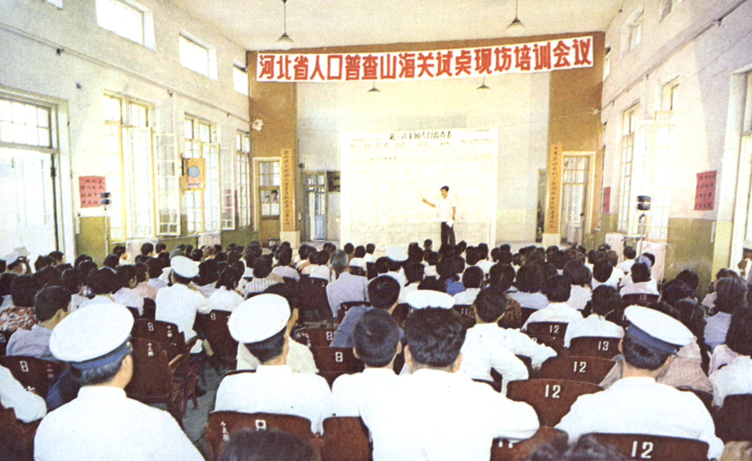
山海关人口普查试点现场培训会议会场。