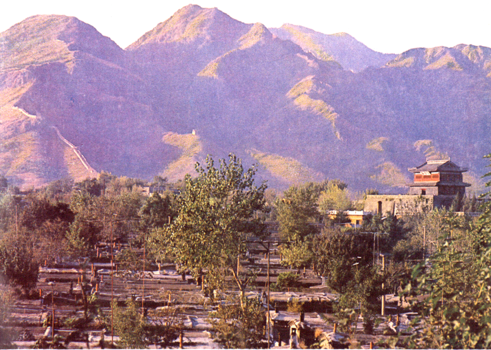
河北风光：天下第一关——山海关（秦皇岛）