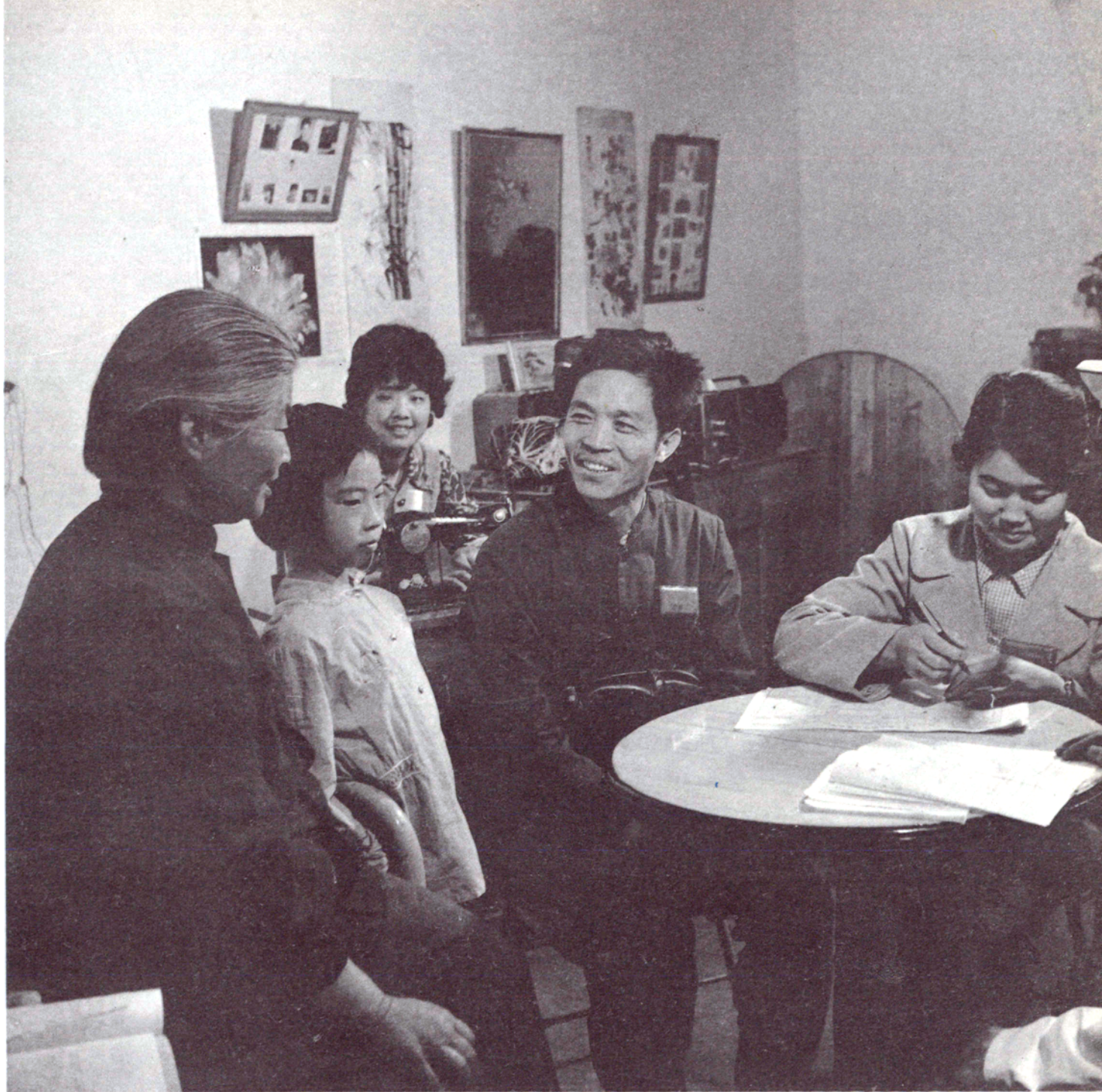
入户试登，摸索经验。