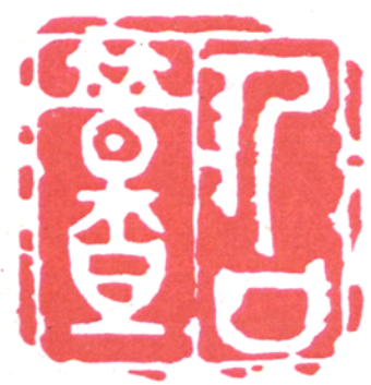
篆刻 人口普查 国家大事