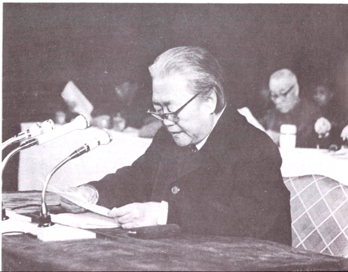
河北省副省长、省人口普查领导小组组长韩启民作报告，要求抓紧时间做好人口普查的各项准备工作。