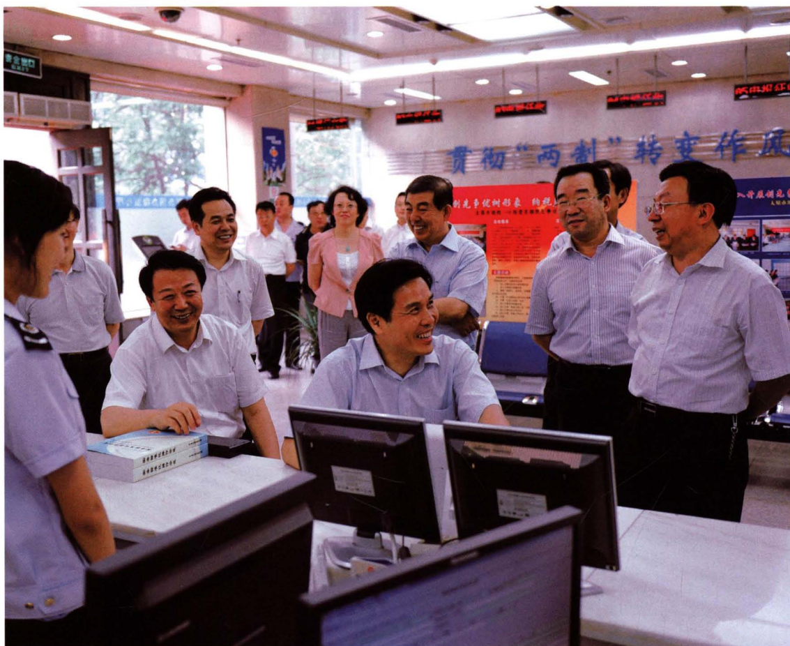
2011年7月4日，省委副书记、省长王君（前排左一），国家总局党组成员、副局长丘小雄（前排左二）在市局办税服务厅调研