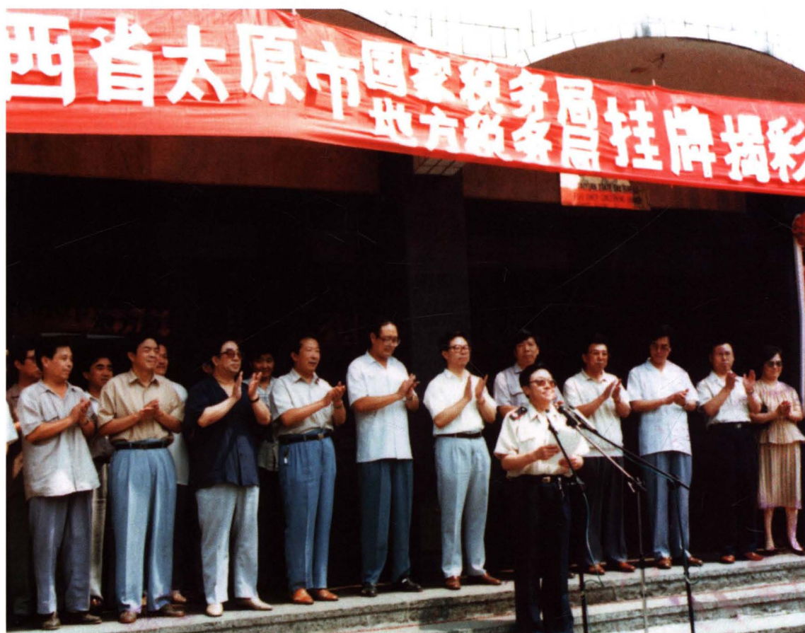
1994年8月1日，市局挂牌成立，各级领导应邀出席挂牌揭幕仪式