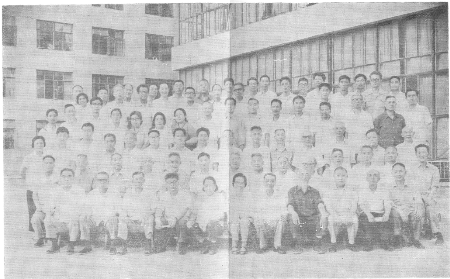
政协合肥市第七届委员会常务委员会委员合影