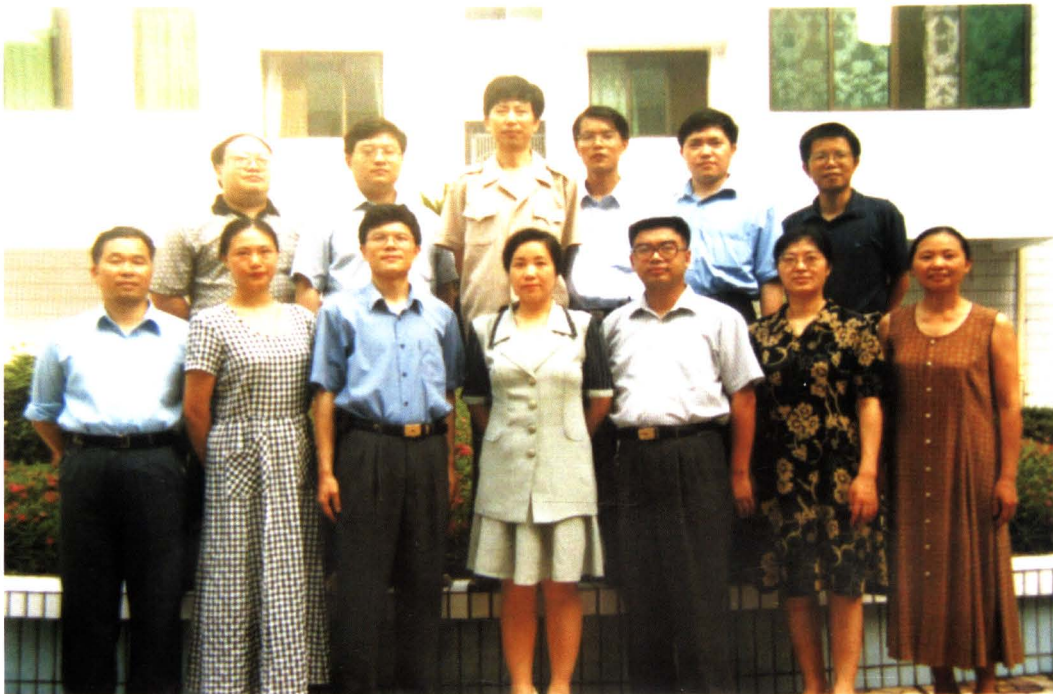
1996年，财政局领导和内设机构负责人合影