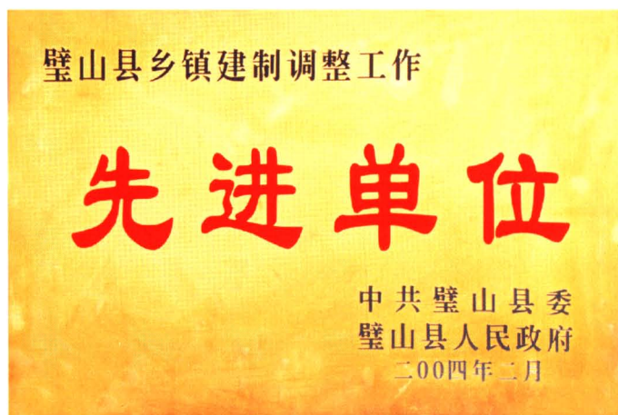
财政局获先进单位荣誉称号