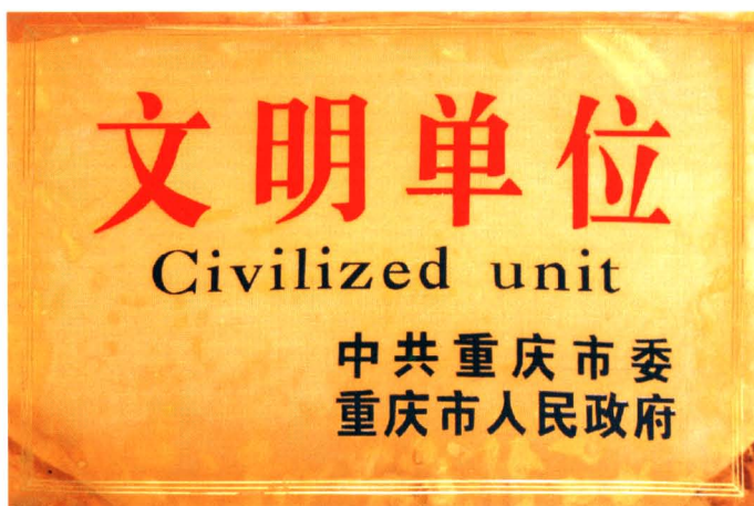
财政局成功创建为市级文明单位