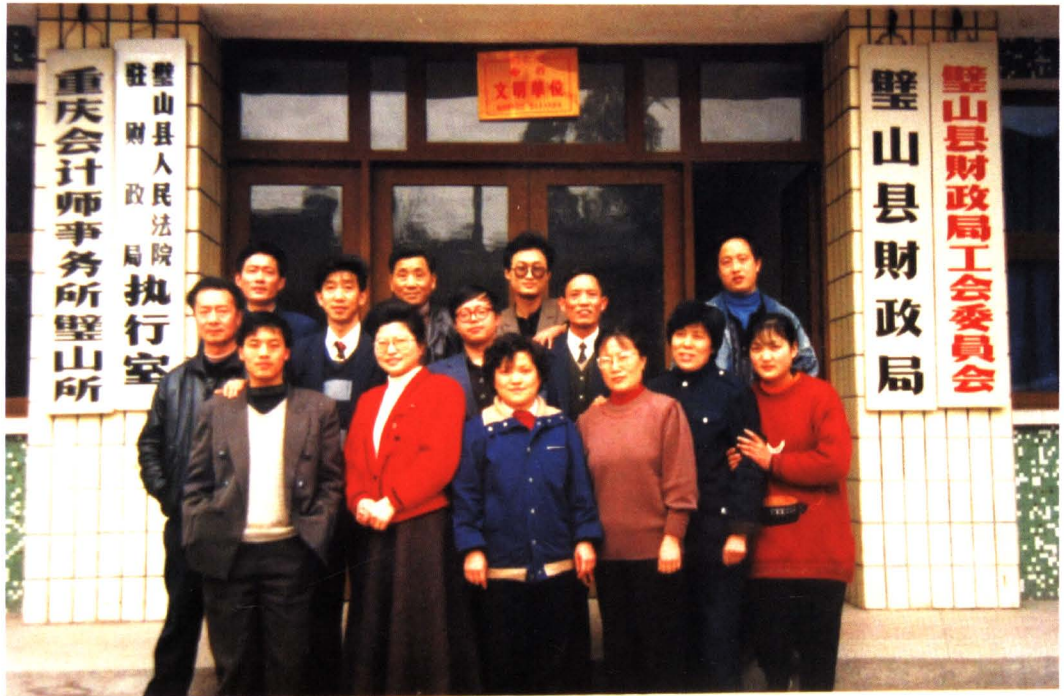
1980年，拆除解放东路29号平房，在原址修建一栋1000m 2 四楼一底的财税局办公楼