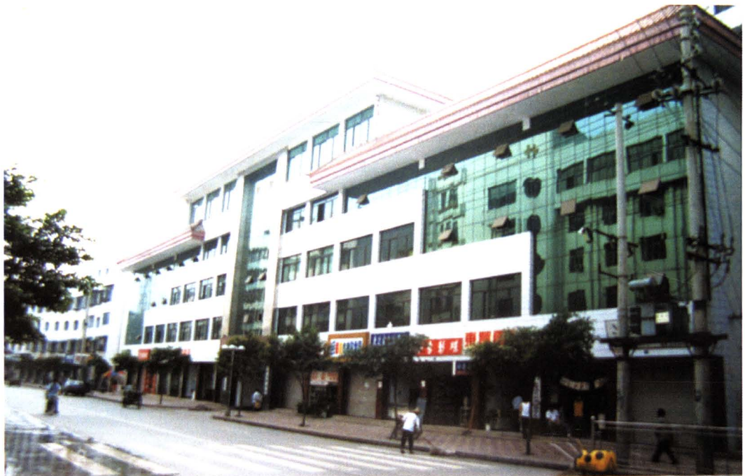
1997年，新建财政局办公楼和46套住宅楼。占地面积为3540M 2 ，总建筑面积8510m 2 ，总投资307万元