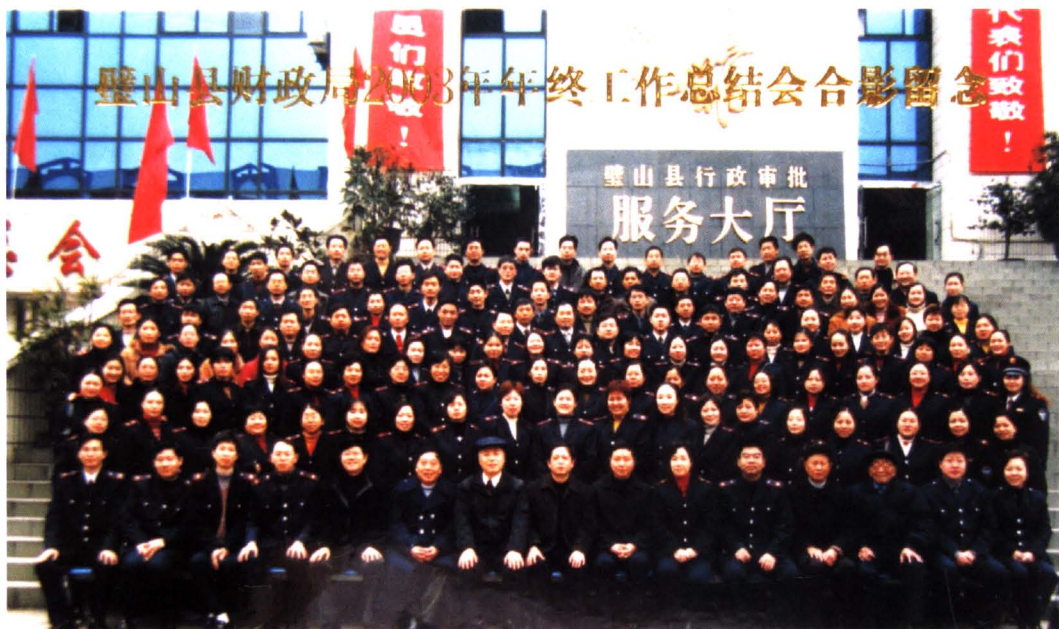
2003年，璧山县财政局年终总结会合影