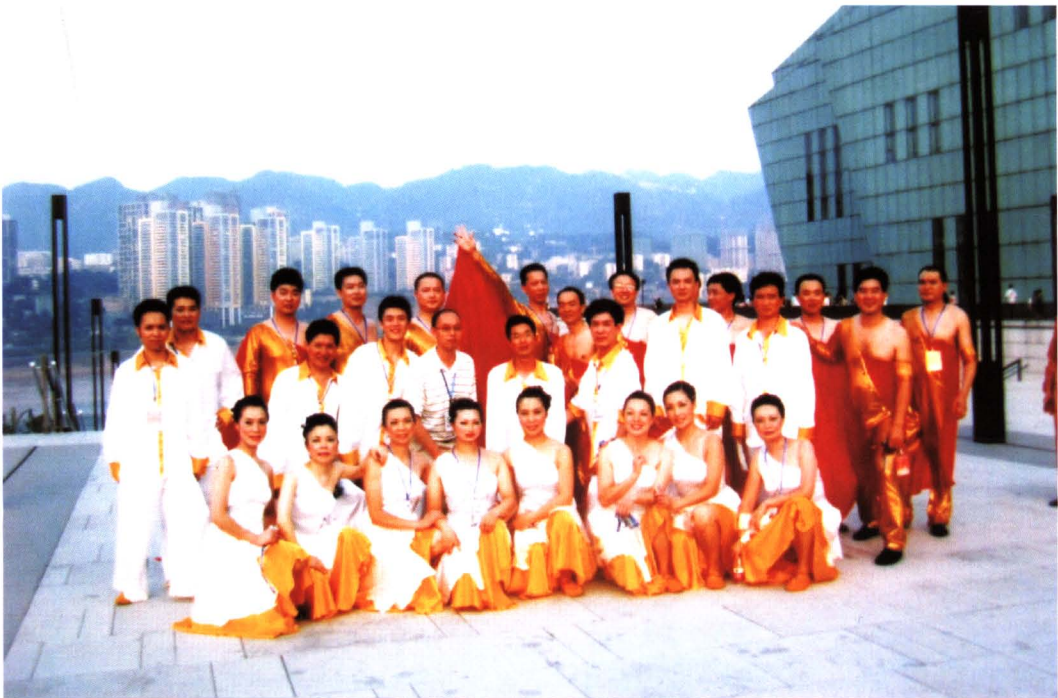
2010年，舞蹈《党旗颂》全体演员在重庆大剧院演出后合影