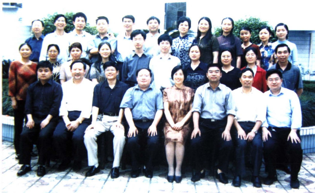
2002年，财政局机关全体人员合影