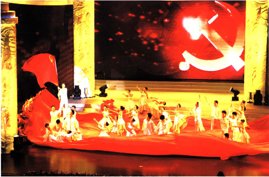
2010年，璧山县财政局选送的舞蹈《党旗颂》在重庆大剧院展演