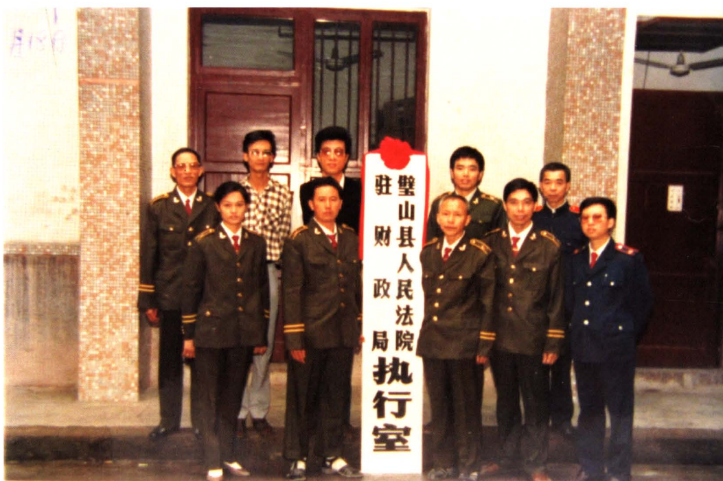
1992年，县法院设立财政局执行室