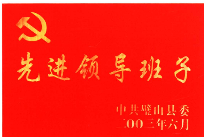
财政局领导班子获中共璧山县委表彰