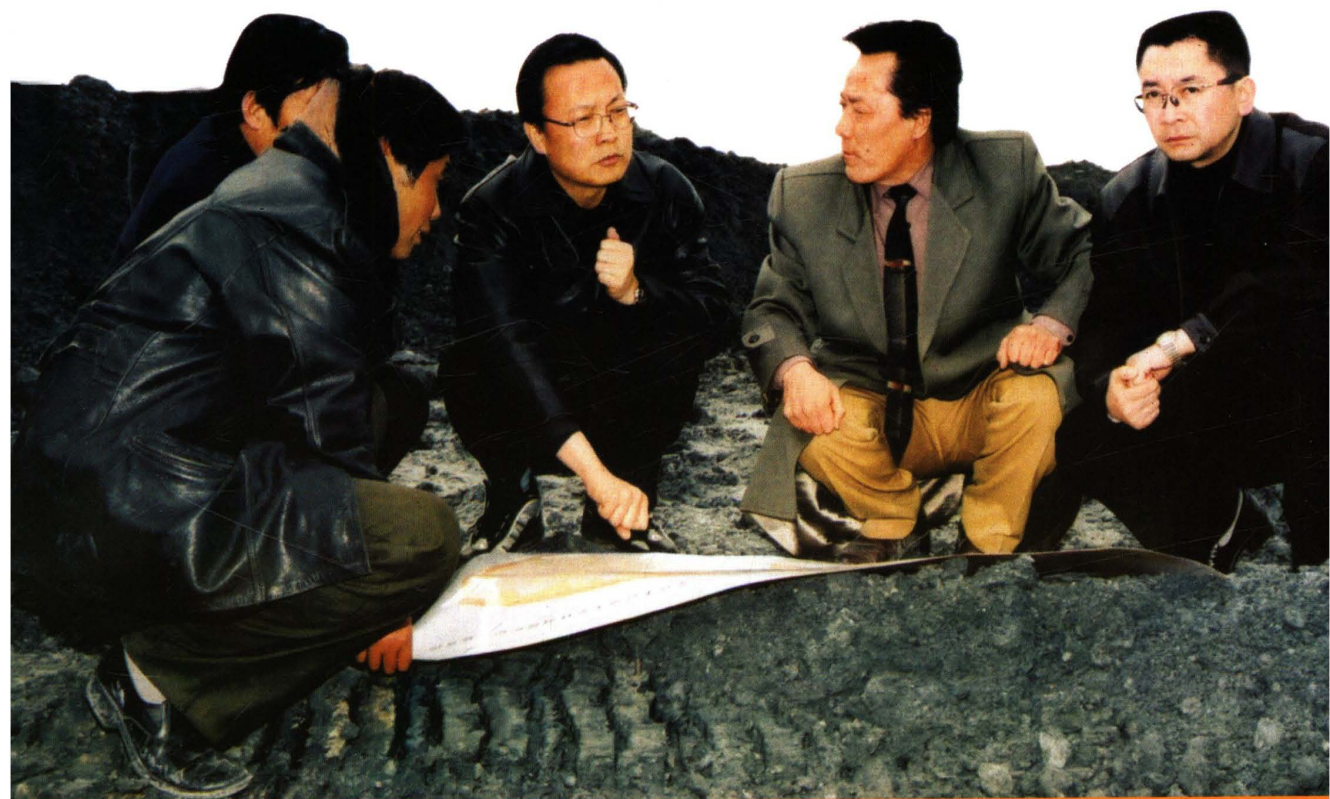
李鹏新书记在矿区调研