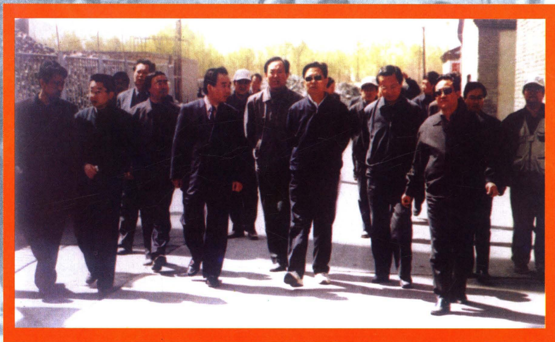
中共青海省委书记赵乐际检查指导海西工作