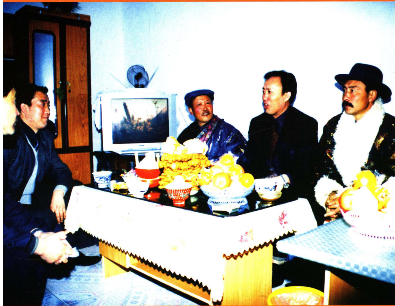
张守成州长在牧业点调研