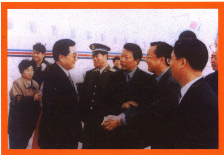
中共中央总书记胡锦涛视察海西