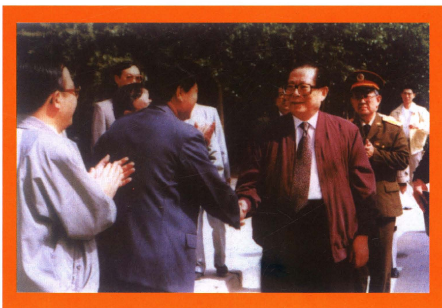
江泽民同志视察海西