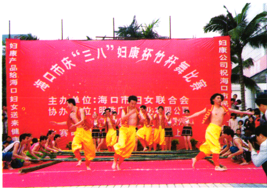
海口市广电局参加海口市竹竿舞比赛获金奖。