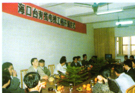
海口有线电视开通仪式。