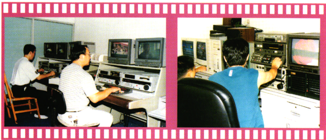
新闻编辑在操作数字后期编辑系统。