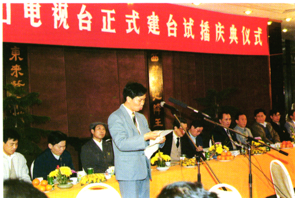
***** 海口电视台建台庆典。 *****