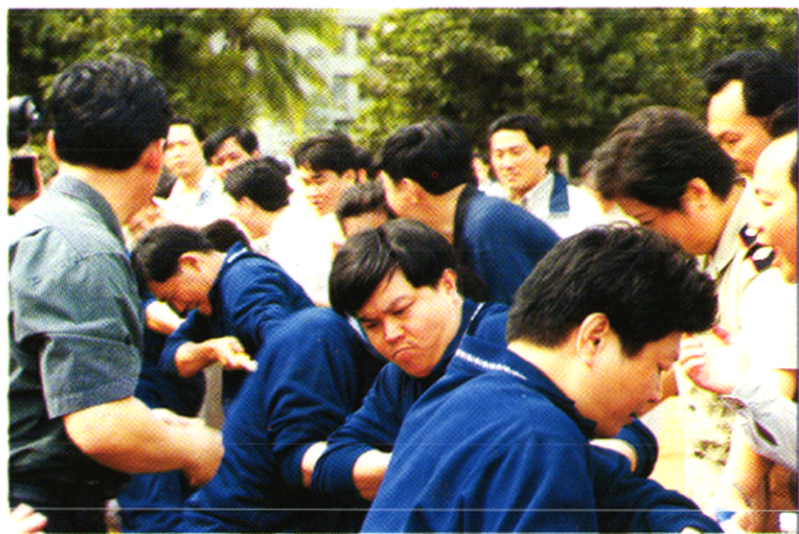
海口市广电局参加海口市拔河比赛。