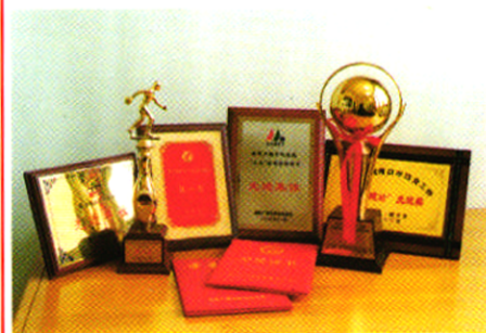
海口市广电局部分荣誉奖杯和证书。