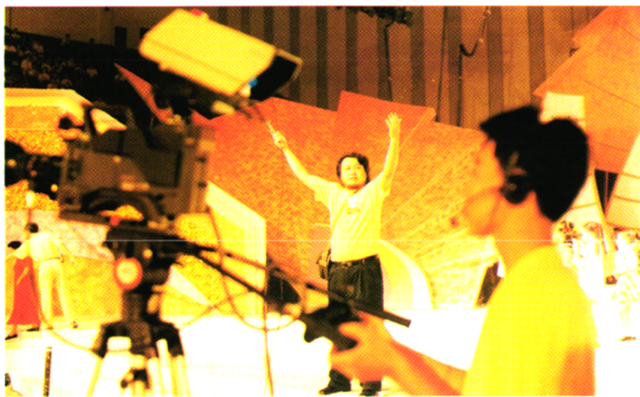
导演在大型晚会现场指挥。