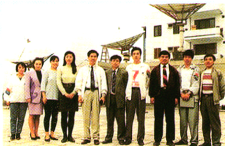
海口电视台建台时工作人员合影。