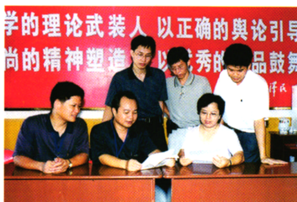
《海口市广播电视志》编委会办公室成员在研究书稿。