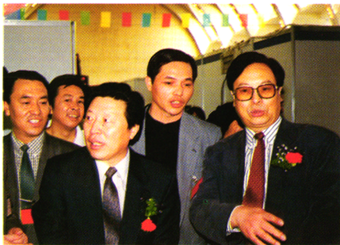
国家广电总局领导孙家正(左三)徐光春(右一)视察海口电视台展区。