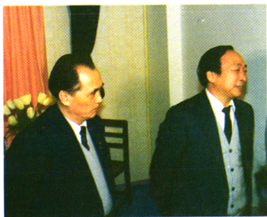
原海口市委书记林明玉（左一）、市长李金云（右一）视察海口电视台。