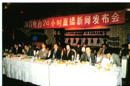
海口电台 24 小时直播新闻发布会。