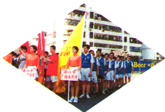
海口市广电局参加海口市足球赛。