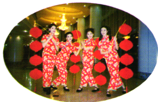
参加海口市秧歌大赛获一等奖。