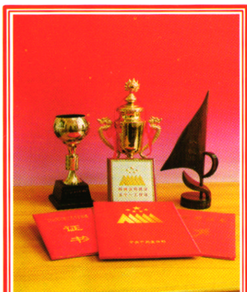
海口市广电局荣获的中宣部“五个一工程”奖等荣誉奖杯、证书。