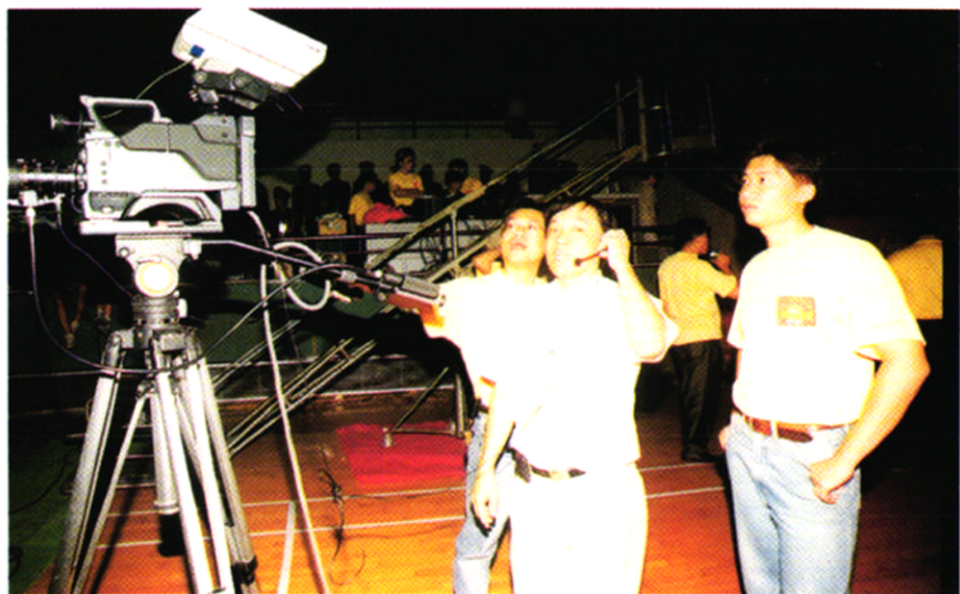
技术人员在大型直播节目现场。