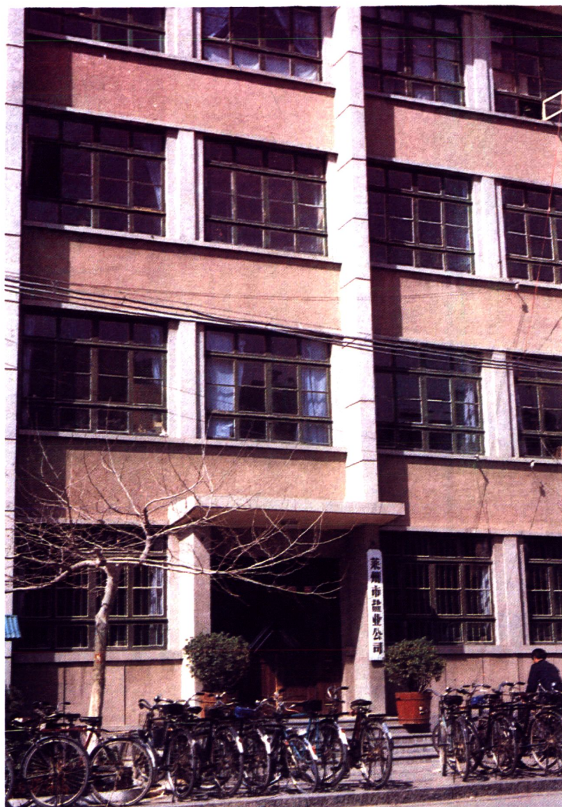
办 公 楼 外 景