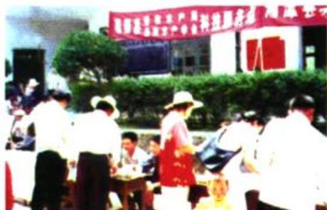
为农民朋友送科技服务上门