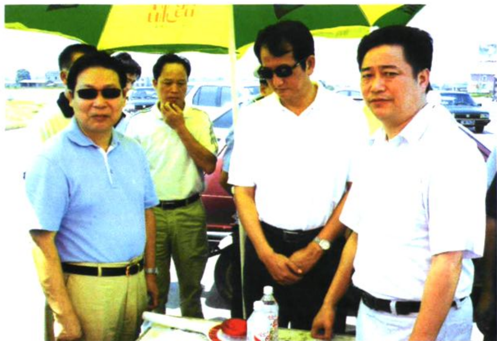
▲ 湖南省人民政府副省长杨泰波(左一)来湘潭县检查动物防疫工作