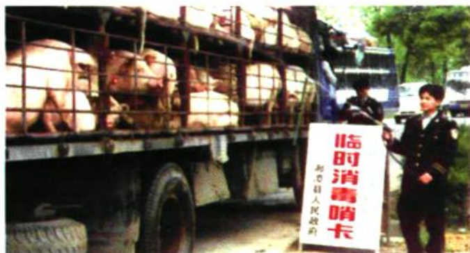
局检疫人员在消毒哨卡为外运生猪消毒