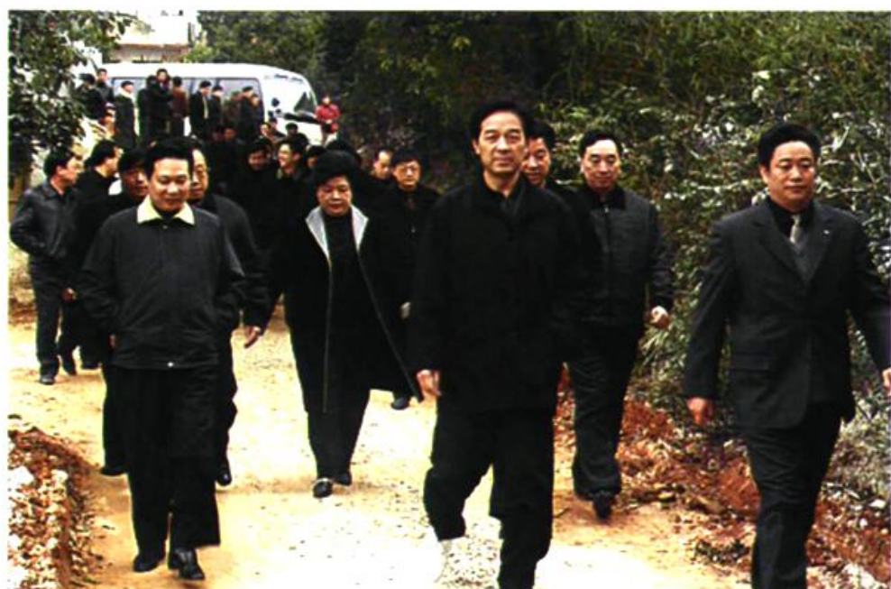
▲ 国务院防控禽流感检查组组长王陇德(卫生部副部长)在湘潭市委书记陈润儿(右三)、市委常委、县委书记刘清林(右二)陪同下到湘潭县射埠镇湾塘村检查防控禽流感工作