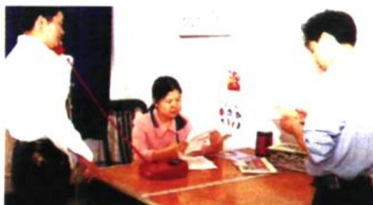
机关工作人员在紧张工作