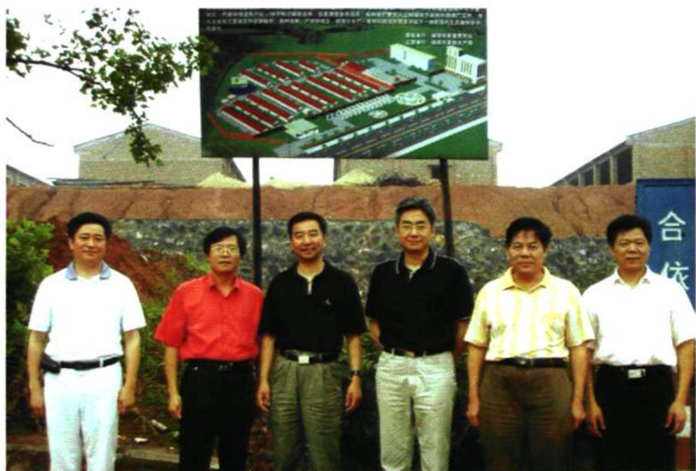
▲ 国家农业部畜牧兽医总站党组书记何新天(左三)来湘潭县调研