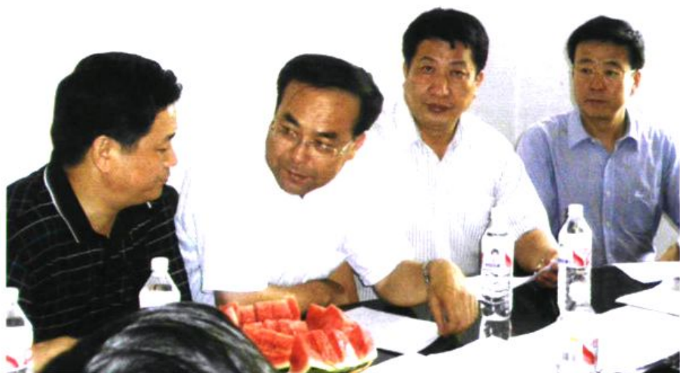
▲ 农业部部长孙政才(左二)在市委书记彭宪法(右二)陪同下视察湘潭县动物防疫工作。图为县畜牧水产局局长廖立春汇报情况