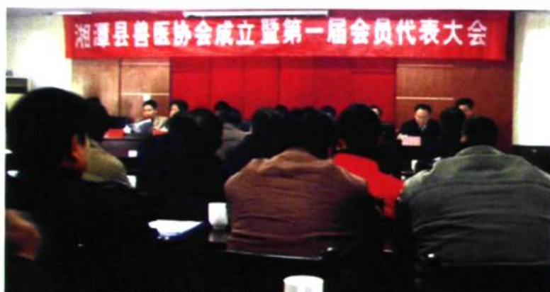
► 2007年4月,湘潭县兽医协会成立