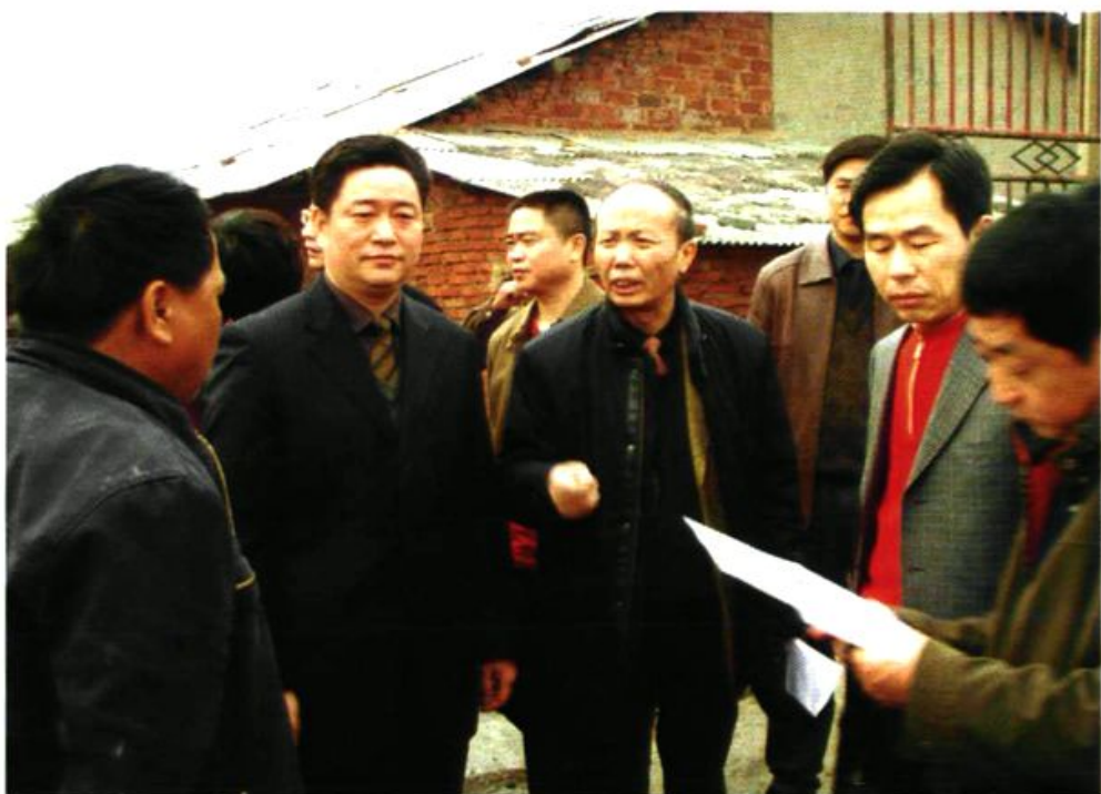
▲ 国家农业部畜牧兽医总站站长谷继承(中)在副市长朱少中(右二)陪同下来湘潭县调研