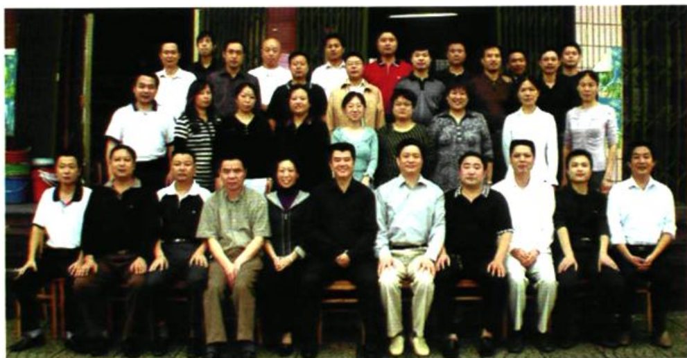
2006年,县畜牧水产局全体干部职工合影