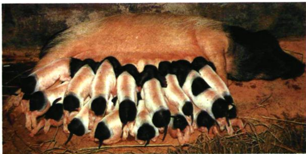
湖南地方良种——沙子岭猪