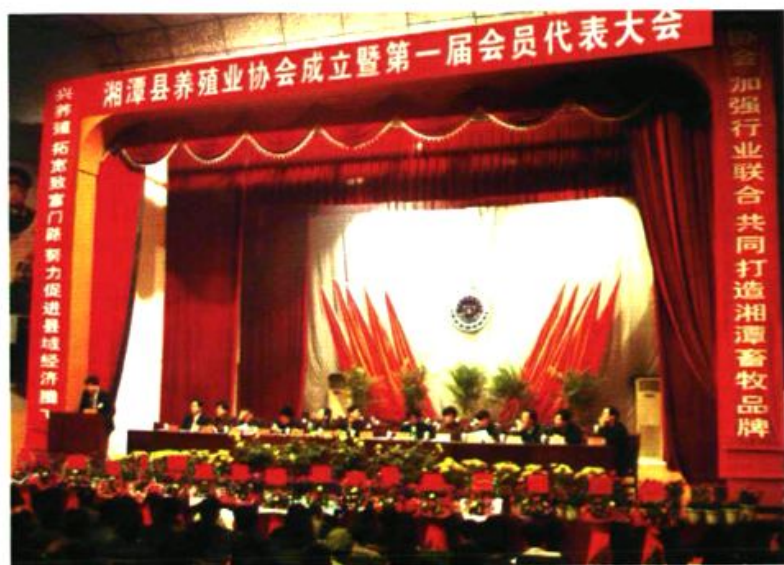
▲ 2005年3月8日,湘潭县养殖业协会成立