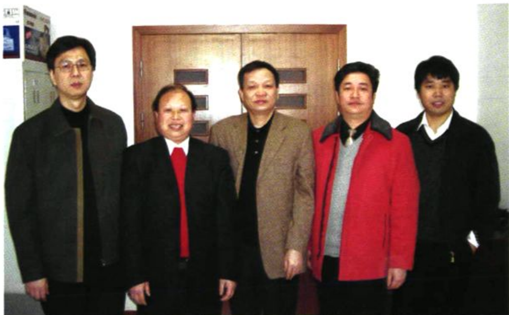
▲ 县畜牧局局长廖立春、青竹生猪产业协会会长卢国良赴京向国家农业部畜牧司王智才司长(中),陈伟生(左一)、杨振海(右一)副司长汇报工作