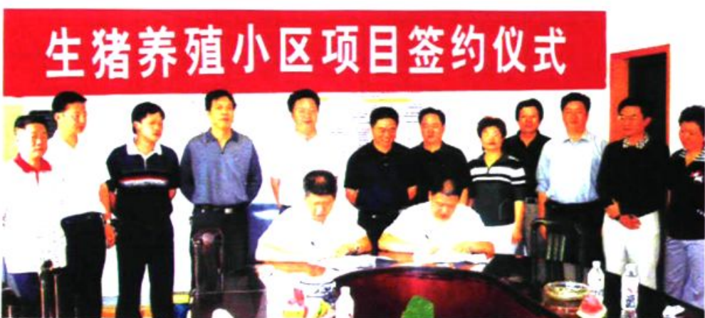
▲ 伟鸿5万头生猪养殖小区落户湘潭县梅林桥镇。图为签约仪式