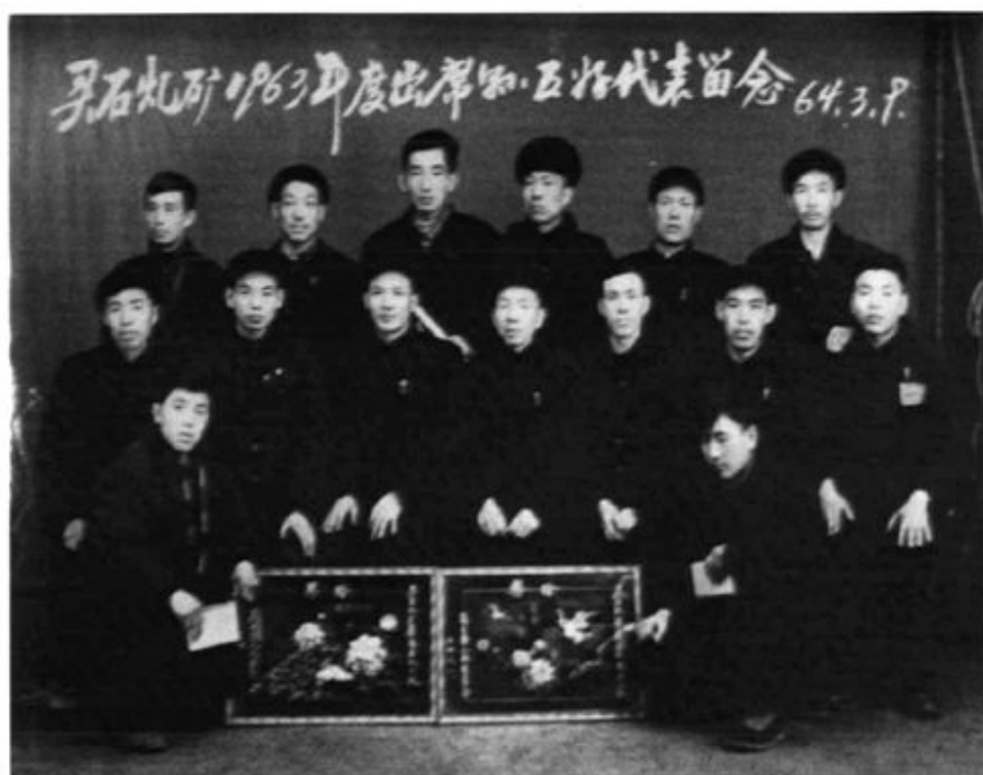
1963年度优秀职工代表合影