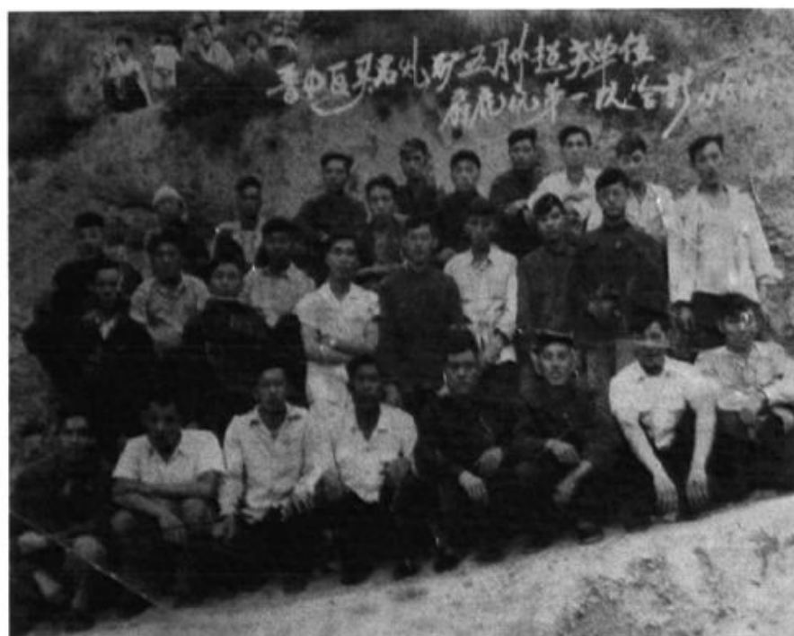
1965年度先进生产集体合影