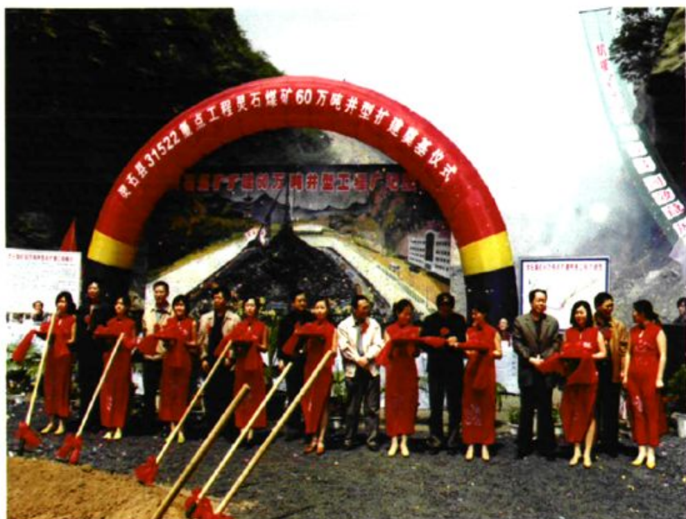
灵石煤矿60万吨井型技改扩建工程剪彩仪式，这标志着灵石煤矿向高产高效的现代化矿井迈进