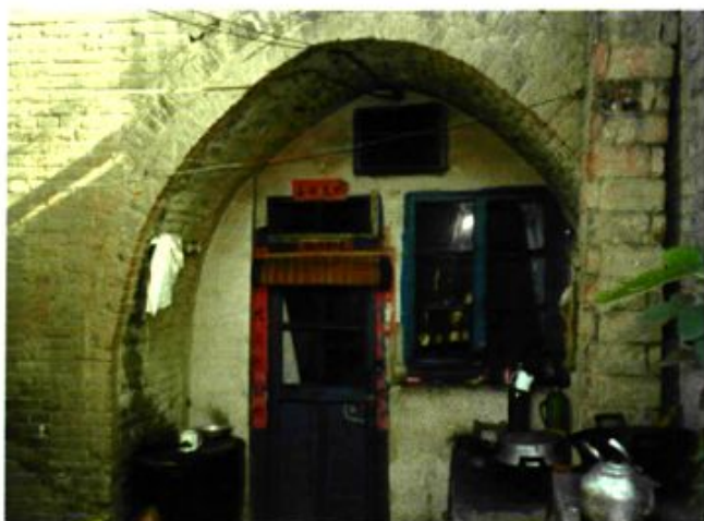
五、六十年代职工生活住宅