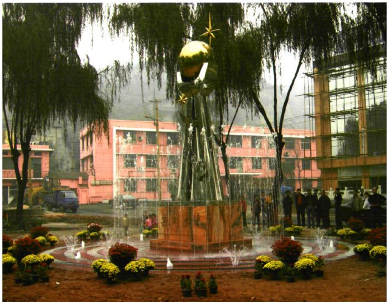
环境优雅的矿区一角