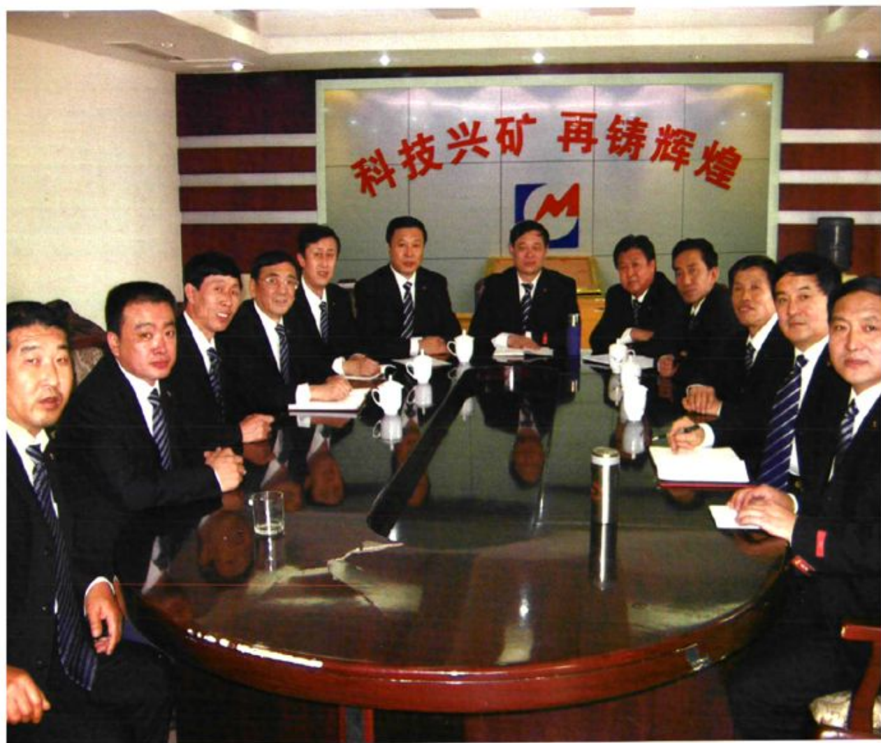
团结奋进、求真务实的领导班子