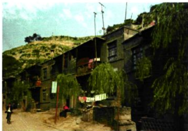
七、八十年代职工生活住宅