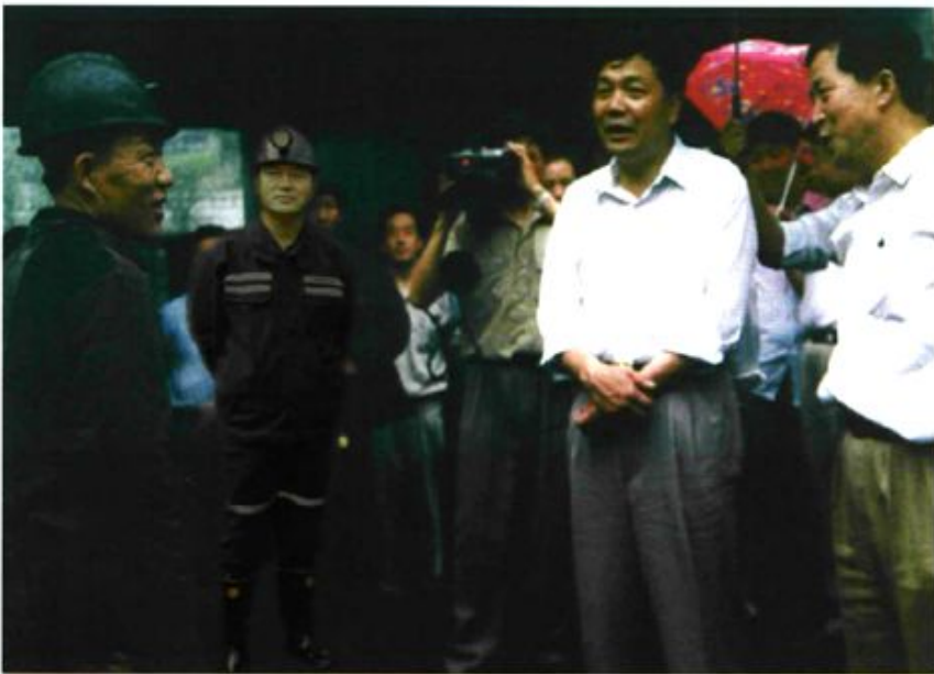
1994年时任晋中行署专员范雄相在灵石煤矿视察