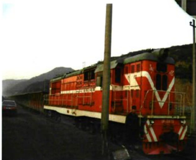
自备的煤炭铁路发运专用线