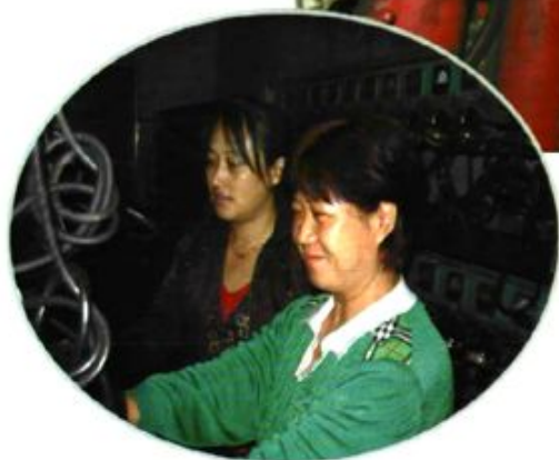
周到细致的生产服务