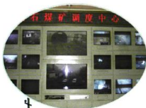
现代化的监控指挥系统