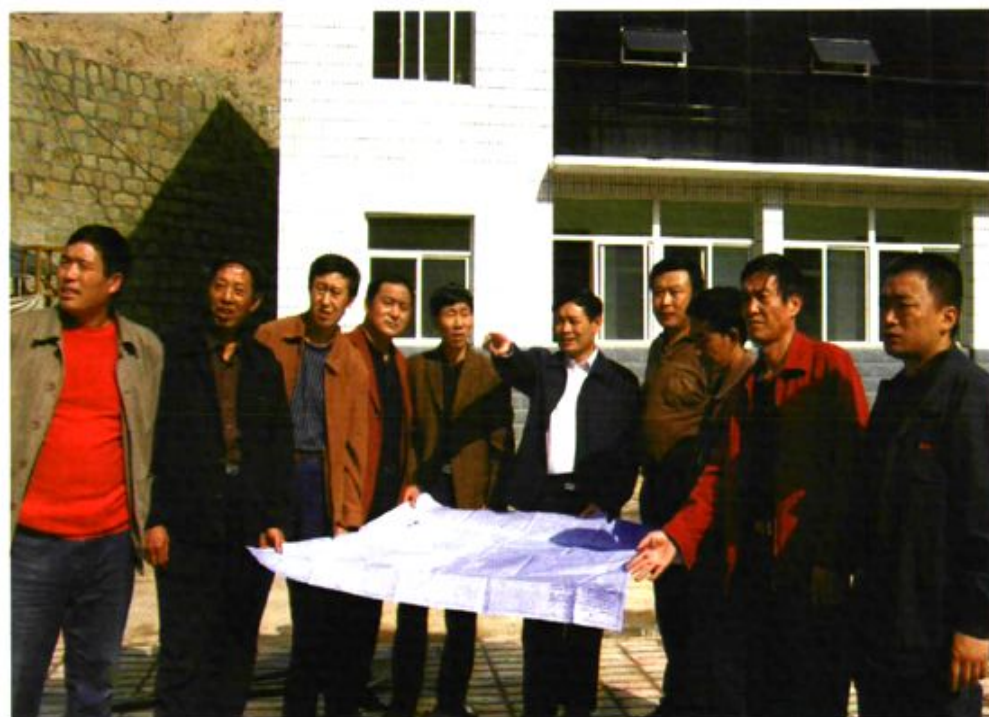
公司决策者运筹帷幄，对未来充满信心