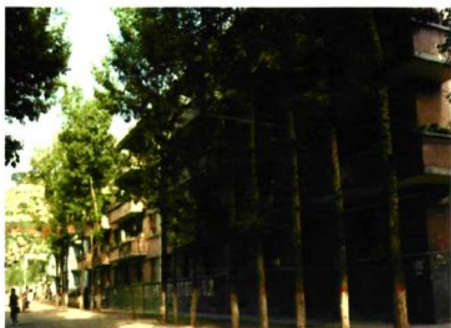
九十年代职工生活住宅