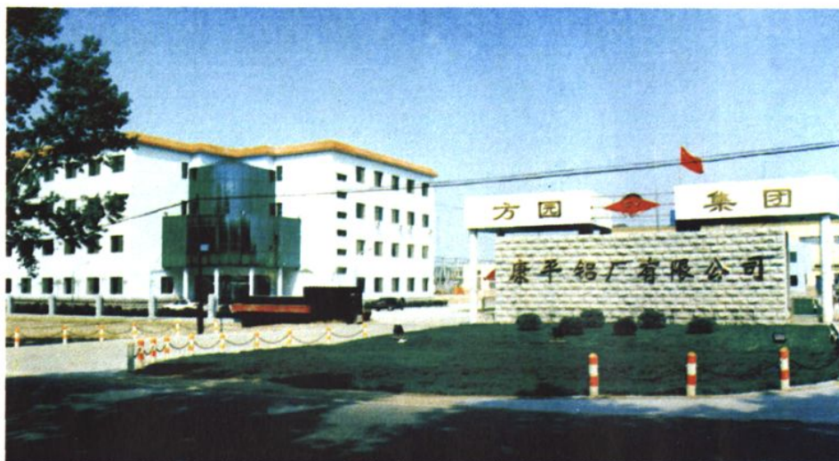
◀ 方园集团康平铝厂有限公司