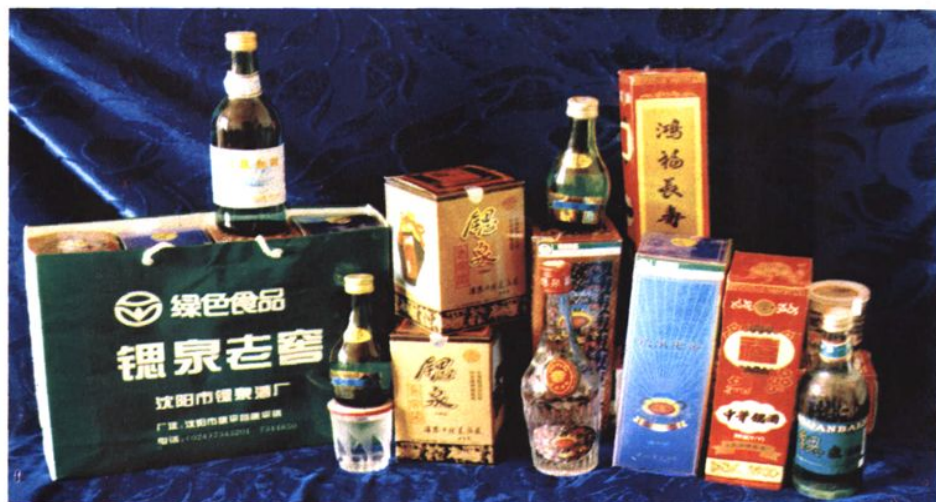
◀ 康平魏泉酒厂魏泉系列产品