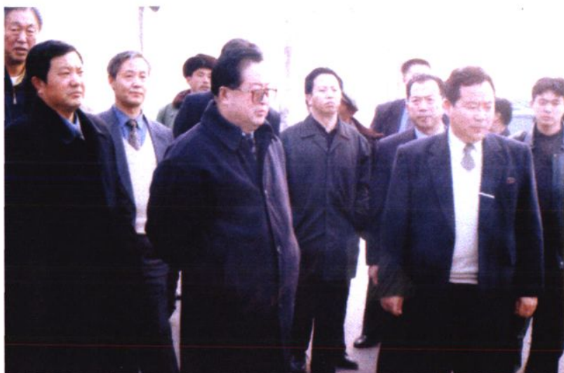
→1999年，中共辽宁省委常委、市委书记徐文才到康平县视察农建。前排左起：赵玉岩、徐文才、王淮延（右三）、姜涛（右二）