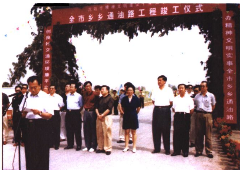
▶1999年，中共沈阳市委副书记赵金城到康平县参加全市乡乡通油路竣工仪式。前排左起：王淮延、赵玉岩、赵金城、高示范（右三）、贾殿屏（右二）