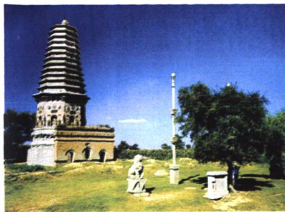
↑新整修的省级文物辽代佛塔