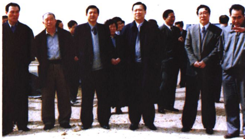
◀沈阳市人大主任张荣茂等领导到康平县视察。前排左起：张瑞昌、郭士才、赵玉岩、张荣茂、金明仕