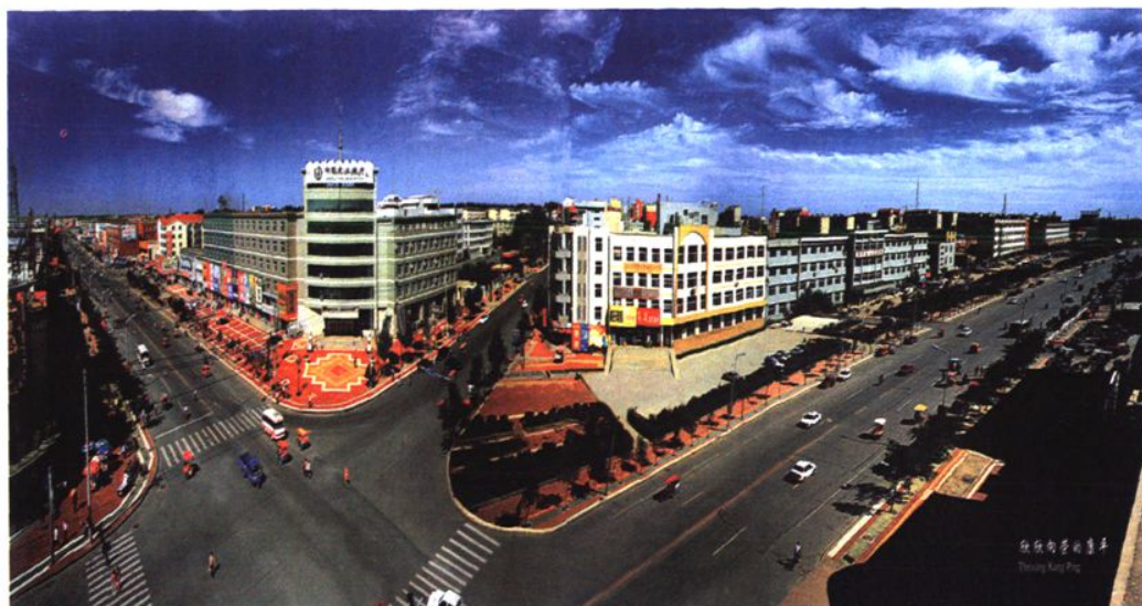
↑康平县城中心街街景