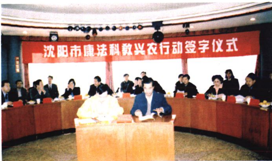
←1999年沈阳市康法科教兴农行动启动仪式在康平宾馆举行