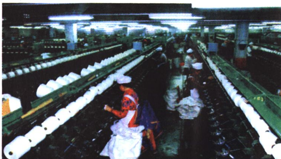
▶ 康平县纺织厂纺纱车间