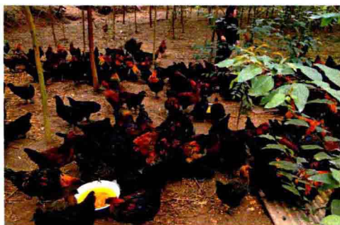
农林牧副渔业得到迅猛发展，以林为主大力发展林下经济