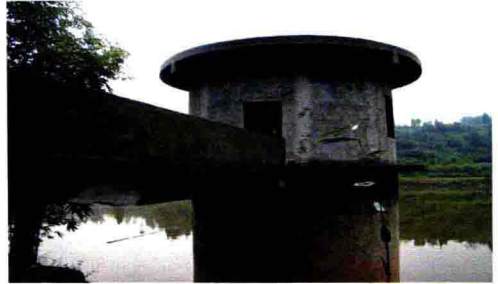
河道治理彰显能量，城乡居民饮用水质量得到提高