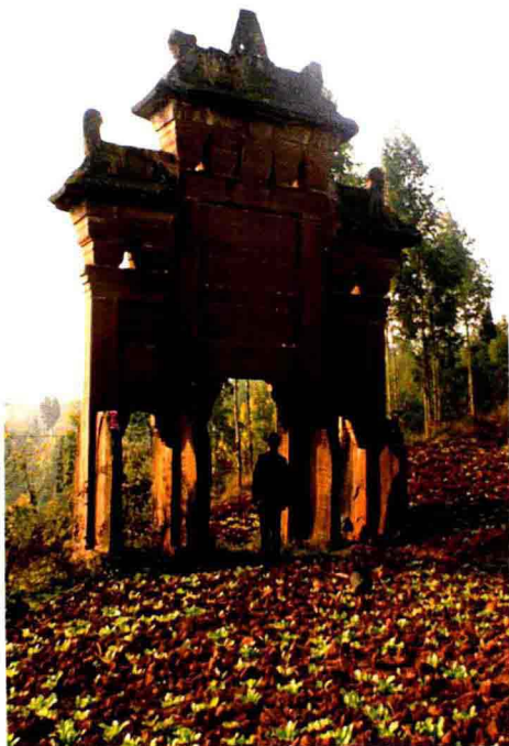
保存完好的清代牌坊