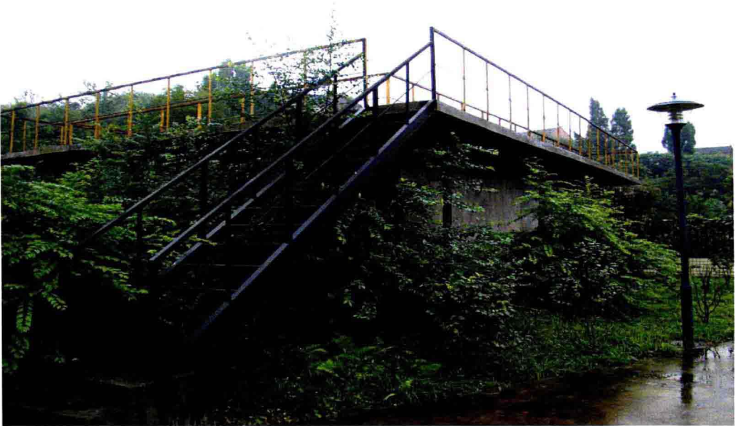
自来水厂日供水量达300m 3