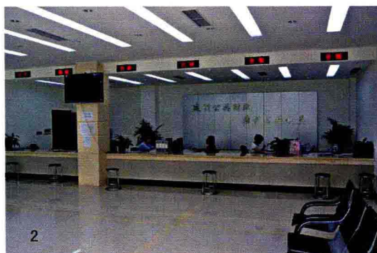
下图影剧院、大会场