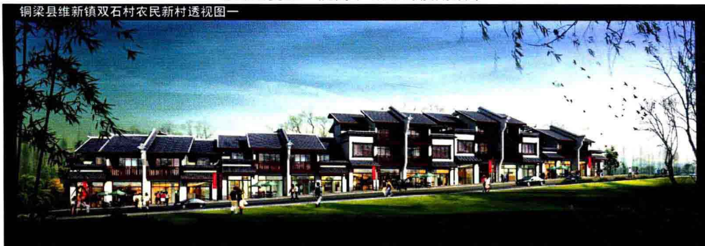
铜梁县维新镇双石村农民新村透视图一