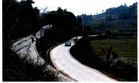
交通事业成效显著，城乡一体化交通网络已形成格局