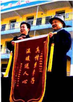
维新籍成功人士 多年来一直关心支持家乡教育事业