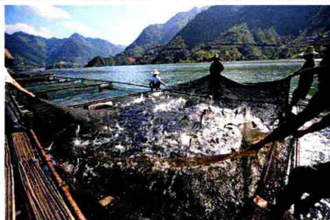
渔业生产快速发展，农民创收有了可靠保障