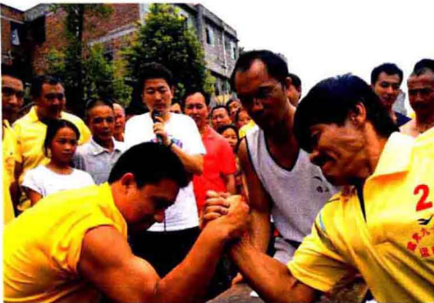
因地制宜开展群众体育活动