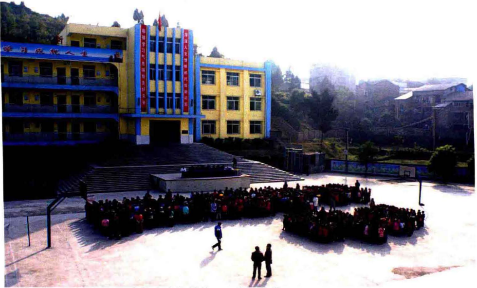
培养人才的摇篮——维新小学