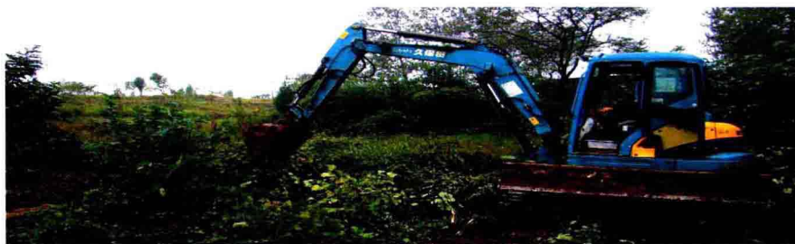
宅基地复垦，提高了土地的使用效率