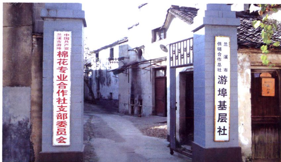
市供销合作总社游埠基层分社