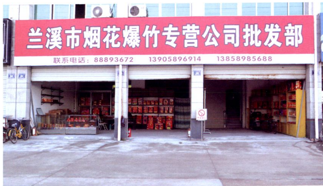
市日用杂品公司烟花爆竹批发部