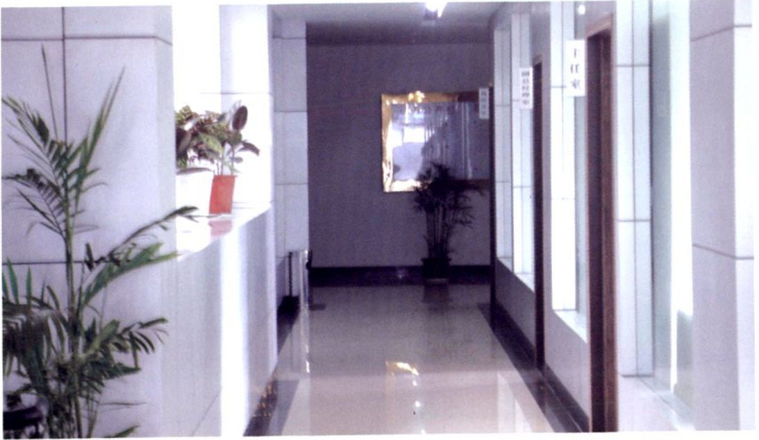
市供销合作总社内设机构（一）