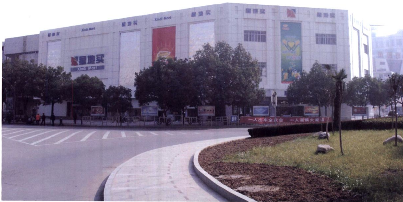
全市最大的连锁超市“星地买”全景