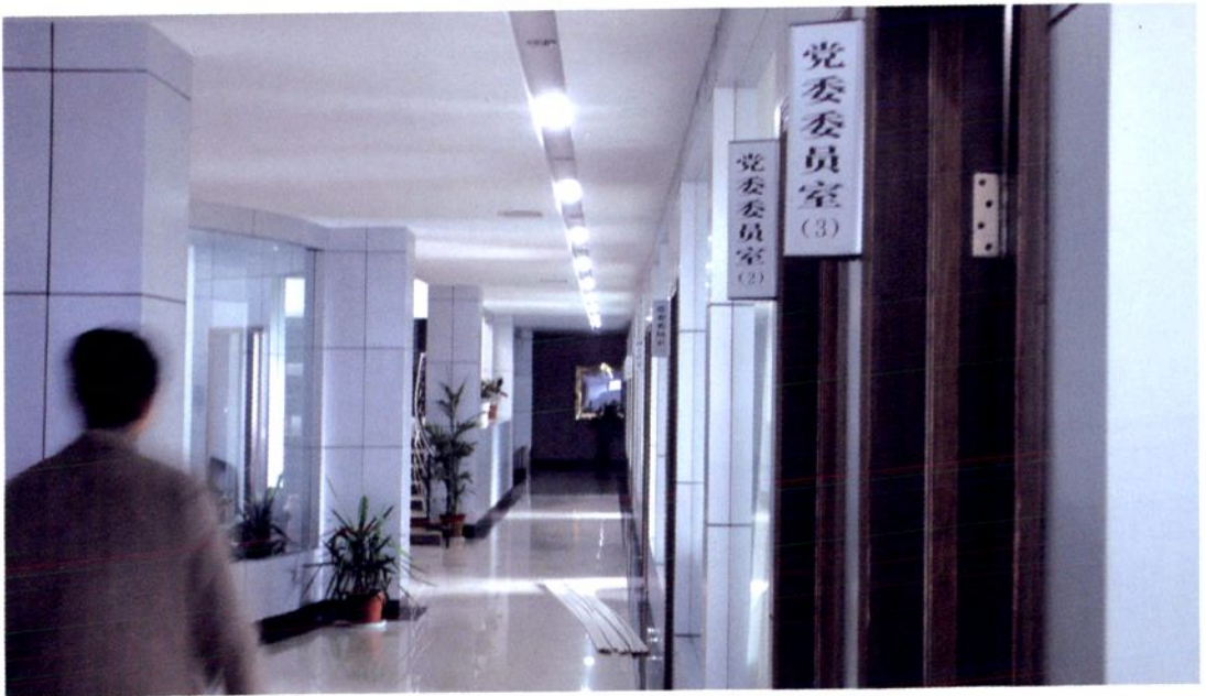
市供销合作总社内设机构（二）