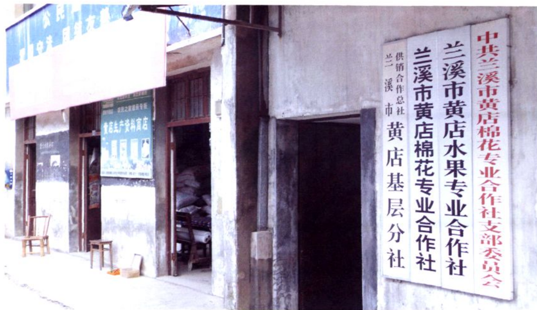
市供销合作总社黄店基层分社