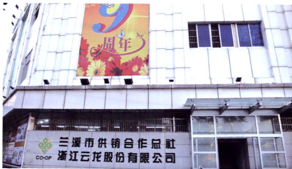
市供销合作总社机关办公现址