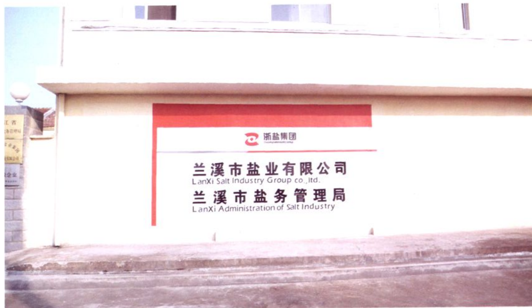
兰溪市盐业有限公司现址