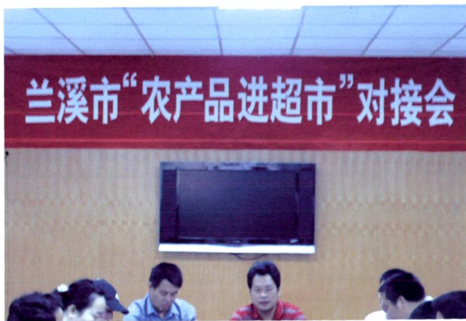
市供销社组织农产品进超市对接会。