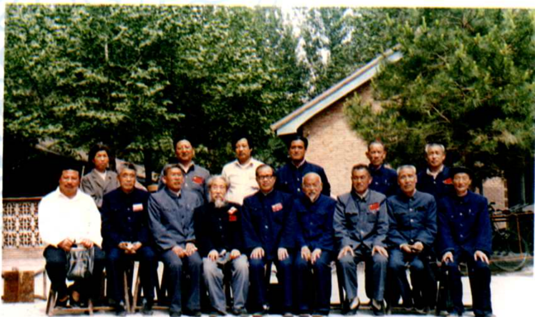
政协平陆县第三届委员会全体常委