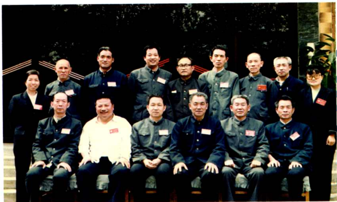
政协平陆县第四届委员会全体常委