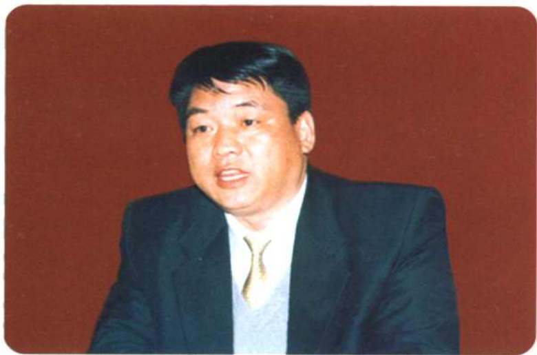
中共平陆县委书记姚十保，在县政协六届五次全会开幕式上作重要讲话