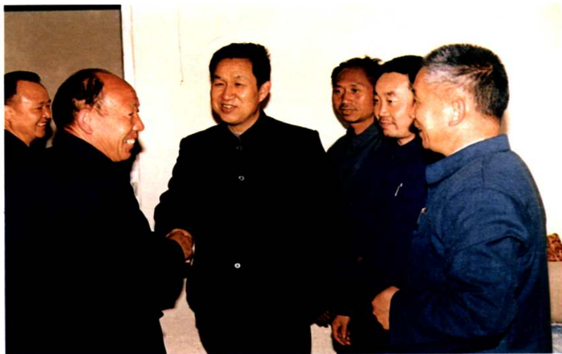
政协平陆县制定并坚持走访委员制度。图为第五届政协主席张瑞宏下乡走访委员