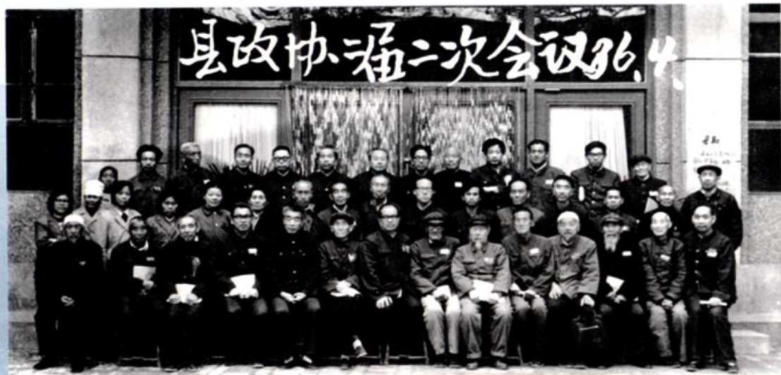
政协平陆县第二届委员会全体委员