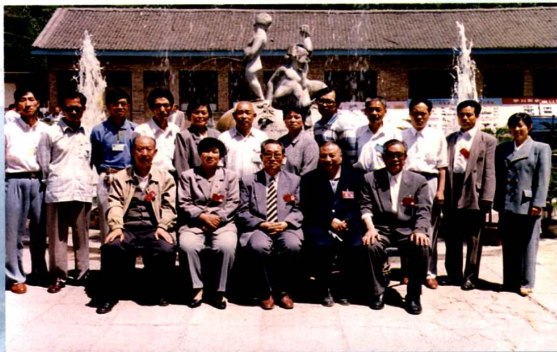
五届五次会议期间，政协领导与大会工作人员合影