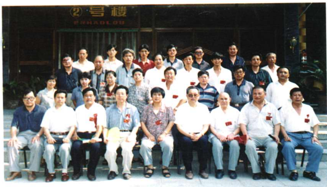
六届一次会议期间，政协领导、常委与大会工作人员合影