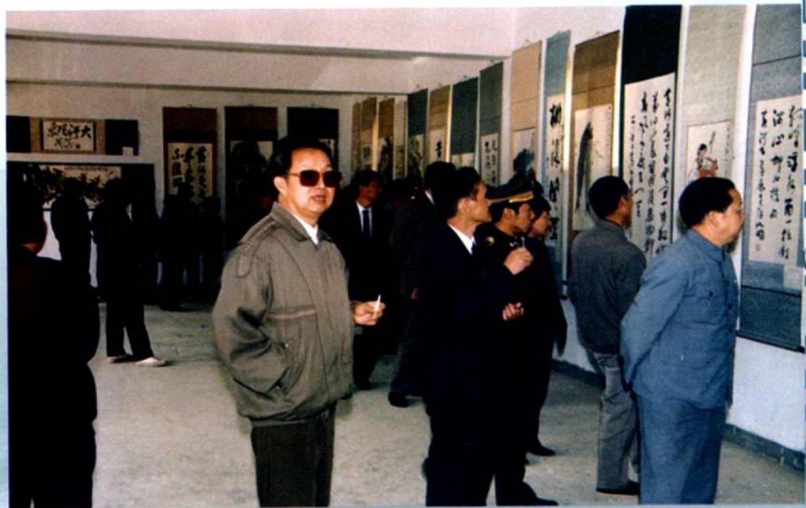
1990年，第四届政协主席张瑞宏和委员们观看《黄河书画展》