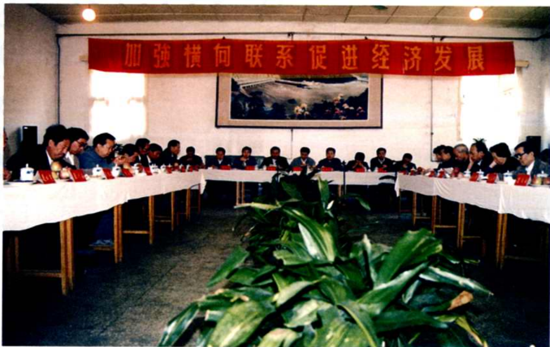
1993年10月，秦、晋、豫23县(市)横向联系会议在我县召开