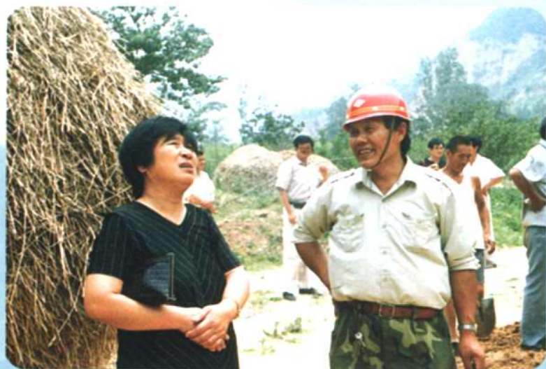
第六届政协主席陈平果(左)，在洪池乡南坡村电力改造工地进行调查研究