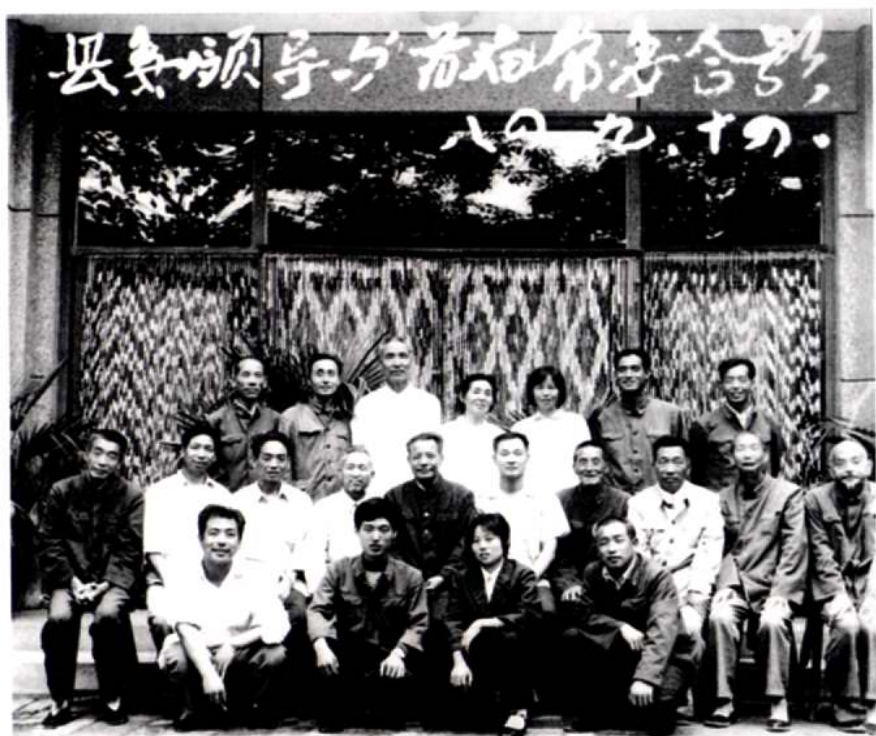
县委领导与政协平陆县第一届常委及工作人员合影