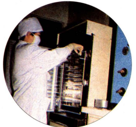
辽宁省劳动卫生研究所 技术人员在做粉尘毒理实验