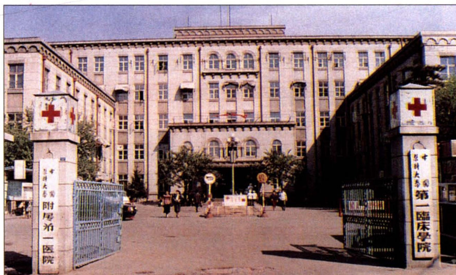
中国医科大学附属第一医院