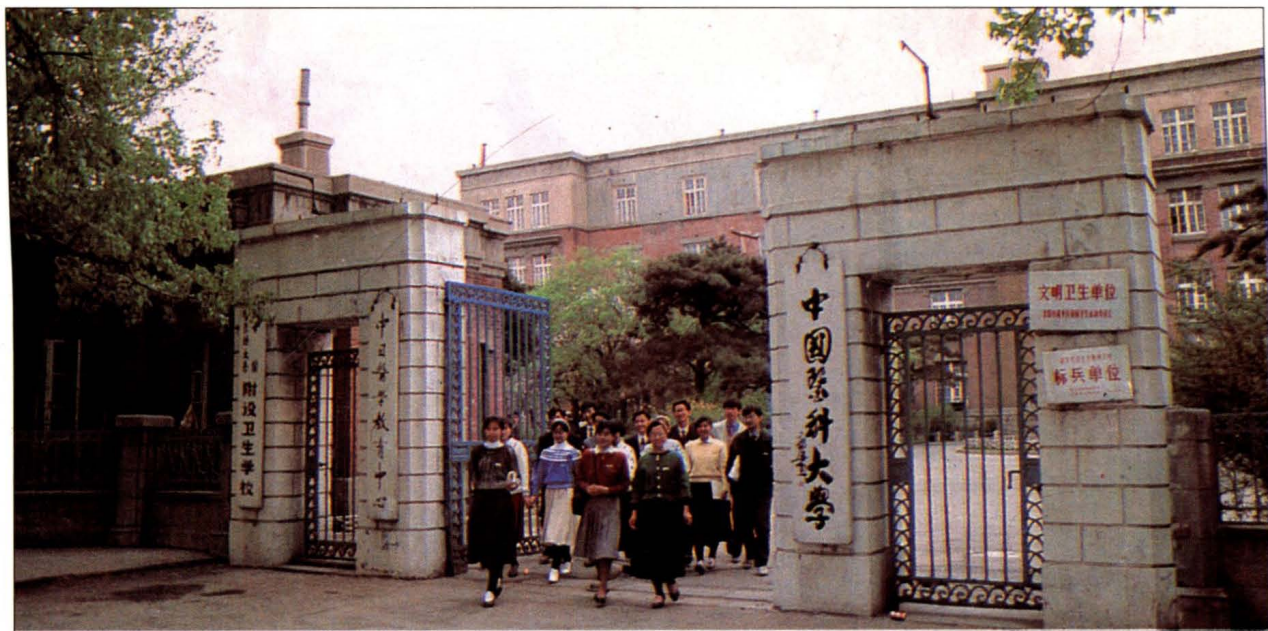
中国医科大学校门