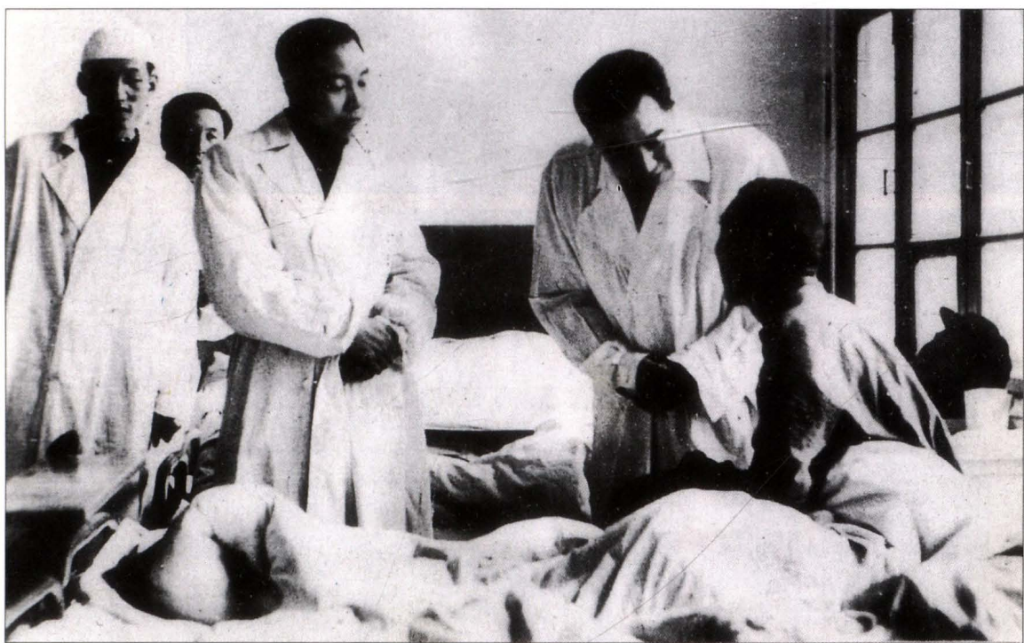
1952年11月周恩来总理(右立一)在旅大第一战勤医院探望中国人民志愿军伤病员