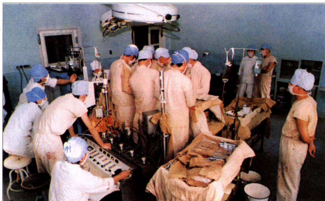
大连医学院附属第一医院心胸外科在体外循环下进行心脏手术