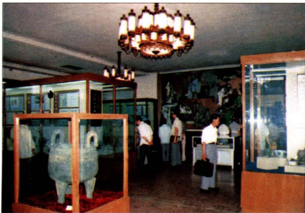
辽宁中医学院医史博物馆