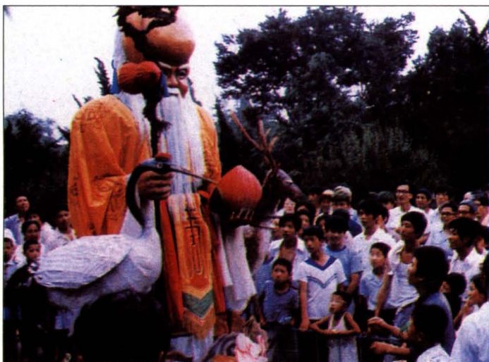
1984年大连市卫生科普游园大会一角