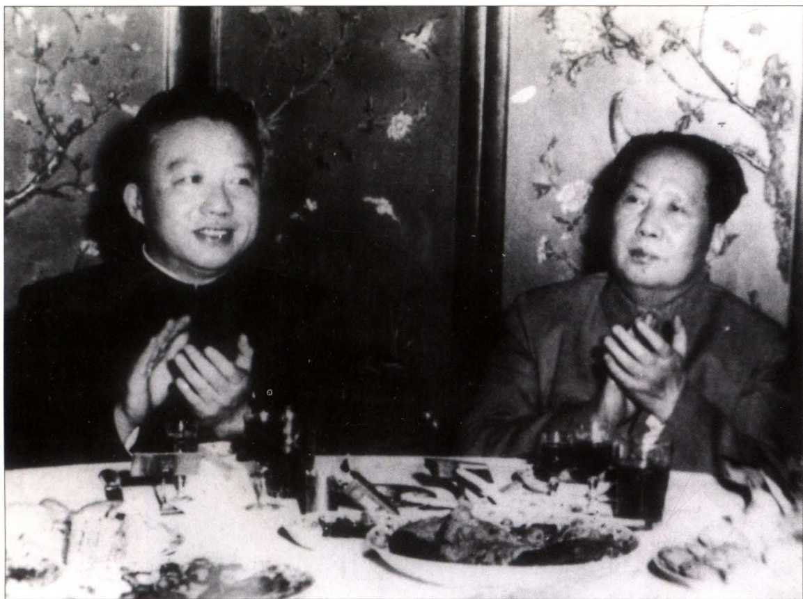
1956年2月6日最高国务会议期间，大连医学院魏曦教授受到毛泽东主席的宴请