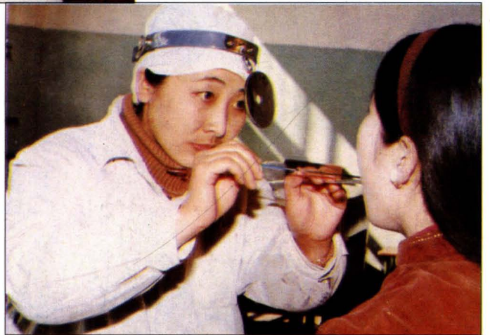
辽宁中医学院附属医院 用独特的中医传统 烙法治疗喉病