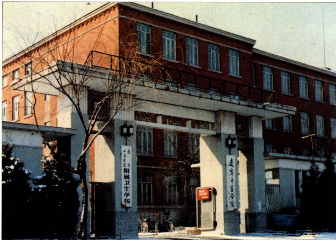
辽宁中医学院校门