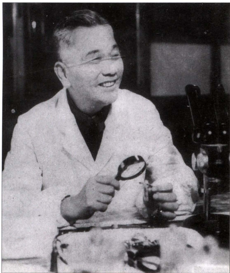
大连医学院伍律教授防治柞蚕饰腹寄蝇的有效药剂“灭蚕蝇Ⅰ号”和“灭蚕蝇Ⅲ号”的研究成果, 1981年获国家发明二等奖