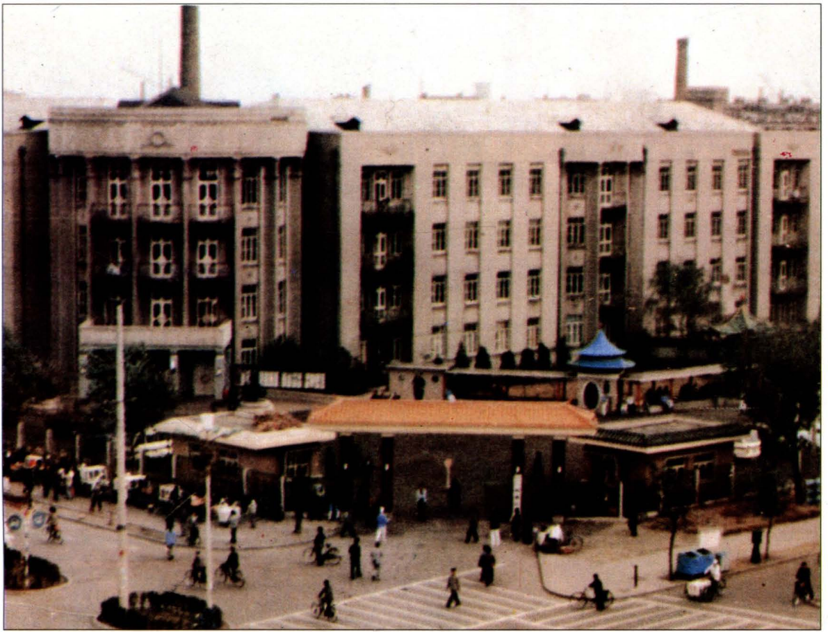
辽宁中医学院附属医院外景