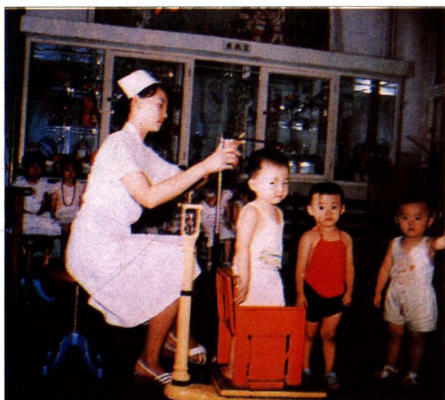
大连市儿童保健所医务人员在为儿童进行健康检查