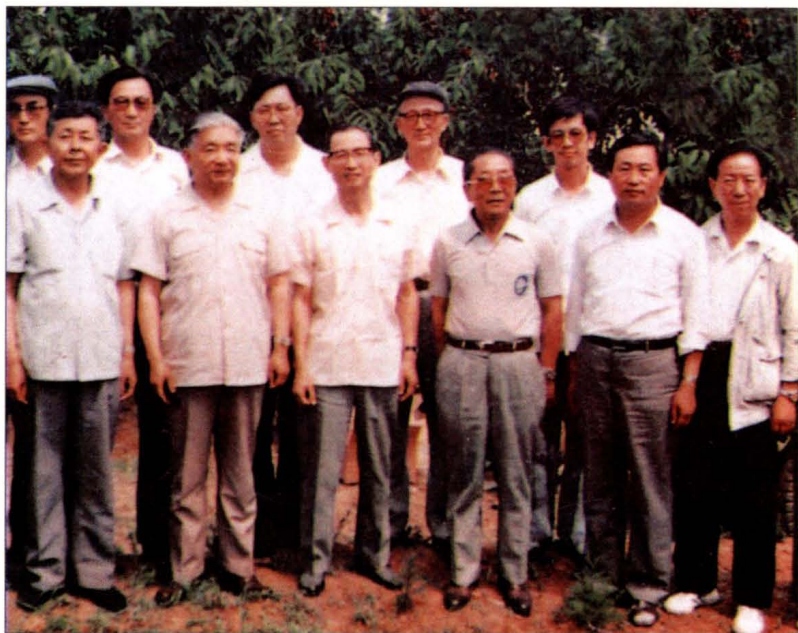
国家卫生部部长陈敏章(左六)，在辽宁省副省长王文元(左四)，省卫生厅厅长王滋民(左二)陪同下视察金州农村卫生