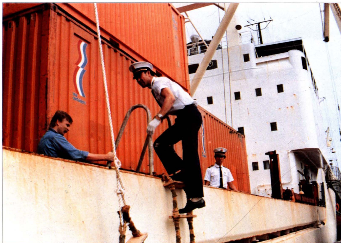
大连卫生检疫所检疫人员登轮检疫