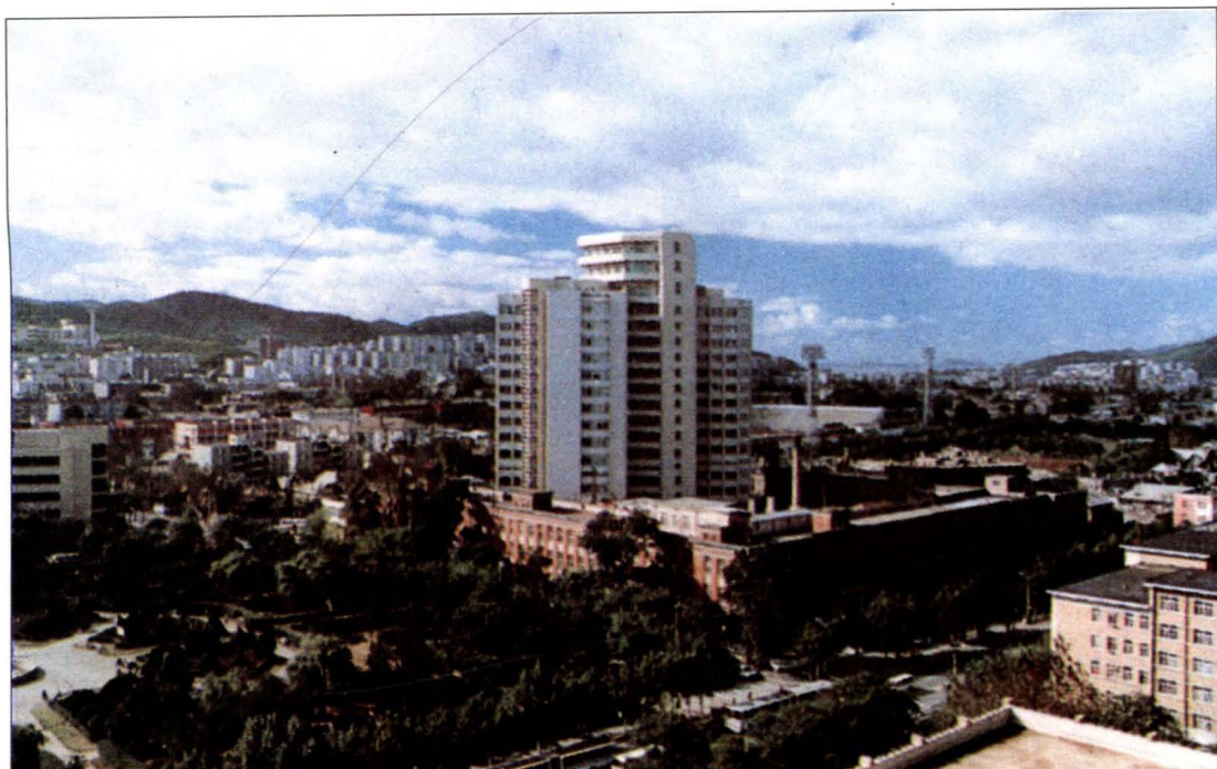
大连医学院附属第一医院外景