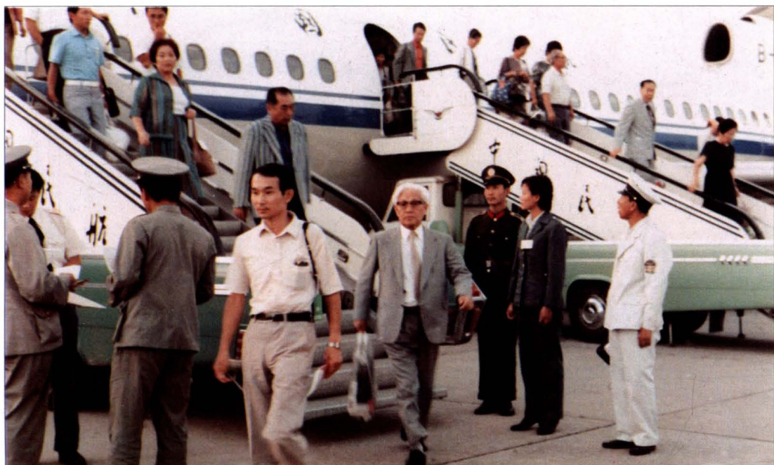
沈阳卫生检疫所检疫人员在机下视诊检疫