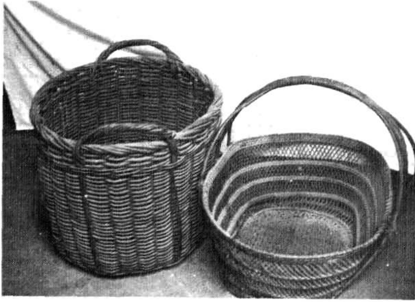
我市新加坡归侨在国外使 用过的部分物品。