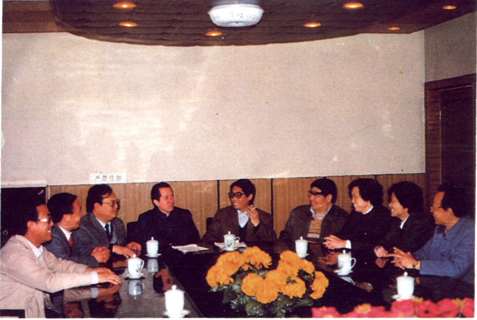
桥东区委、区政府领导听取教育志编写情况汇报。从左至右：区委常委副区长刘恩保（左三）、区委书记樊恒鑫（左四）、区长周梦基（左五）、副书记刘明军（左六）、副区长温纪芝（左七）。