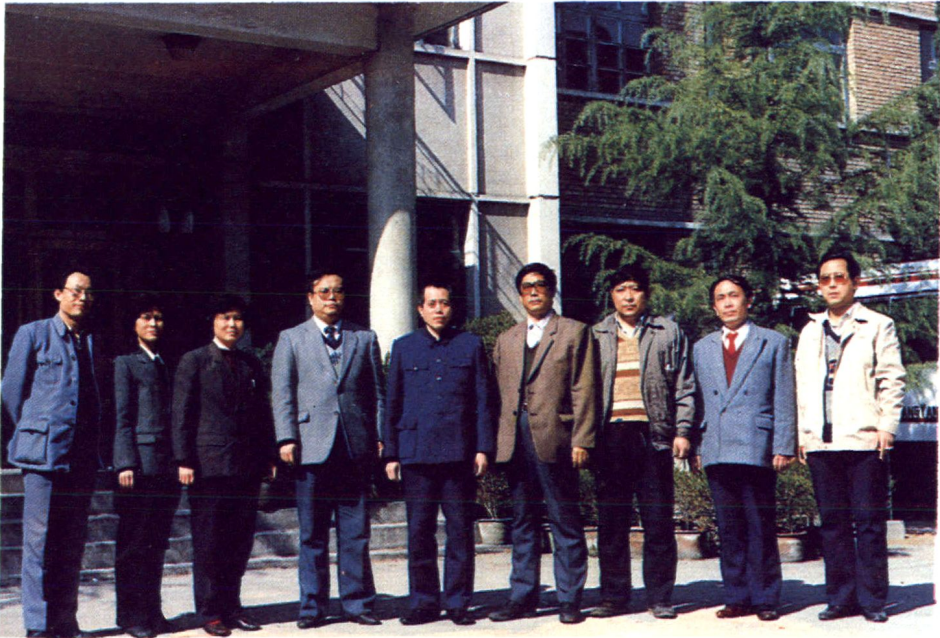
桥东区委、区政府领导同教育志编写领导小组同志在一起。