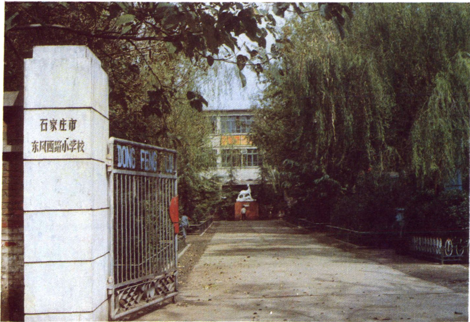
花园式学校——东风西路小学（1981）