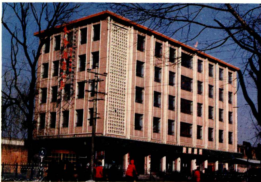
呼市蔬菜公司新建办公大楼