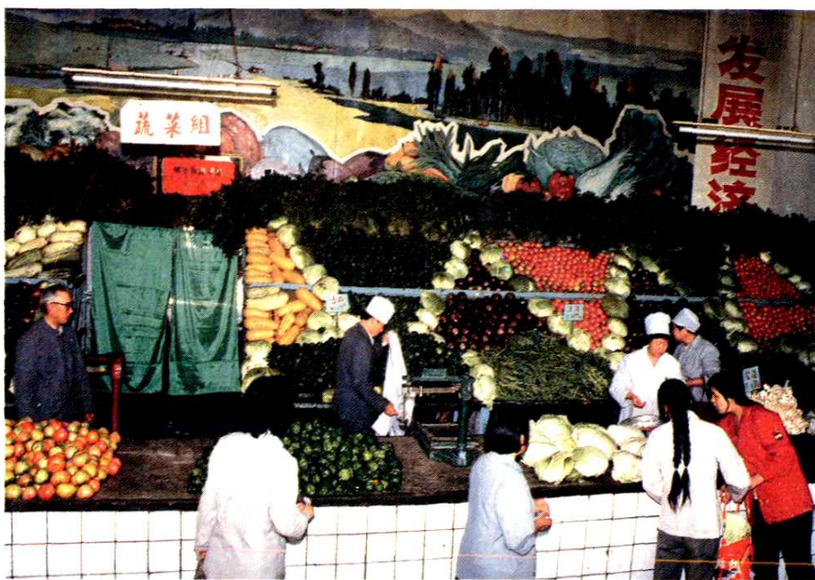
中山西路菜市场陈列丰满