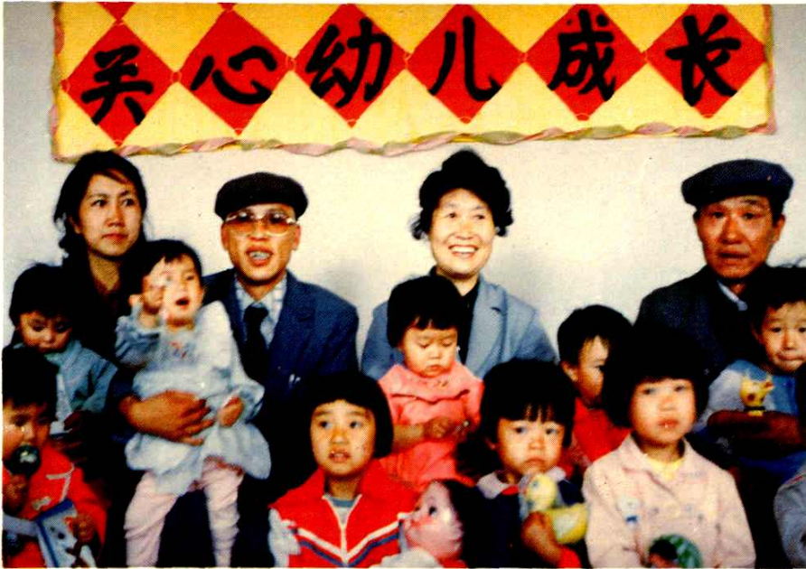
公司党政工团负责同志慰问大台托儿所