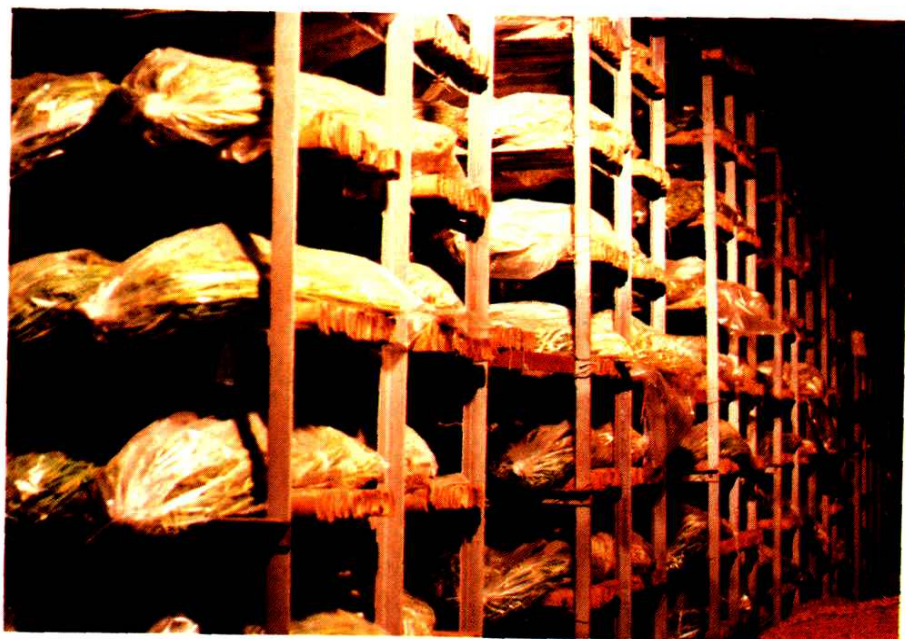
已进入贮藏期蒜台