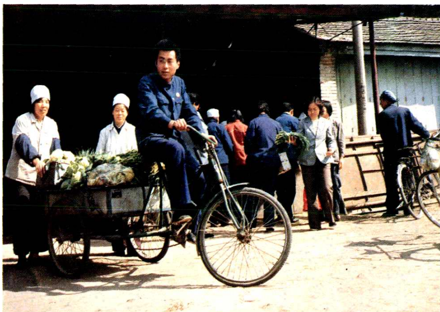
海西商店菜组坚持为盲人送货上门