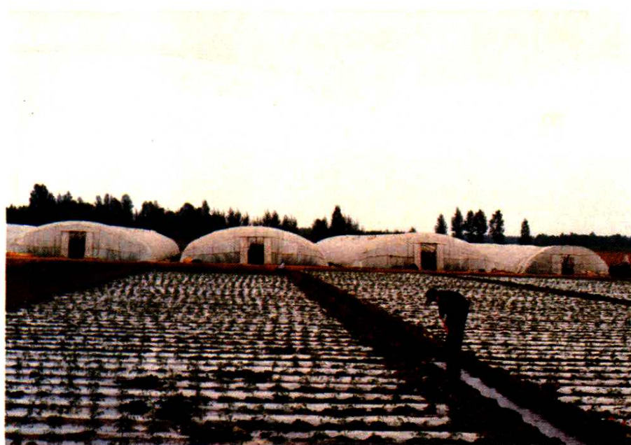
呼市郊区塑料大棚生产