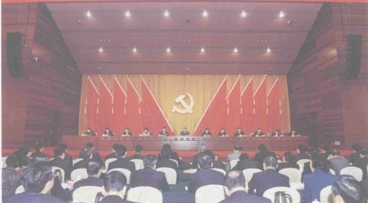
广东省委十一届三次会议