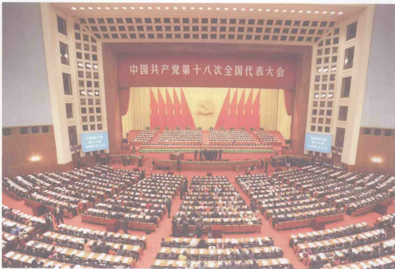
党的十八大提出“建设海洋强国”战略