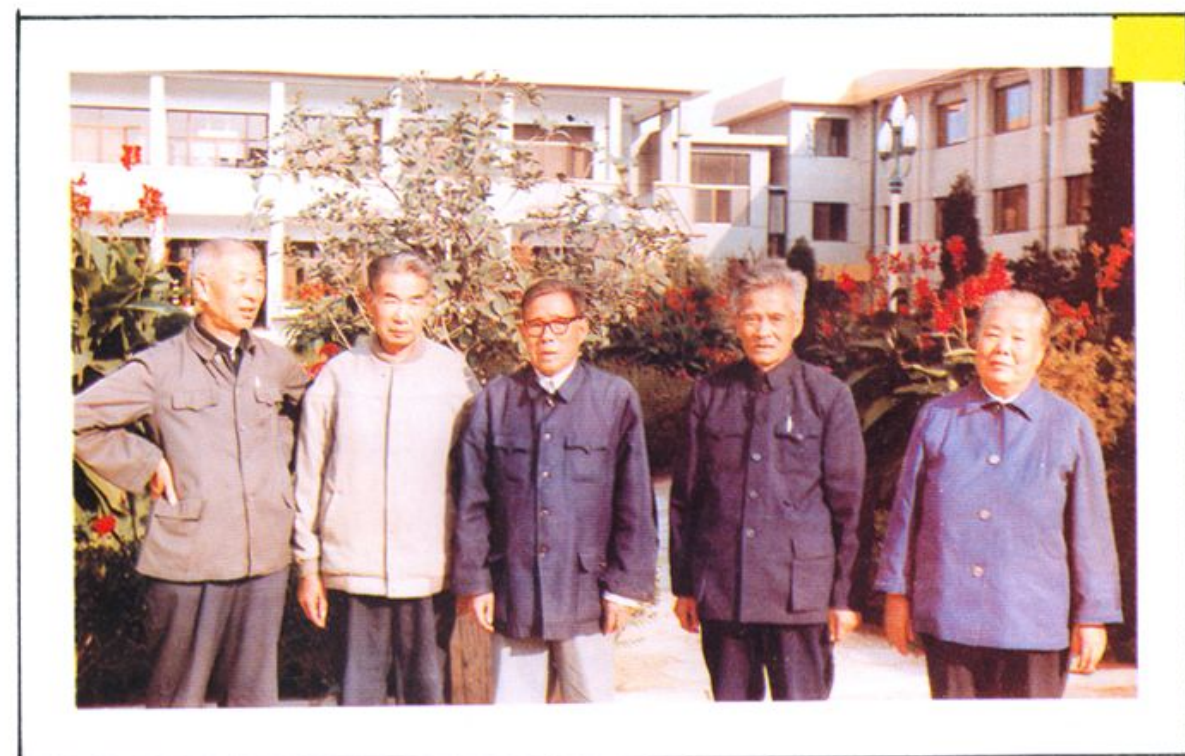
■ 1972年~1984年6月期间院领导合影