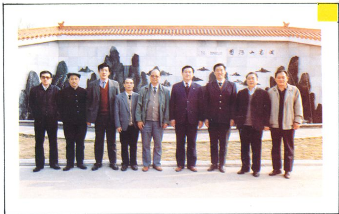
■ 韩英来院检查指导工作