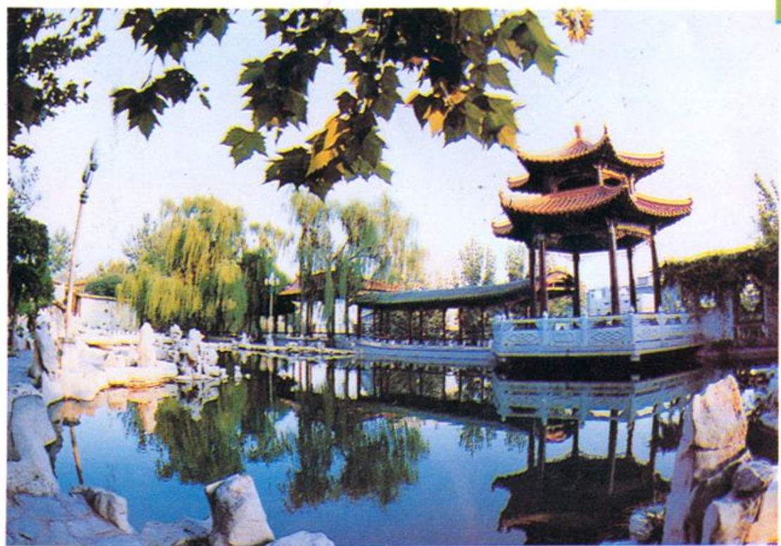
療養區環境幽靜的靜雅園