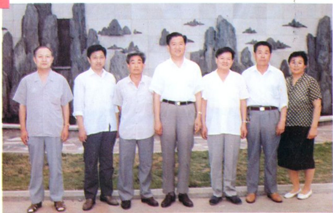
1993年1月5日院党委领导班子成员合影