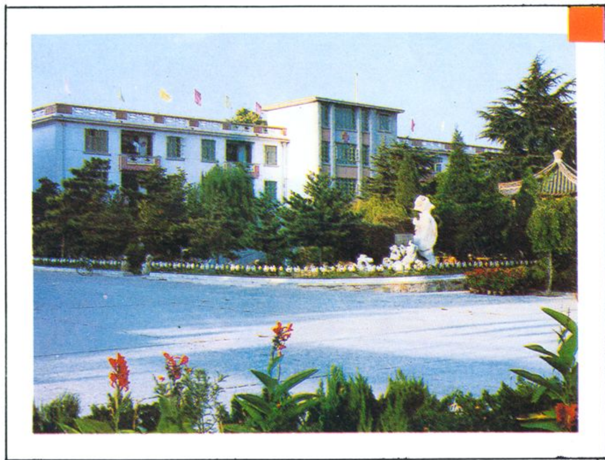
疗养院大门及疗养病房楼