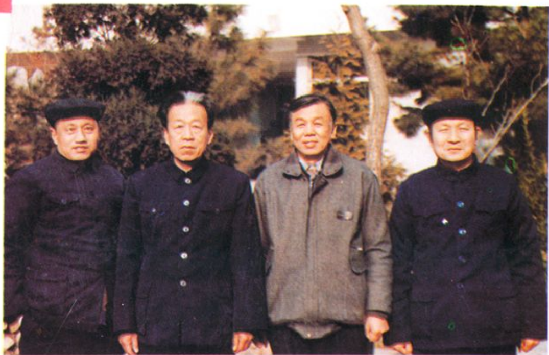
1984年6月~1990年12月期间院领导合影