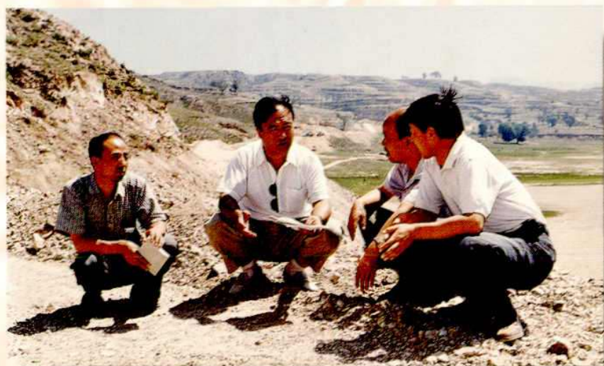
◀ 交通局领导在工地现场办公