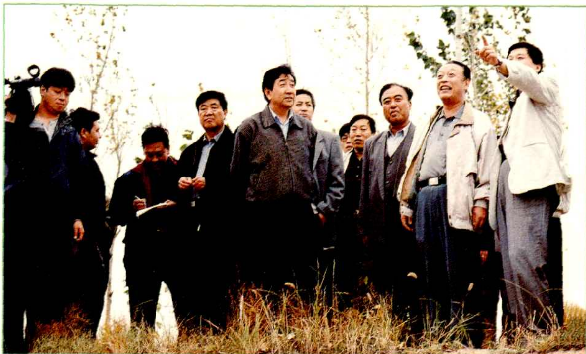
▲ 省委常委、市委书记纪馨芳等领导来娄烦指导工作