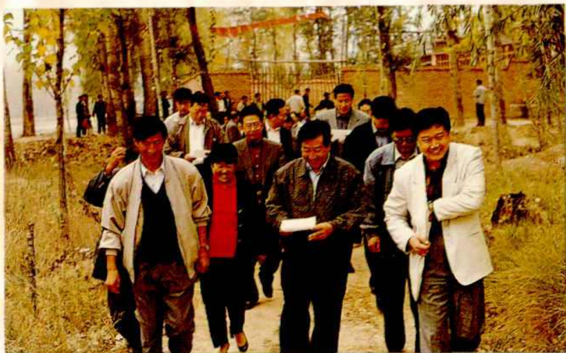
▶ 省委常委、市委书记纪馨芳在县委书记毋青松、县长王茂健陪同下指导工作