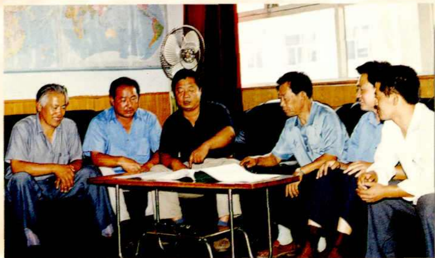
▶ 公路段领导研究工作