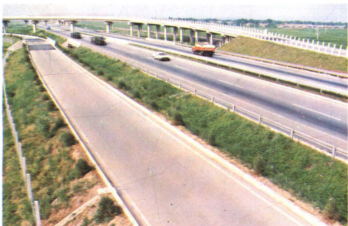
沈阳至大连高速公路沈阳段