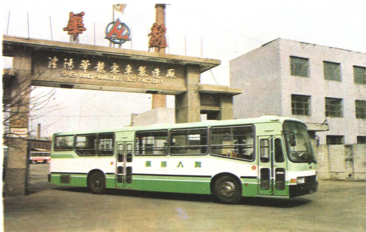
沈阳华龙客车制造厂制造的无人售票车