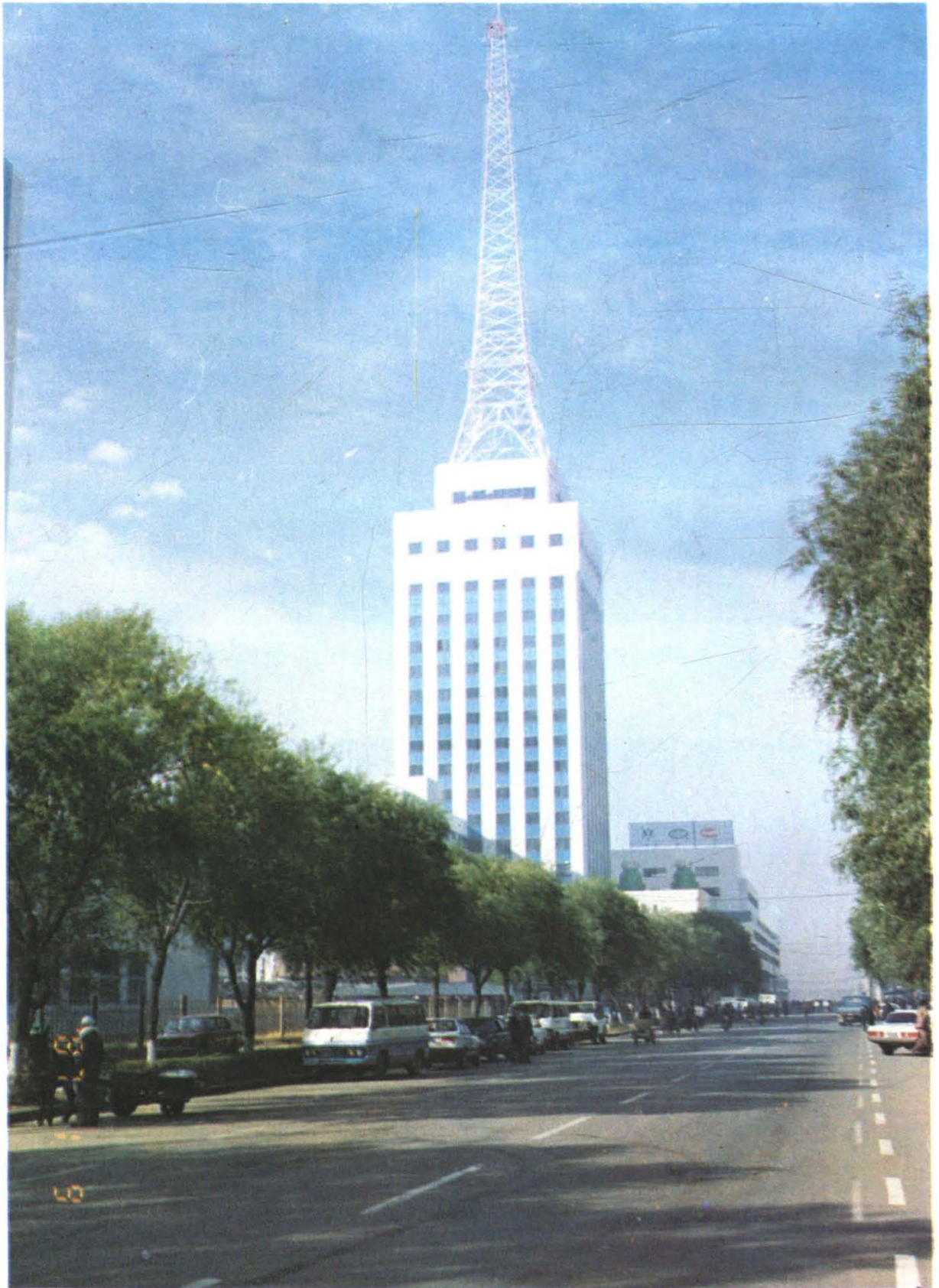
沈阳公路运输主枢纽信息通信指挥中心