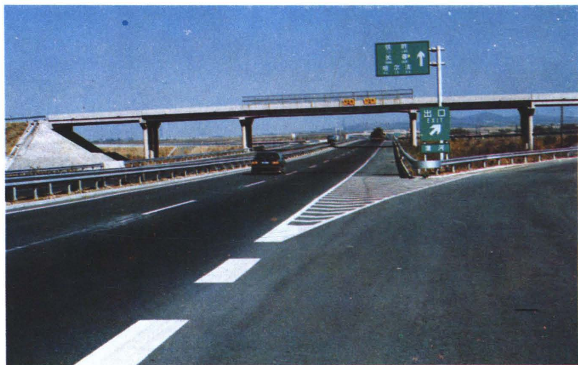
沈阳——铁岭高速公路沈阳段蒲河出口