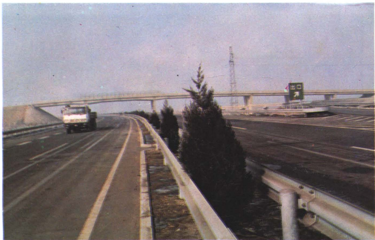
沈阳绕城高速公路苏北段