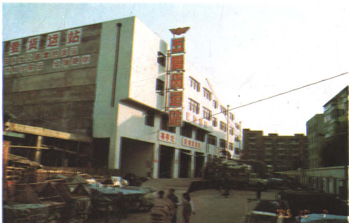
五爱客货联运总站货运站