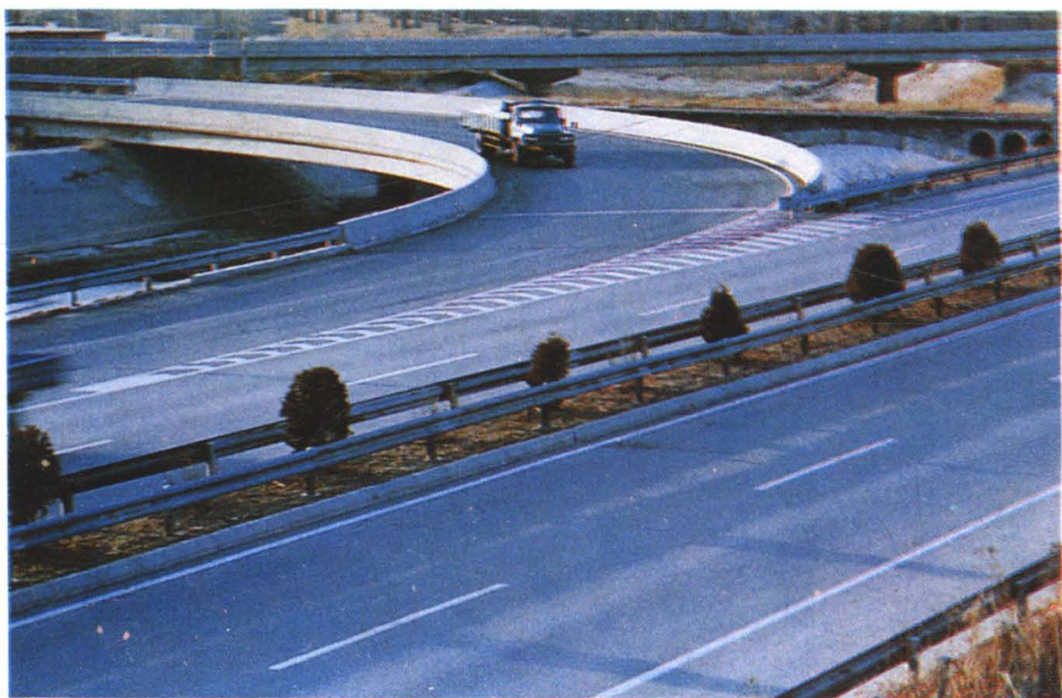
沈阳—本溪高速公路