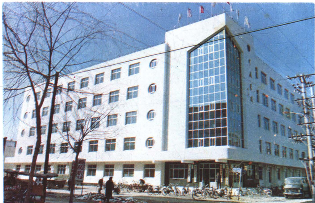
辽中县交通运输管理站