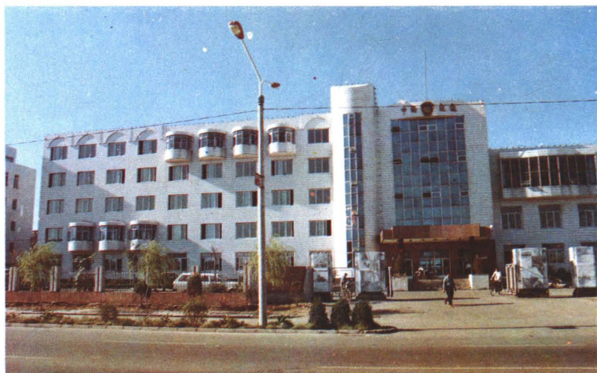
苏家屯区交通运输综合楼