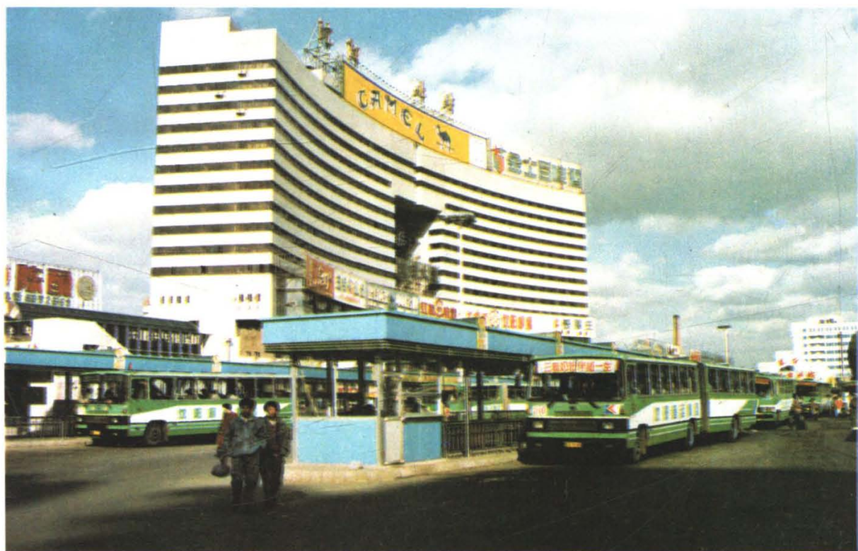
沈阳北站 320 延长米的公共电、汽车候车廊