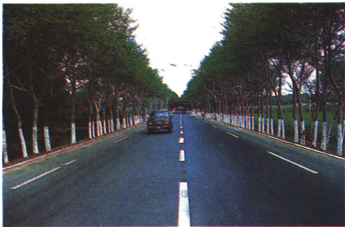
北京——哈尔滨公路沈阳段 GBM 标准公路