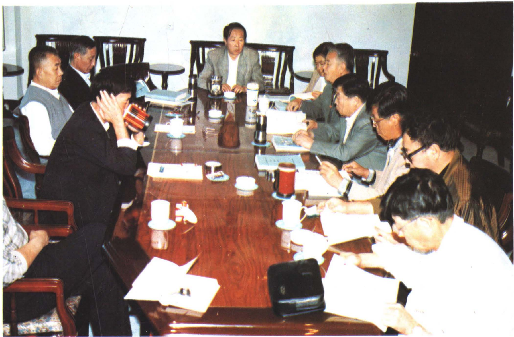
沈阳市公路公共交通史编审委员会开会审议确定