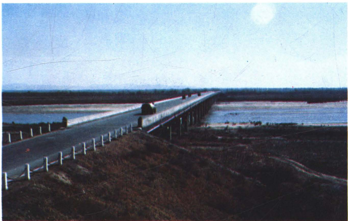
明水——沈阳公路辽河鲁家大桥