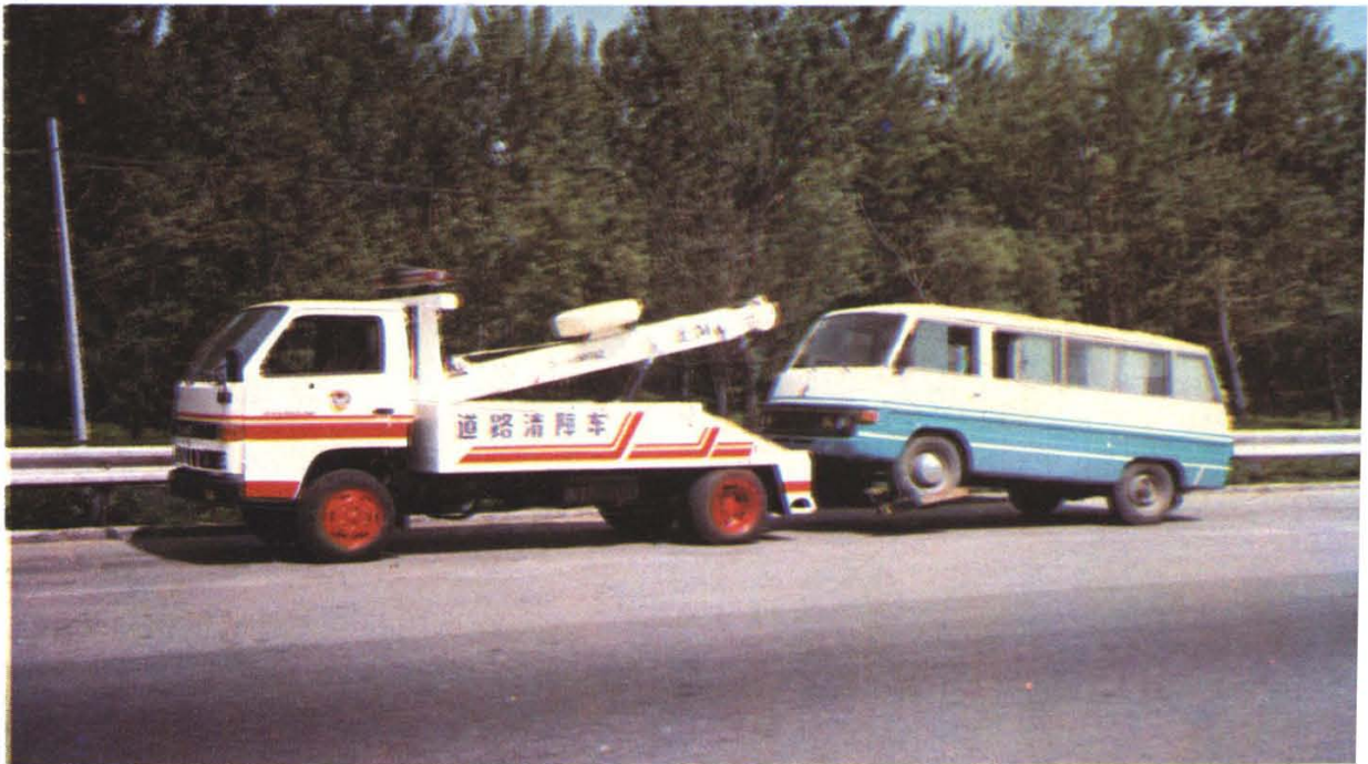
沈阳市安装搬运集团公司下属的沈阳市交通机械厂生产的 LE3—12 型道路清障车在路上清障