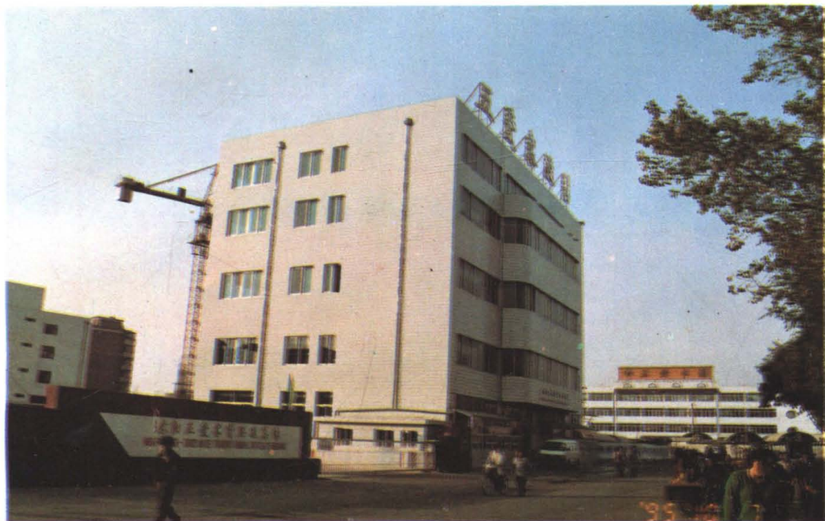
五爱客货联运总站客运站