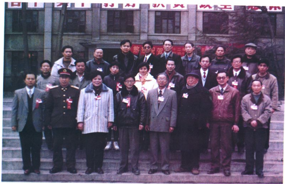
筠连县政协十一届全体常委合影