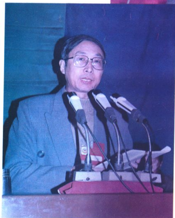
左图：十届、十一届政协主席陈志义在十一届一次全会上作常委会工作报告。