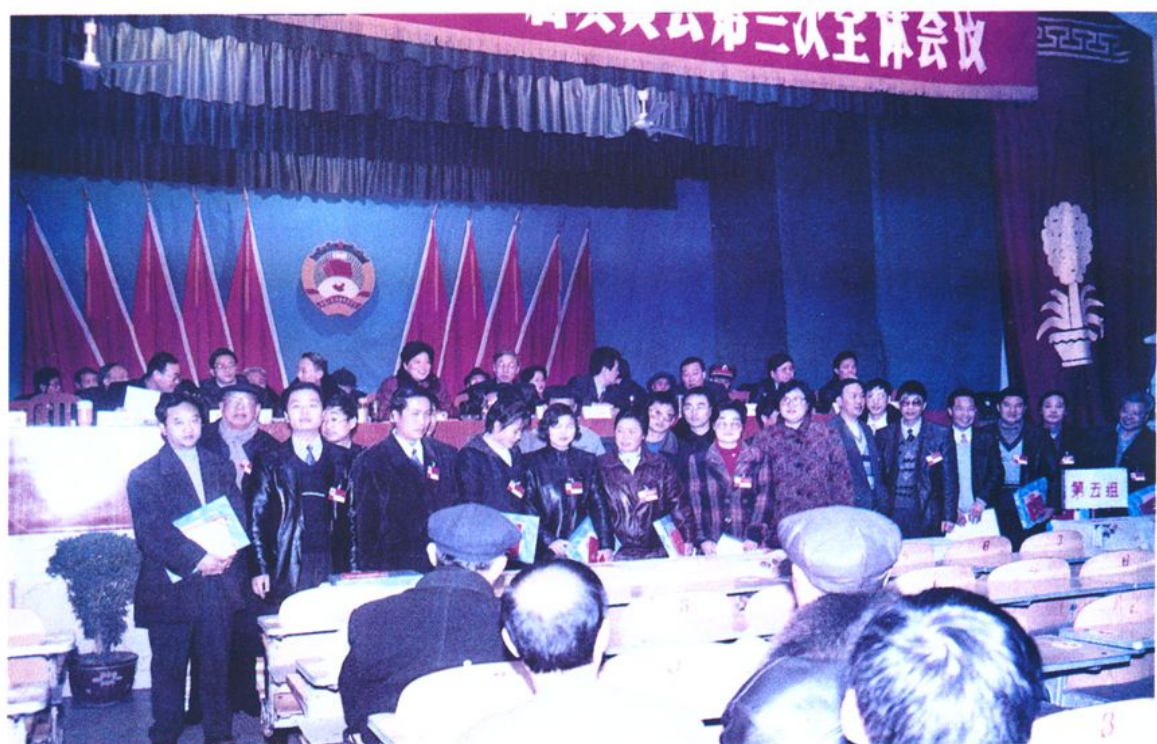
筠连县政协十一届二次全会表彰的优秀委员合影