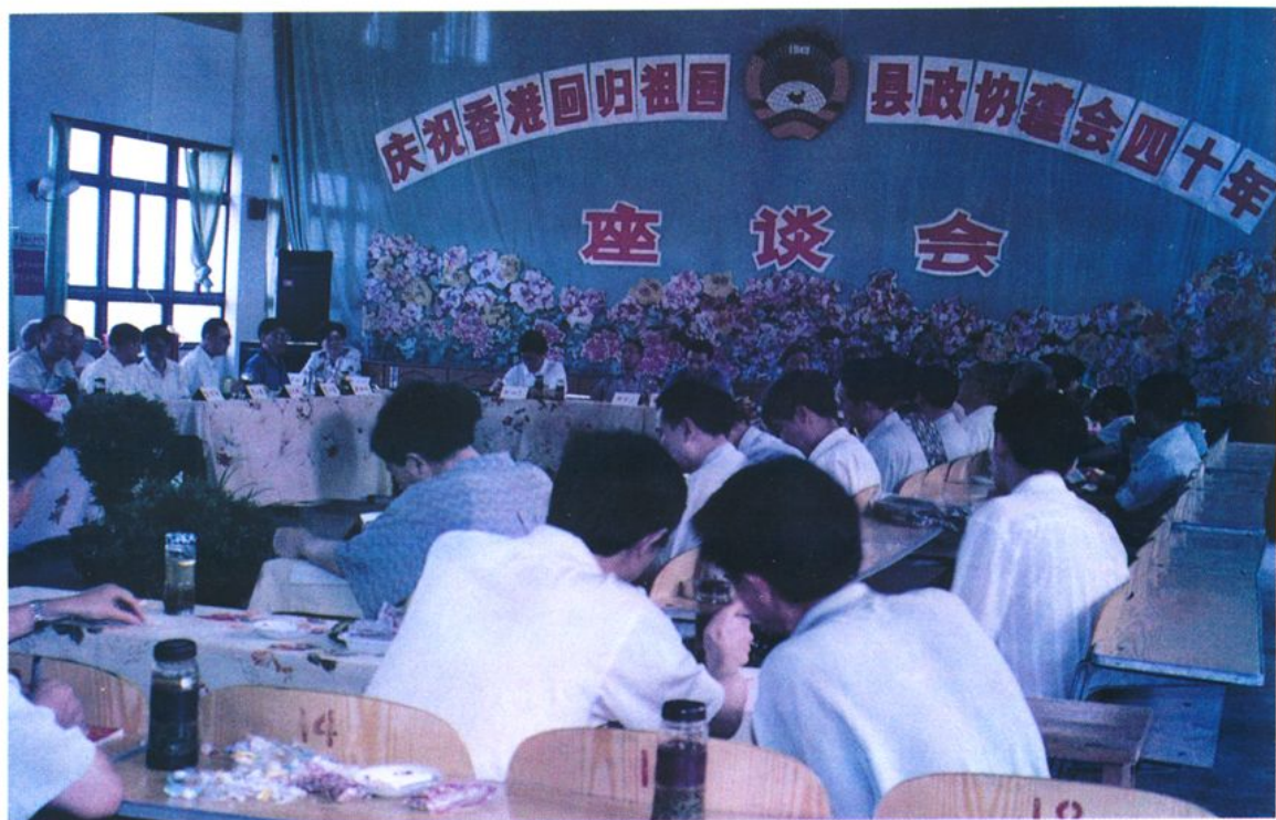
庆祝香港回归祖国，县政协建会四十周年座谈会