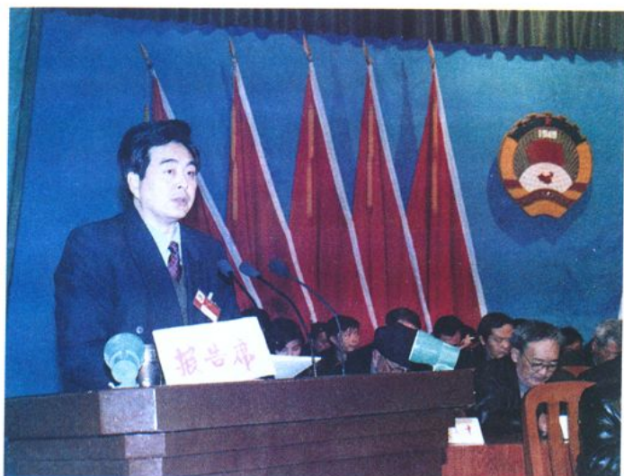
图为县委书记刘虹在县政协第十一届三次全会上作重要讲话。