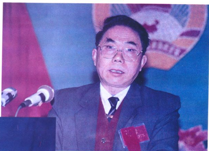
右图：九届政协副主席冯显泽在九届三次全会上作常委会工作报告。