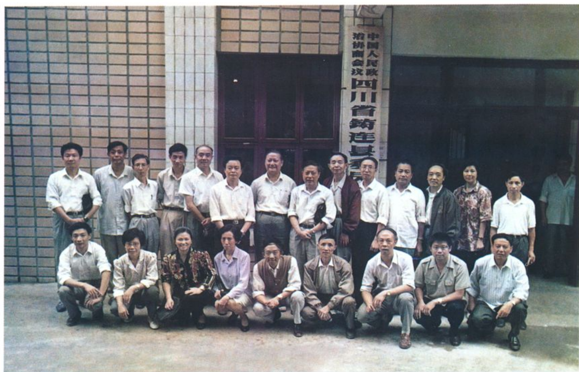
省政协副主席韩邦彦(后排左七)一行来我县视察工作到政协机关看望全体工作人员