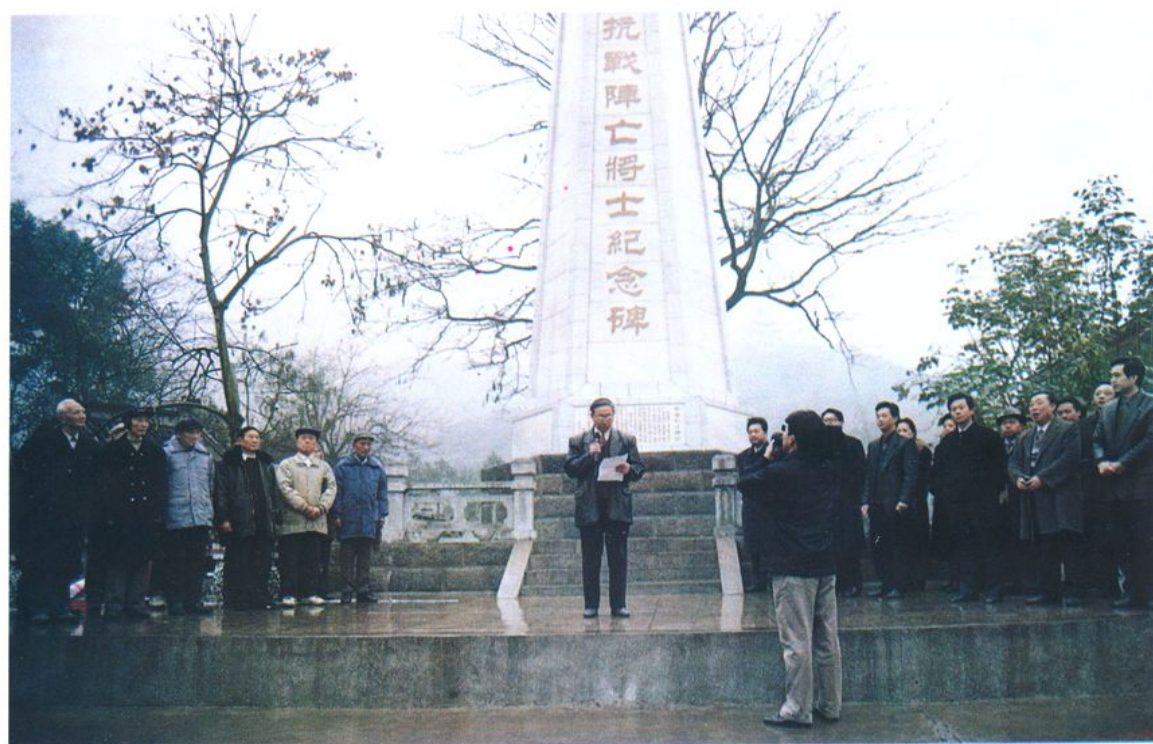
政协柯桥联络组捐资重建《抗战阵亡将士纪念碑》揭幕仪式。