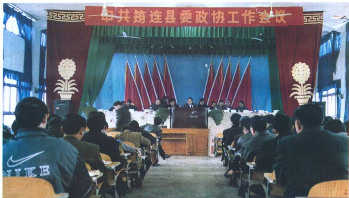
1999年1月17日，中共筠连县委召开第二次政协工作会议