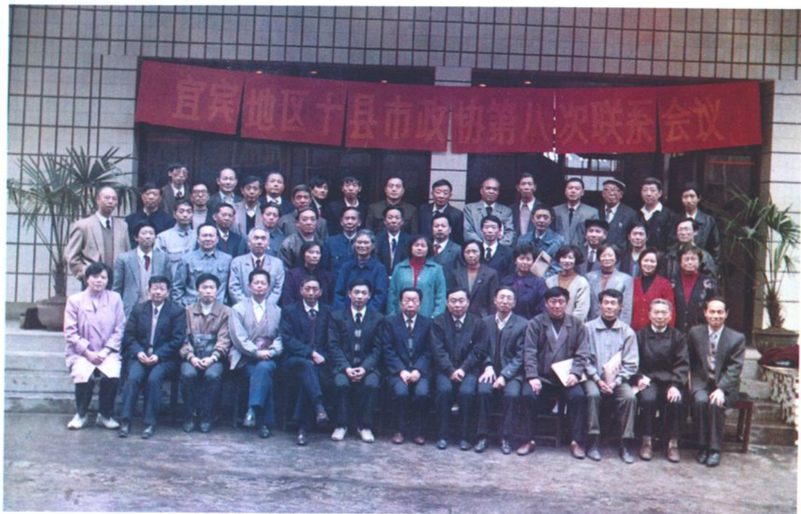
宜宾地区十县(市)第八次政协联系会在筠召开