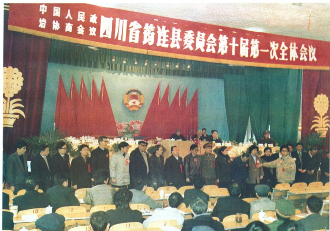
政协十届一次全会会场