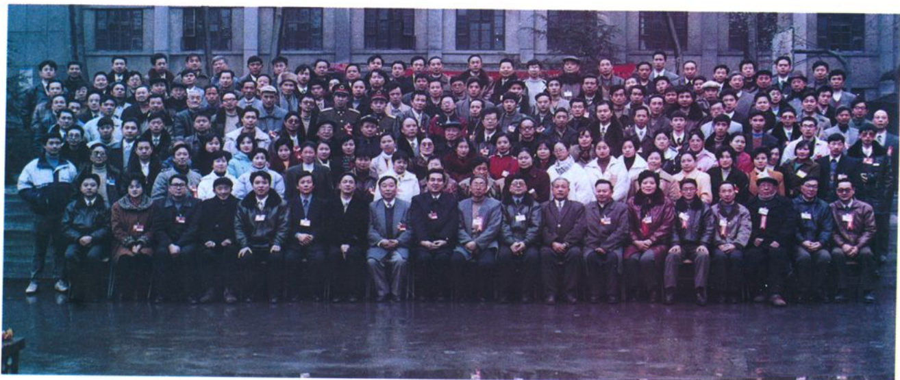
筠连县政协十一届一次全会全体委员合影(1997年12月27日)