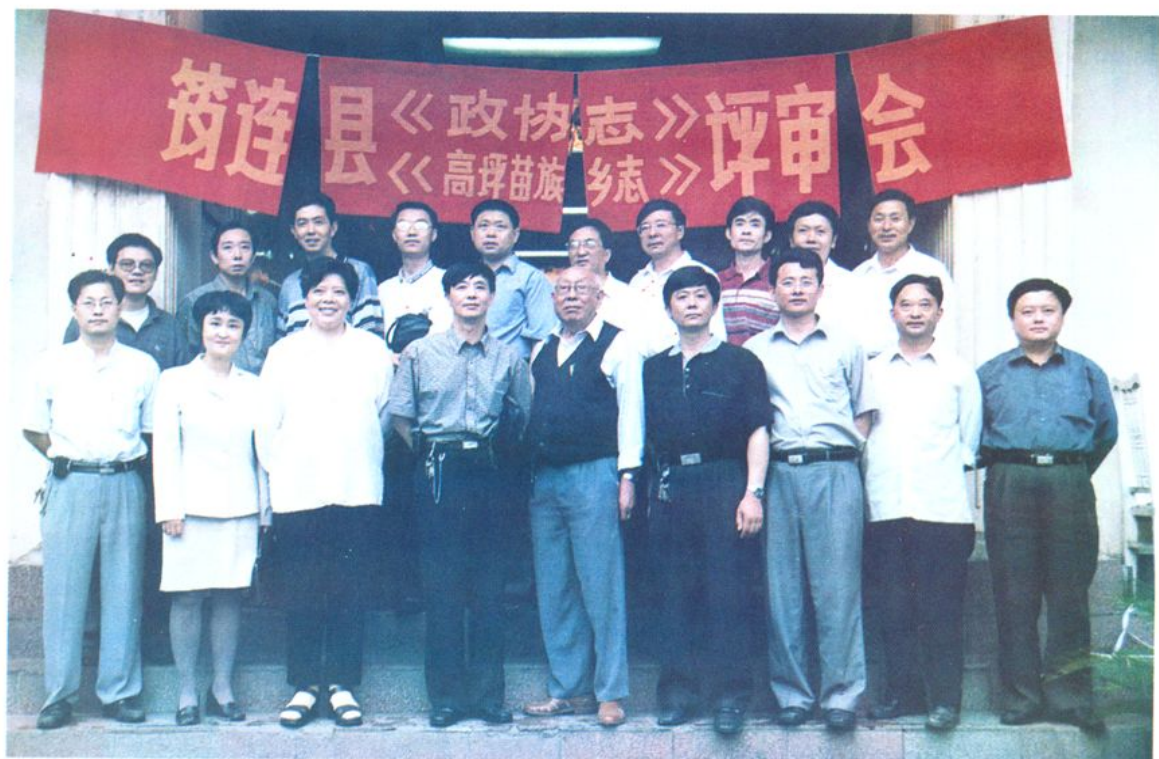
《筠连县政协志》评审会合影