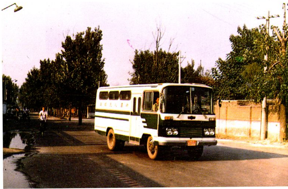
自办邮路邮政汽车正在疏送邮件