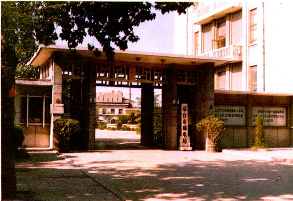
邢台市邮电局大门口