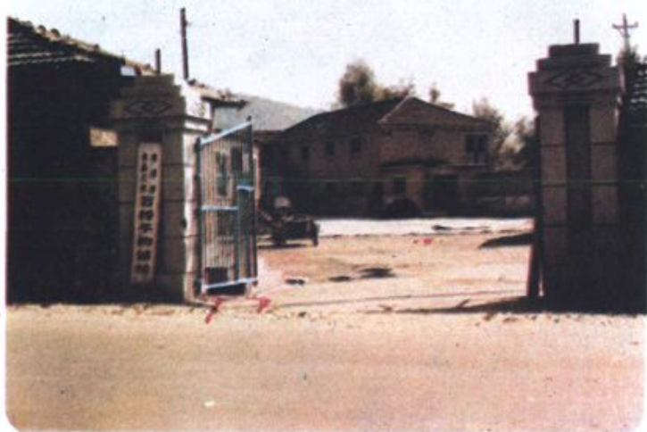
► 石桥子食品购销站大门