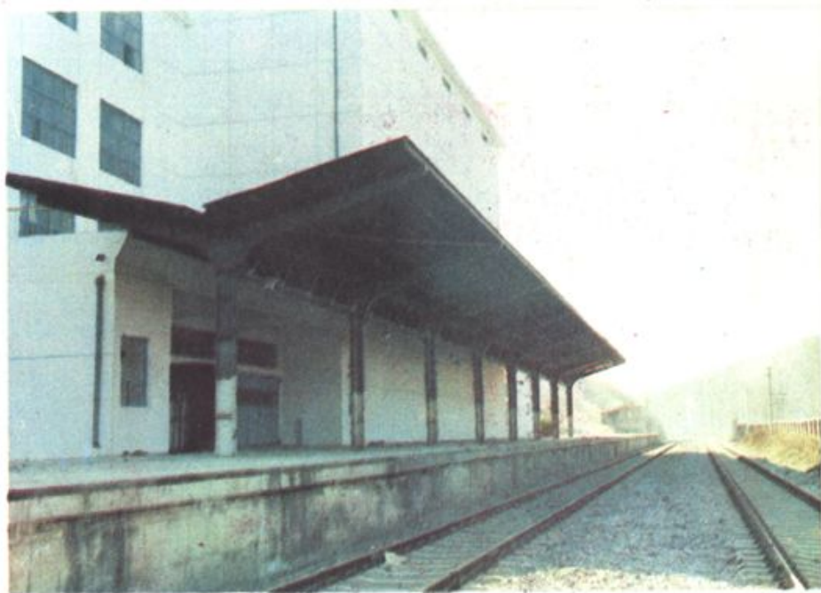
▲ 冷冻厂铁路专用线