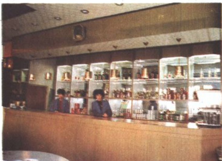
◀ 龙凤餐厅食品柜台