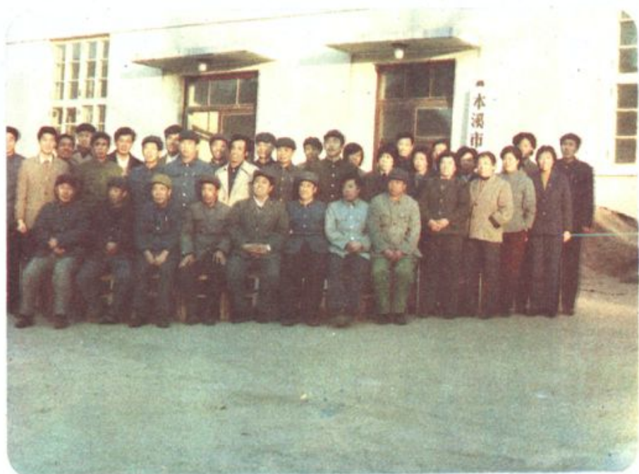
▲ 公司科级、副科级干部合影