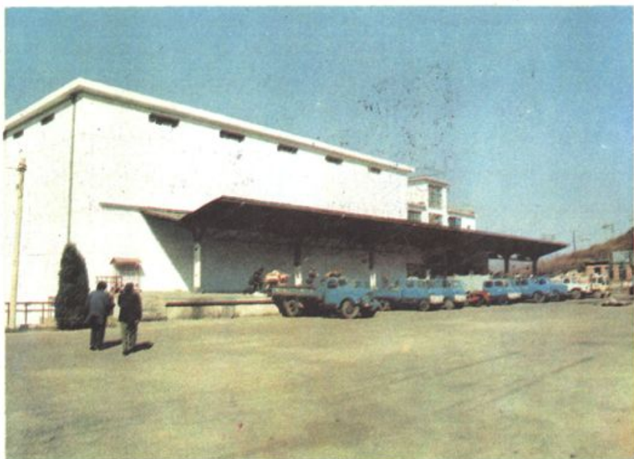
▲ 五千吨冷库付货平台