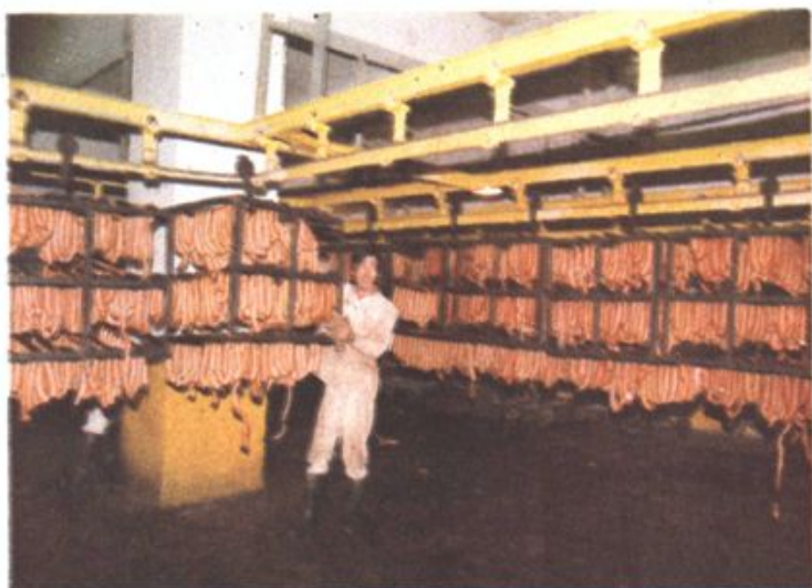
▶ 熟食品加工厂灌肠车间